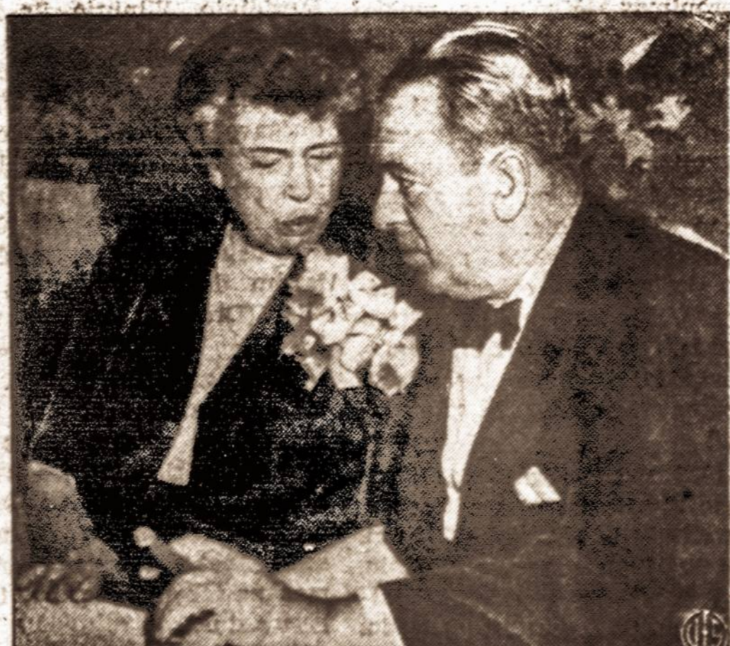
New Yorko vaistybės demokratų partijos metinėse vakarėnėse, kur kiekvienam dalyviui kaštavo po 100 dolerių, buvo apie 1,500 svečių ir jų tarpe Rooseveltienė su mėru O'Dwyer.