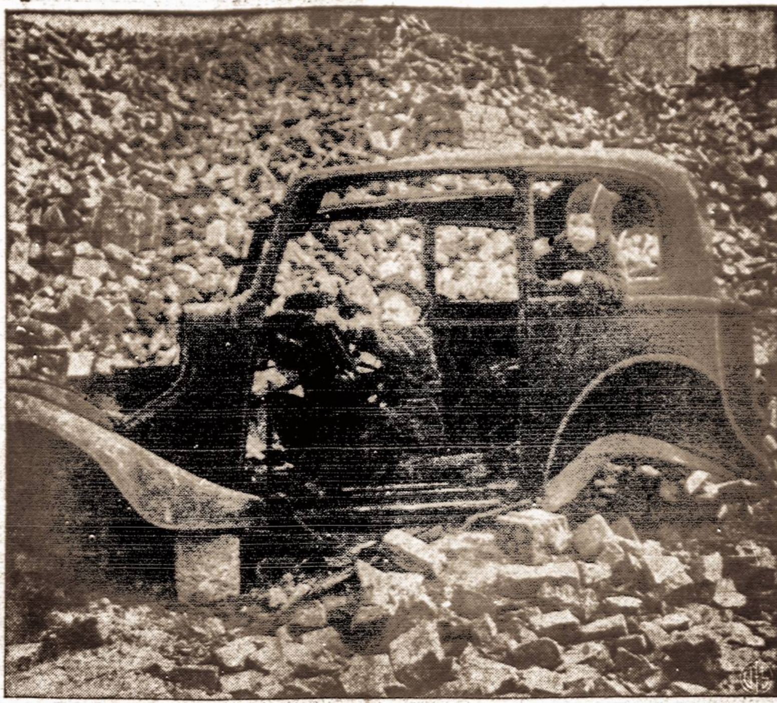
Kai nerūpestingi vaikai susitinka Berlyno griuvėsiuose...