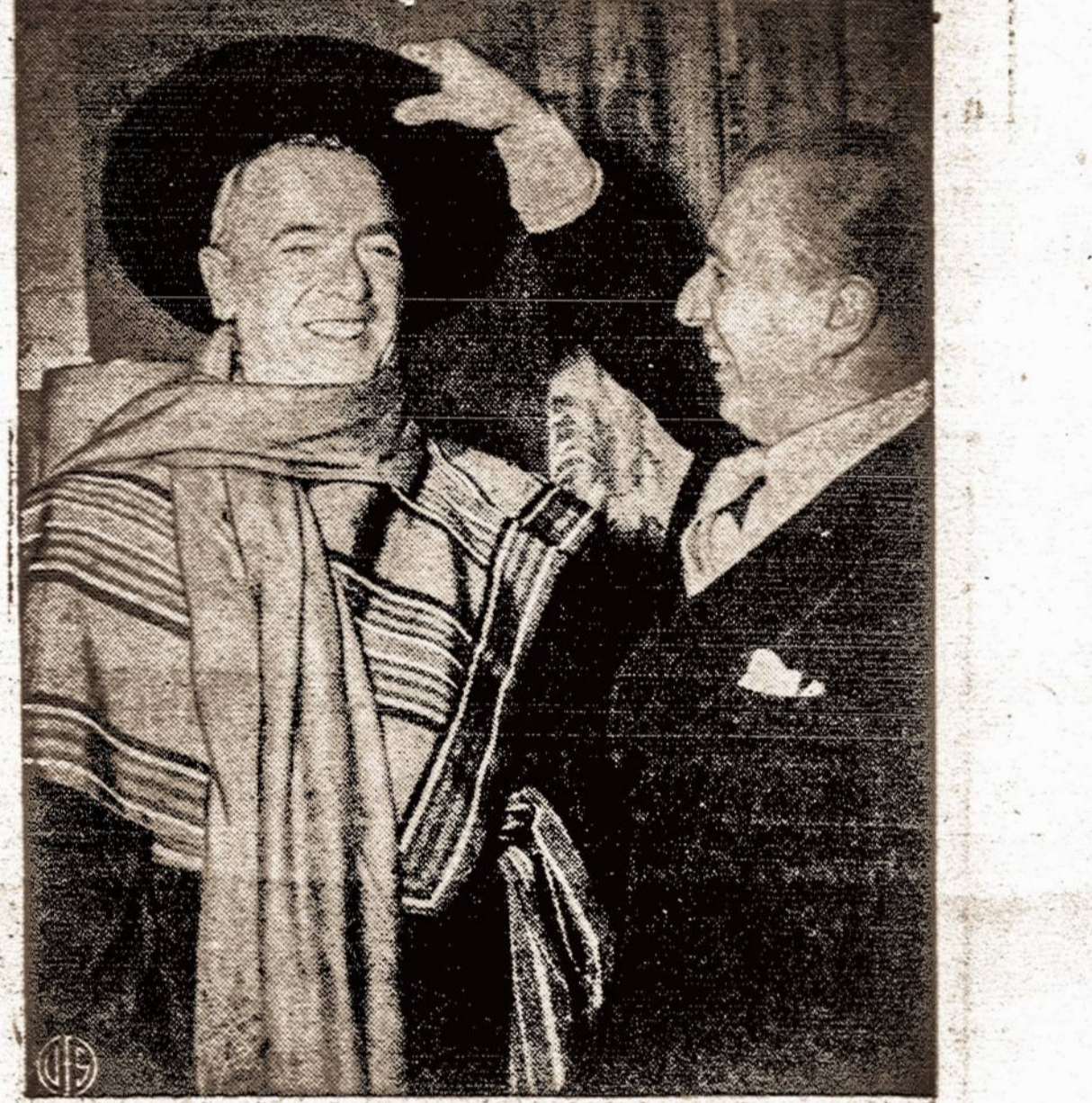
Cilės prezidentas Gabriel Gonzales, lankydamasis New Yorke, mėrą O'Dwyer apdovanojo savo krašto tautiniu kostiumu.