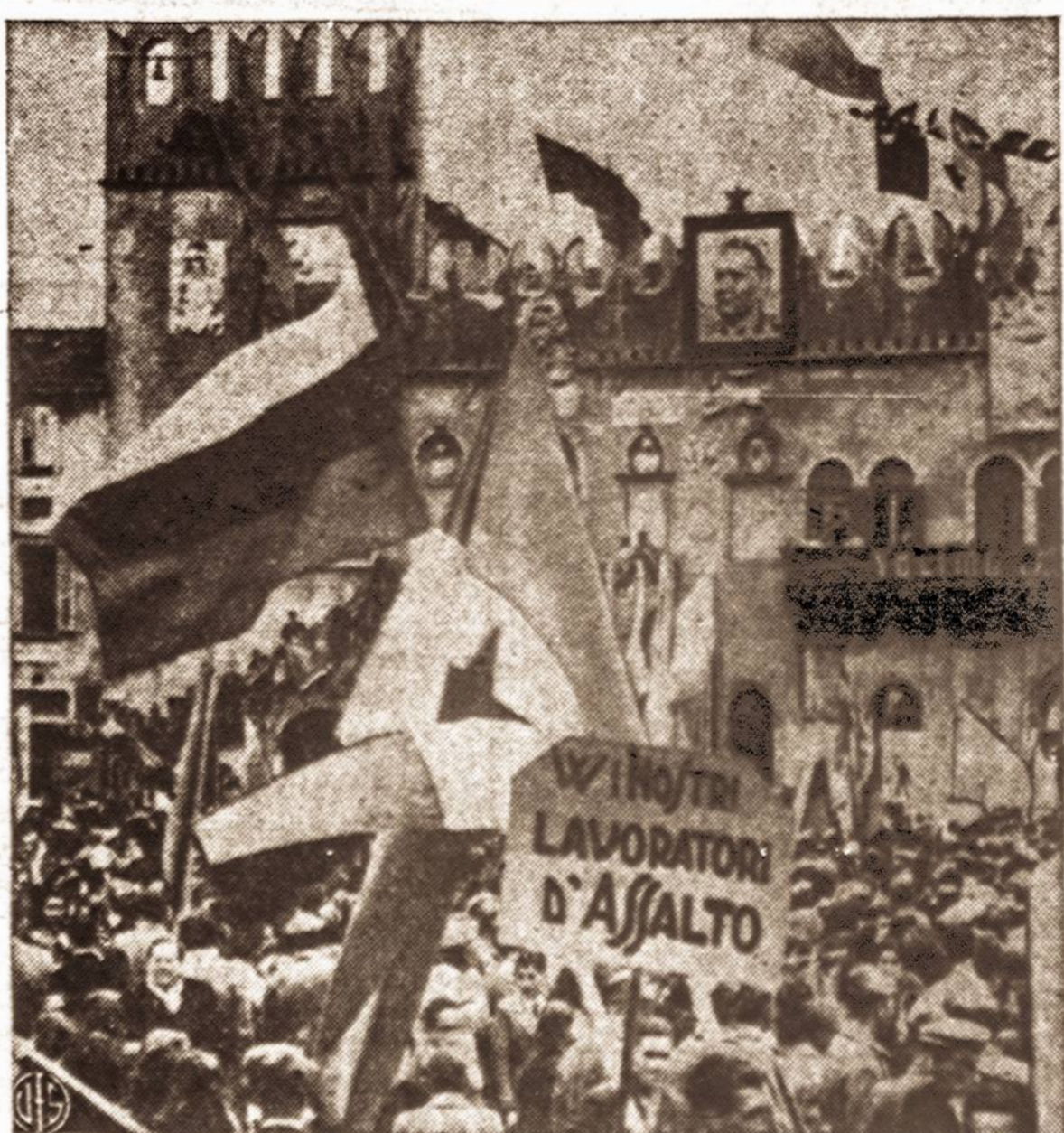
Neseniai įvykę jugoslavų kontroliuojamoje Triesto teritorijoje zonoje rinkimai buvo laimėti 100 nuošimčių maršalo Tito naudai.

Pirmieji JAV ginklų transportai JAV karinės pagalbos ribose pasiekė Norvegiją.