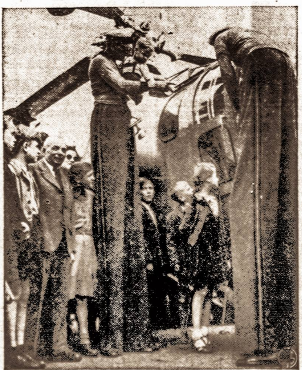
"Anksči" Amerikos karo aviacijos pareigūnai priima Berlyno mažamečius, norinčius paskraidyti helikopteriu.

IRO vadovybė Vakarų Vokietijoje pranešė, kad apie 300,000 tremtinių, esančių Vak. Vokietijos DP stovyklose, birželio 30 d. bus perduoti vokiečių žiniai. Kaip žinia, tuo laiku ir oficialiai baigiasi IRO veikla. IRO nurodo, kad apie pusę iš tų 300,000 DP ilgi 1951 m. balandžio mėnesio dar turės išemigruoti. Iš Vokietijos atelanciomis žiniomis, jau prieš mėnesį pradėtas tremtinių perdavimas vokiečių įstaigoms. Manoma, kad birželio 30 d. laikoma galutiniu perdavimo terminu.