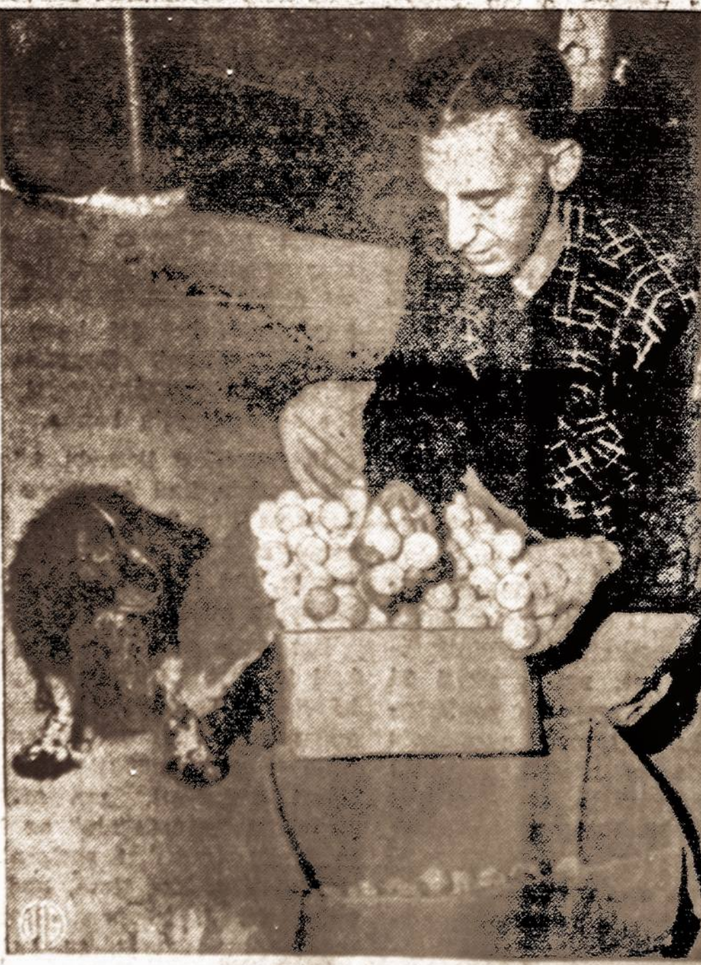
Kai golfininkai pameta sviedinius, tai šis vyras su žiniuku juos surenka. Šio specialiai išminto sunelio dėka, jis tų sviedinių yra surinkęs 5,000.

Viena Chicago gyventoja išsikyrė su savo vyrų dėl to, kad jis su savo draugais lošdavo pokerį iš stambių pinigų sumų. O kai su žmona namie lošdavo, tai tik iš 3 c.