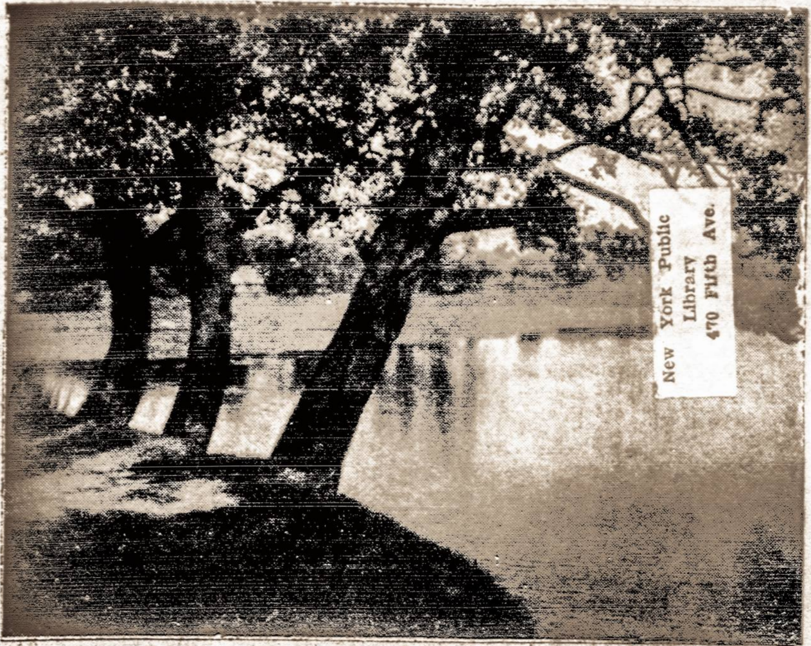
Nemunas ties Birštonu

Laivo keleiviai daugumoje yra estai, kiek latvių ir keletas lietuvių. "Pereitais metais jie sudarė bendrovę pirkti laivui, su kuriuo galėtų pigiai pasiekti Pietų Ameriką. Už jį sumokėjo 30,000 kr. (apie 6 tūkst. dolerių) ir apie 10,000 kronų pridėjo įrengimams. Nuvykę į Argentiną, jie ketina laivą parduoti ir susidaryti iš to pinigų gyvenimo pradžiai.