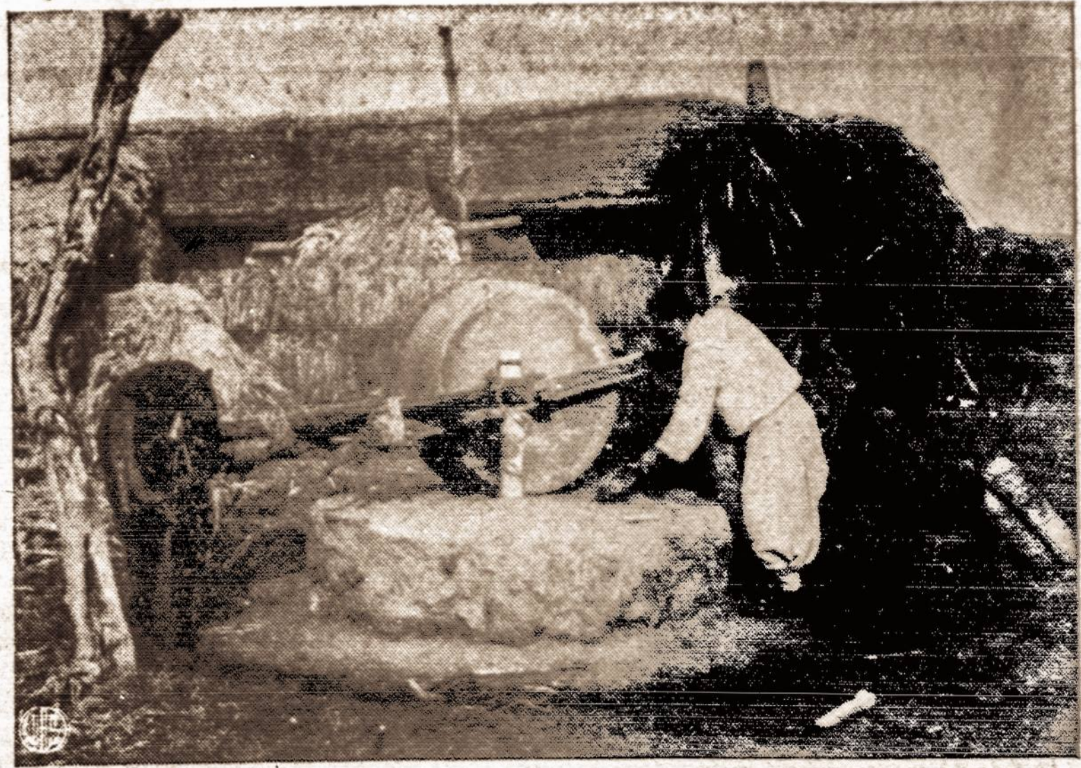
Siaurės Korėjos ūkininkas, pasiūkęs namie, nepaisant karo mūšių, kurie eina jo apylinkėje, dirba, kaip paprastai, savo darbu.

Tokį triuką Stalinas padarė ne viename Vilniuje: jis