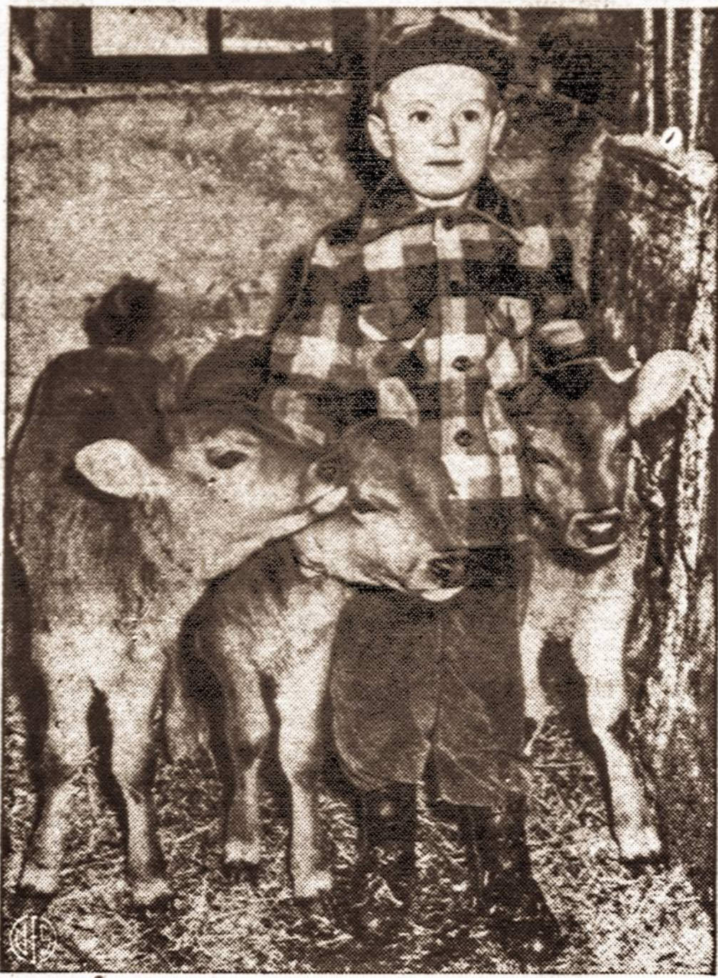
Berniukas džiaugiasi veršiukų trijule — reta gamtos dovana — kuriuos neseniai atvedė vieno Wisconsinso ūkininko karvė.