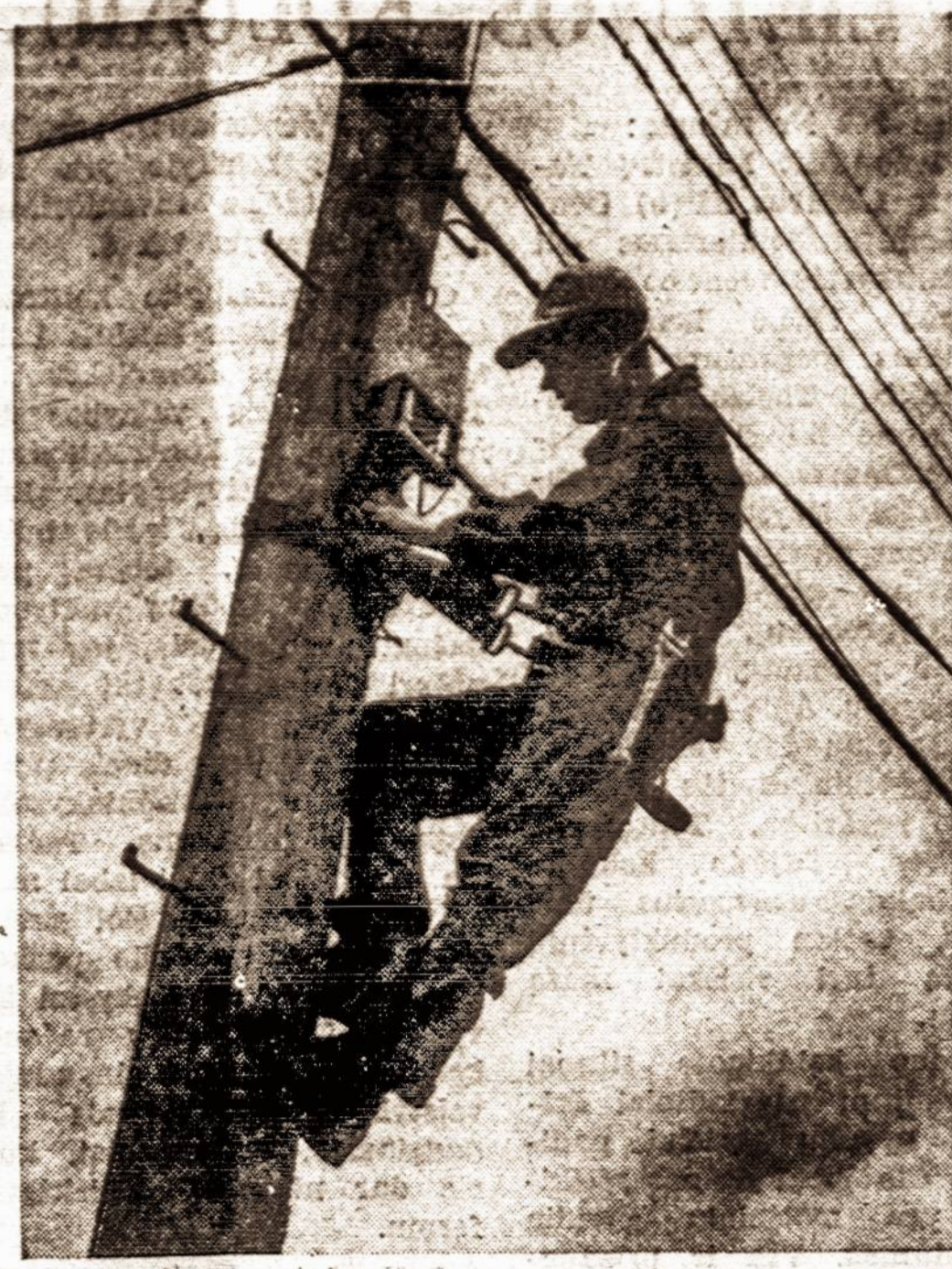
Amerikos lakūnas taiso laidus