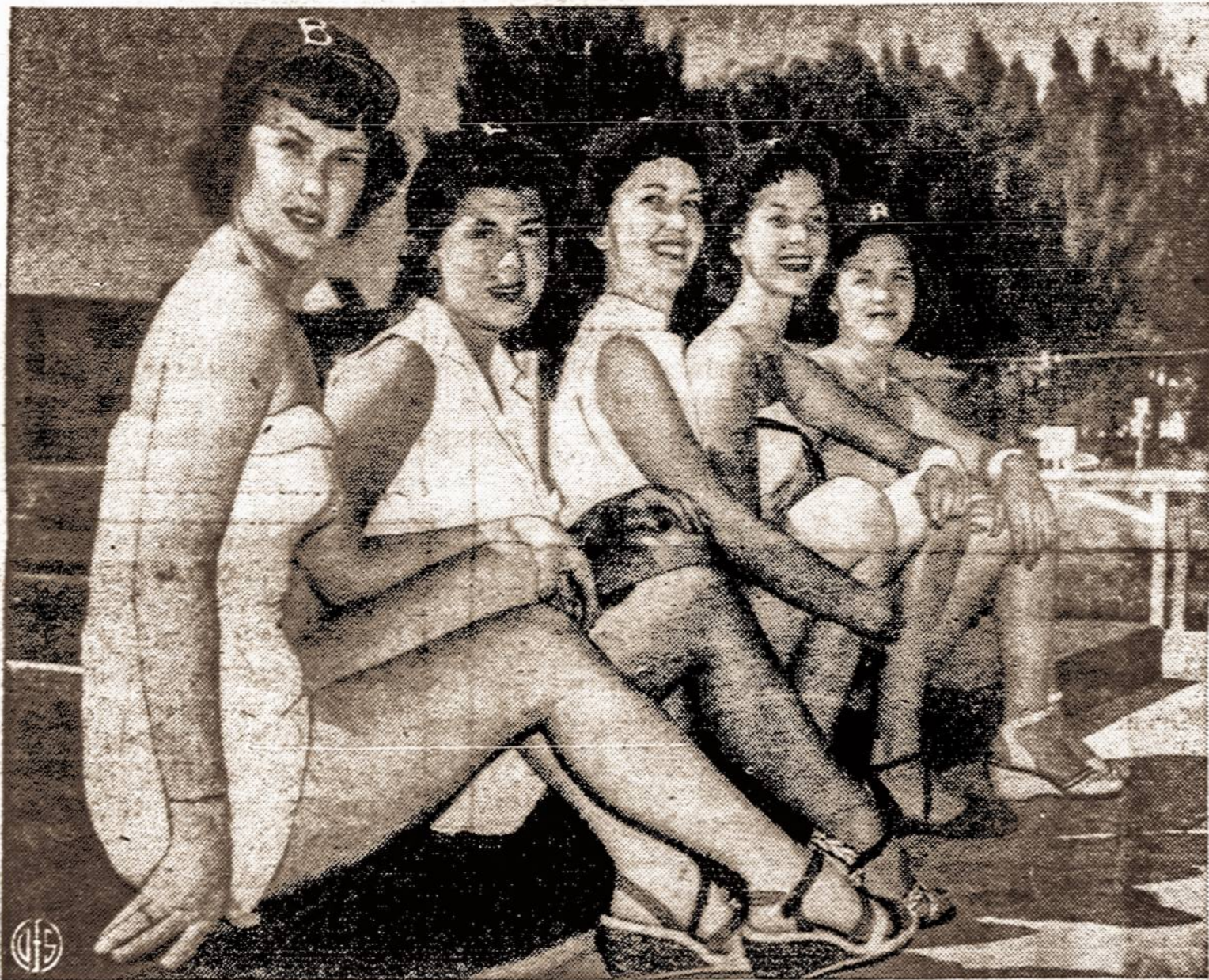
Brooklyno sportininkų žmones, kol jų žaidžia Vero Beach, Floridoje, šildosi pietų saulėje.

Prieš įstatymo pakaitimą yra ne tik katalikų, bet ir žydų bei protestonų dvasiškijs, stengdamos New York'e tarpusavy konkuruoti, kas yra geriausias moralybės saugotojas.