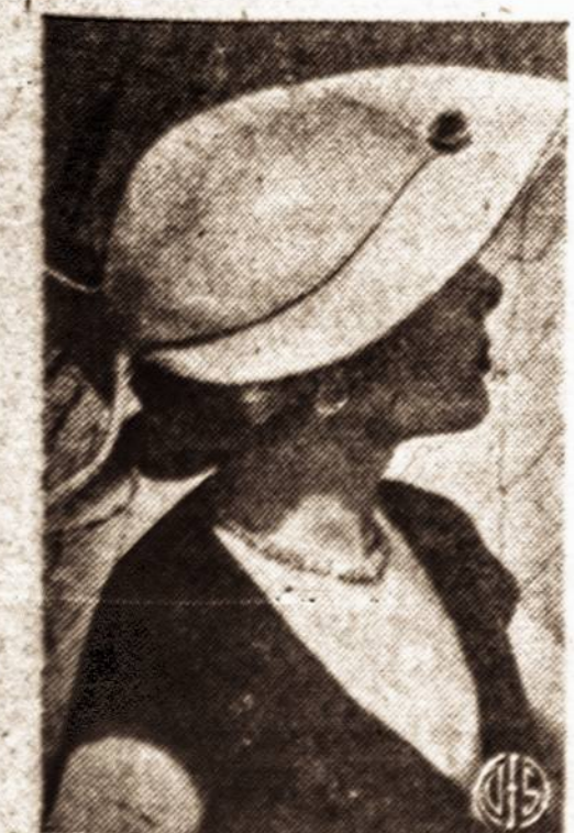
Pavasaris neša moterims naujas madas.