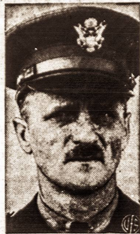
Lieut. Gen. Carl A. Spaatz

Generalas Carl Spaatz, buvęs Amerikos aviacijos štabo viršininkas paskutiniojo karo metu, pakviestas Senato atitinkamų komisijų išdėstyti savo pažūras dėl Amerikos ginklavimosi, pareiškė, kad Amerikos pergalė reikalinga nedelsiant suorganizuoti 250 grupių aviacijos.