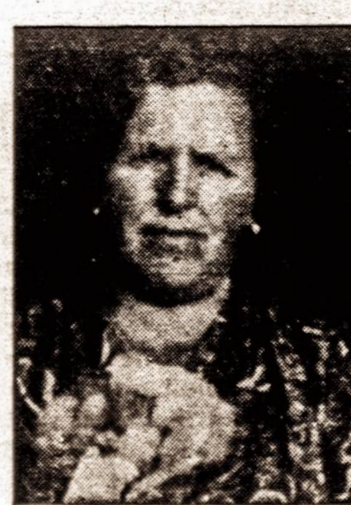
Brangus Daktare Miller:

SEKMINGAI PAGYDYTŲ PACIENTŲ PADEKOS LAISKAI