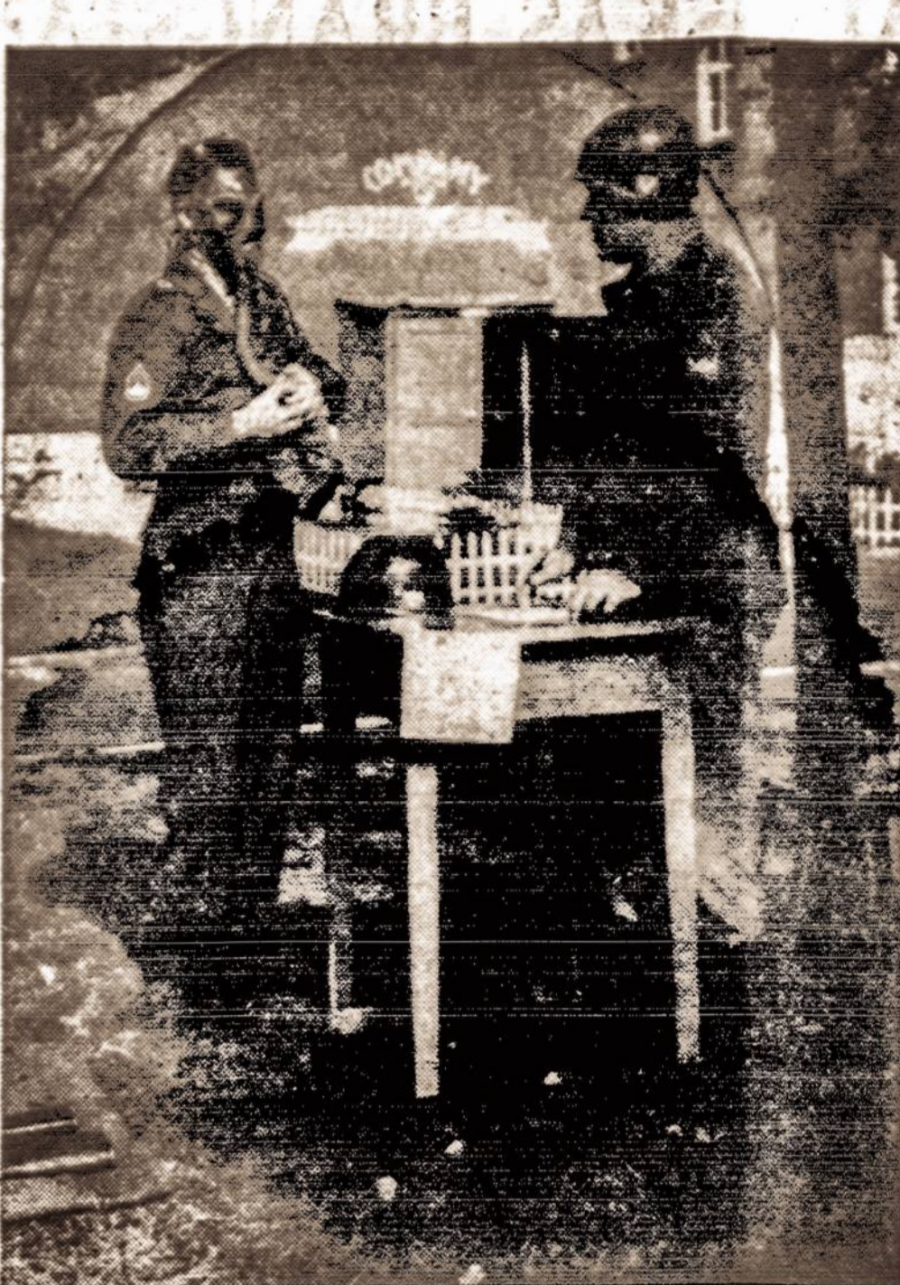
Kraujo auka Am. Raud. Kryžiu

Chicagos Draugas idėjo ži- nutę, "Dėl teisių DP gydyto- jams," kur nurodo, kad kai kurios valstybės, kaip South Dakota, Iowa, suteikė iš tre- mies atvykusiems gydytojams teises praktikuoti medicina ir gauti normalų atlyginimą, jeigu jie eina dirbti į valsty- bines ligonines. Toliau tas laikraštis sako: "mums pasie- kė žinios, kad yra planuojama panašų patvarkymą išleisti ir Illinois valstybėje. Pastelravę atitin-