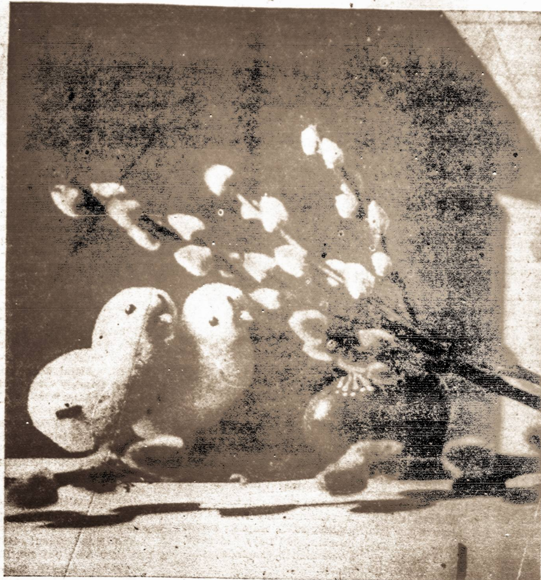
VISIEMS LINKSMŲ VELYKŲ — SAULĖTO PAVASARIO...