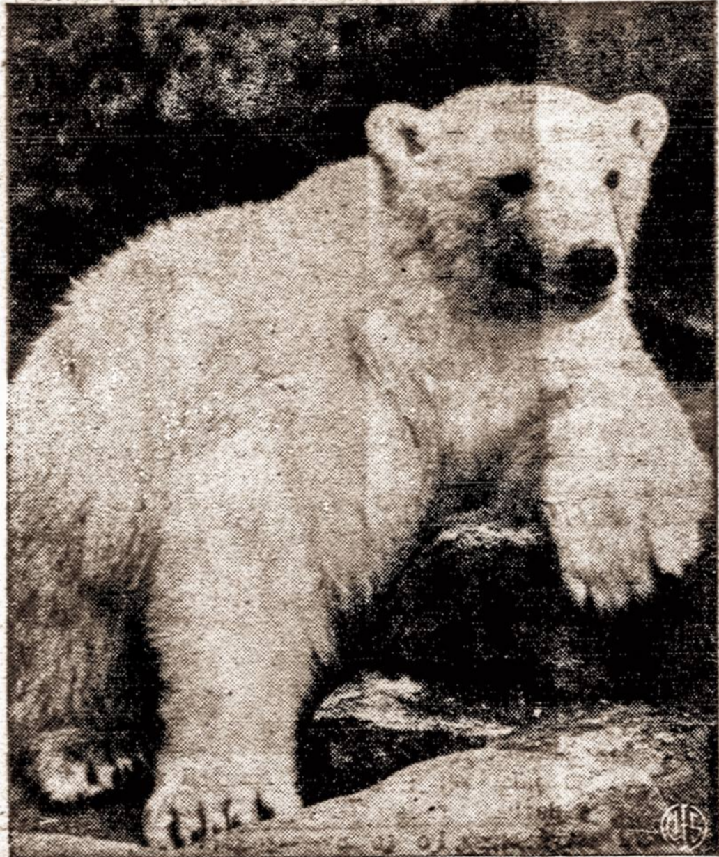
Karšta šiam polariniam gyvunui Los Angeles žvirnyje