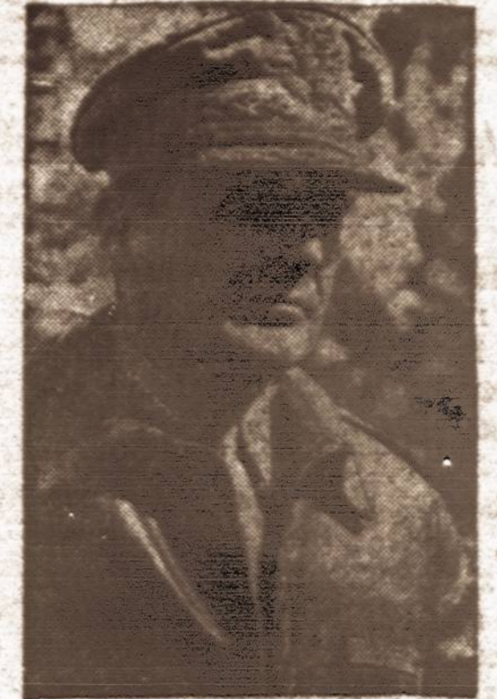
General Douglas MacArthur

Lietuvos nepriklausomybės atstėgimas, žinoma, bus geriausias linkėjimas.