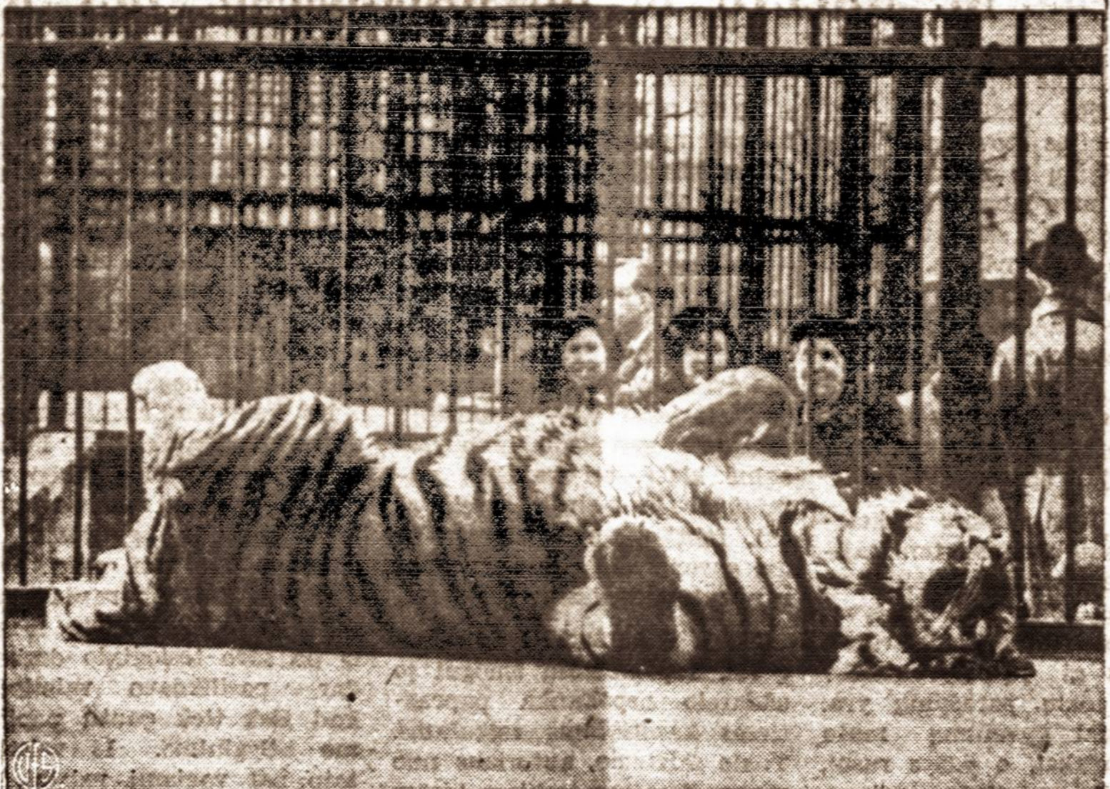
Bengalijos tigras, kartais būna jaukus, kaip kačiukas.

Jau dabar kas savaitę 1700-1800 anglių išvyksta į Australiją.