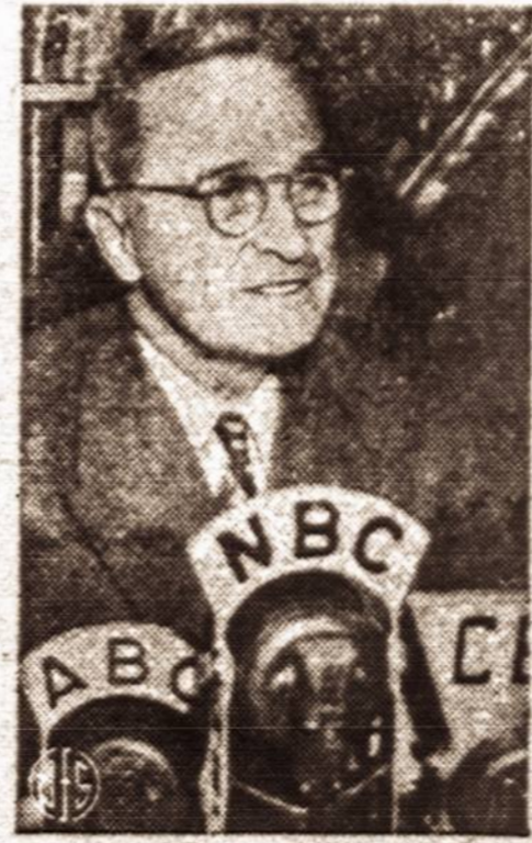
Prez. H. Trumanas

Prezidentas Trumanas pranešė spaudai, kad nuo bal. 11 d. generolas MacArthur atšaukiamas iš karo vado pareigų Tolumuose Rytuose. Atšaukimo priežastis: generolo skirtingos pažiūros į karvedybą Korėjoje.