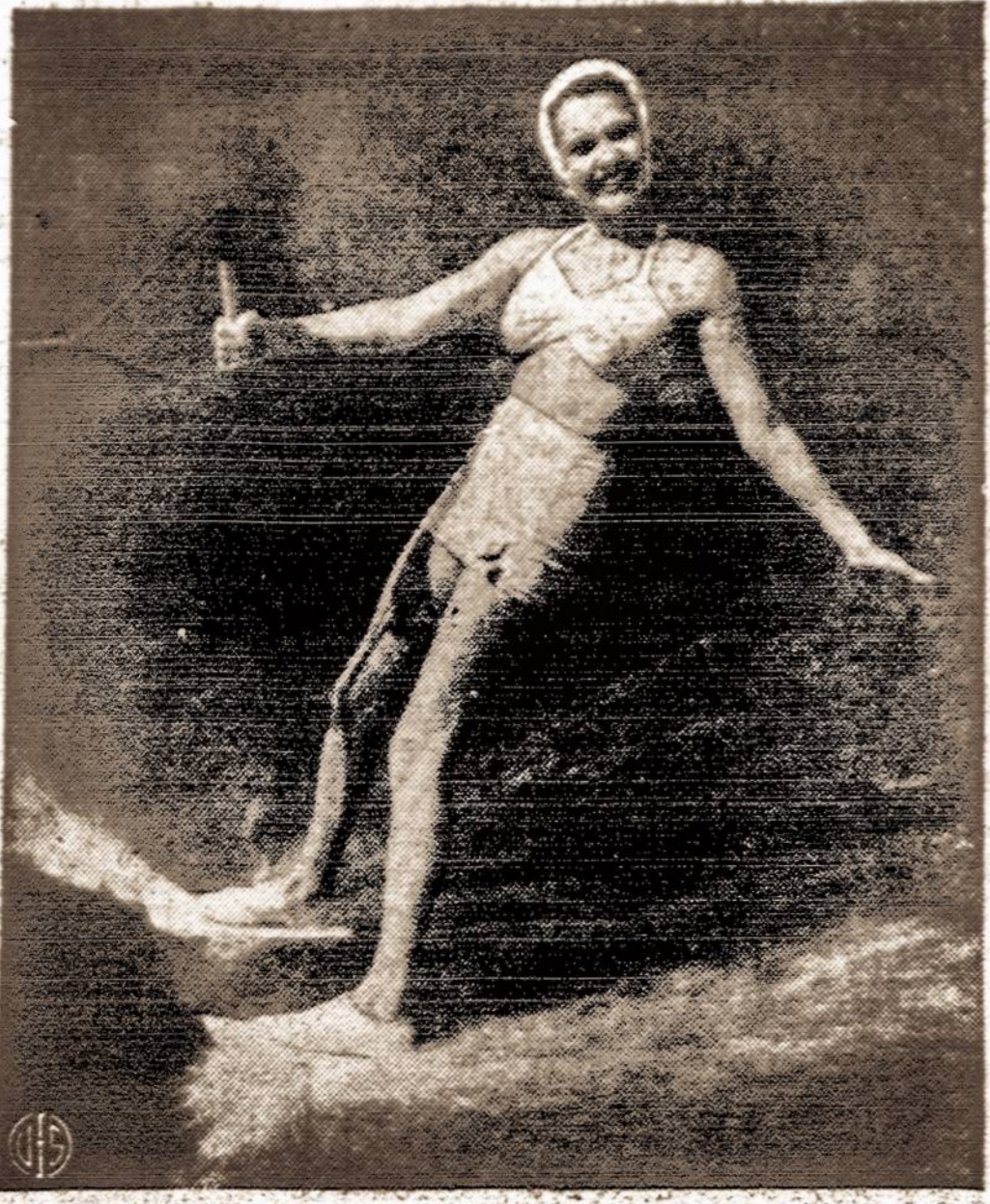
Kino žvaigždė poilsio metu