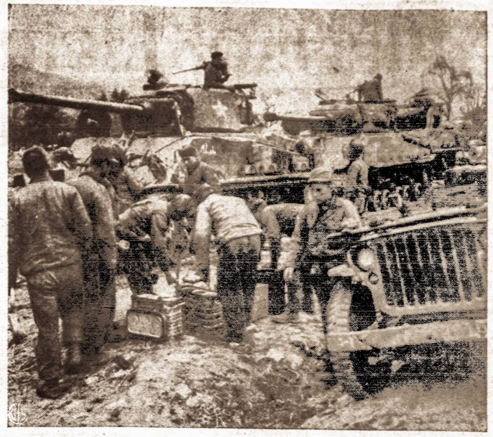
Amerikos tankistai ruošiasi pasitikti komunistų ofenzyvą. Sustoję trumpam poilsui ir pasitarimui, Amerikos tankis tai laiko išstatę sargybas, kad nebūtų staiga prieš užplūti.

PAKISTANAS SEKA IRANĄ IR IRAKĄ Pranešimu iš Karachi kai kurių naftos bendrovių darbininkai savo mitinguose padarė nutarimus reikalauti iš vyriausybės, kad Pakistano naftos šaltiniai būtų suvalstybinti, kaip tai jau padarė Iranas ir kaip ruošiasi padaryti Irakas. Priimtoje rezoliucijoje yra pasakyta, kad Pakistanas turi tas pačias teises, kaip ir čia suminėtos valstybės, ir kad nafta turi būti valstybės nuosavybė, bet ne svetimų kapitalistų, vis tiek ar tai būtų angliai ar amerikiečiai. LĖKTUVŲ NUOSTOLIAI Generolo G. E. Stratemeyer pranešimu Amerikos oro pajėgų nuostoliai Korėjos kare yra tokie: iš viso amerikiečiai neteko 184 lėktuvų. Bet tiesioginėje kovoje esą numušta tik vienuolika lėktuvų. Kiti visi nuostoliai, tai tik pasekmė lėktuvų sužalojimo, kada juos jau nevertėjo remontuoti, arba lėktuvų nelaimingi atstikimai. Daugiausia amerikiečiai neteko naikintuvų (net 143). Tuo pat metu priešininko oro pajėgų nuostoliai yra tokie: bendras iš rikiuotės išvestų lėktuvų skaičius siekia 341. Nuo Korėjos karo pradžios amerikiečių oro pajėgos padarė 171,000 kovos žygių.