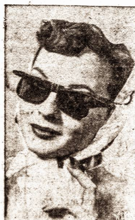
akiniai nuo saulės su dangteliais