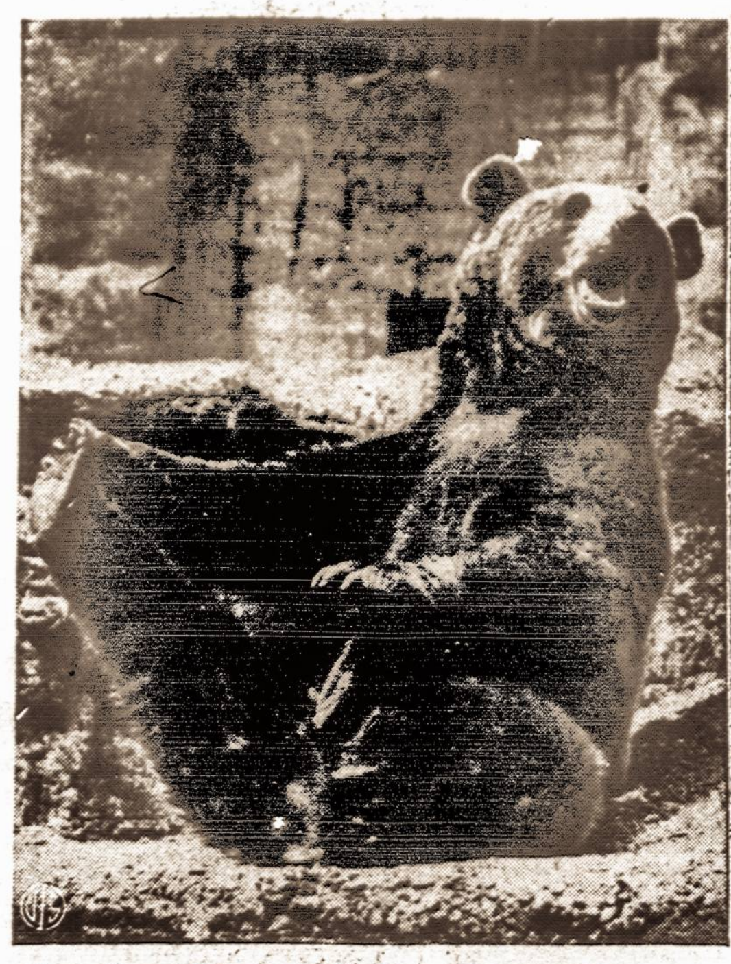
Simpatinga Bronxo zoologijos sodo gyventoja

Tokia pat duonos krautuvė, skiriama Long Island farmeriams, jau yra atidaryta Middle Island, L. I., netoli Jericho kelio. Šioje krautuvėje Silver Bell Baking Corp. savo produktus parduoda šeštadieniais. Todėl ir lietuviai, kurie gyvena toje apylinkėje, 8 psl. 1951 m. liepos 13 d.