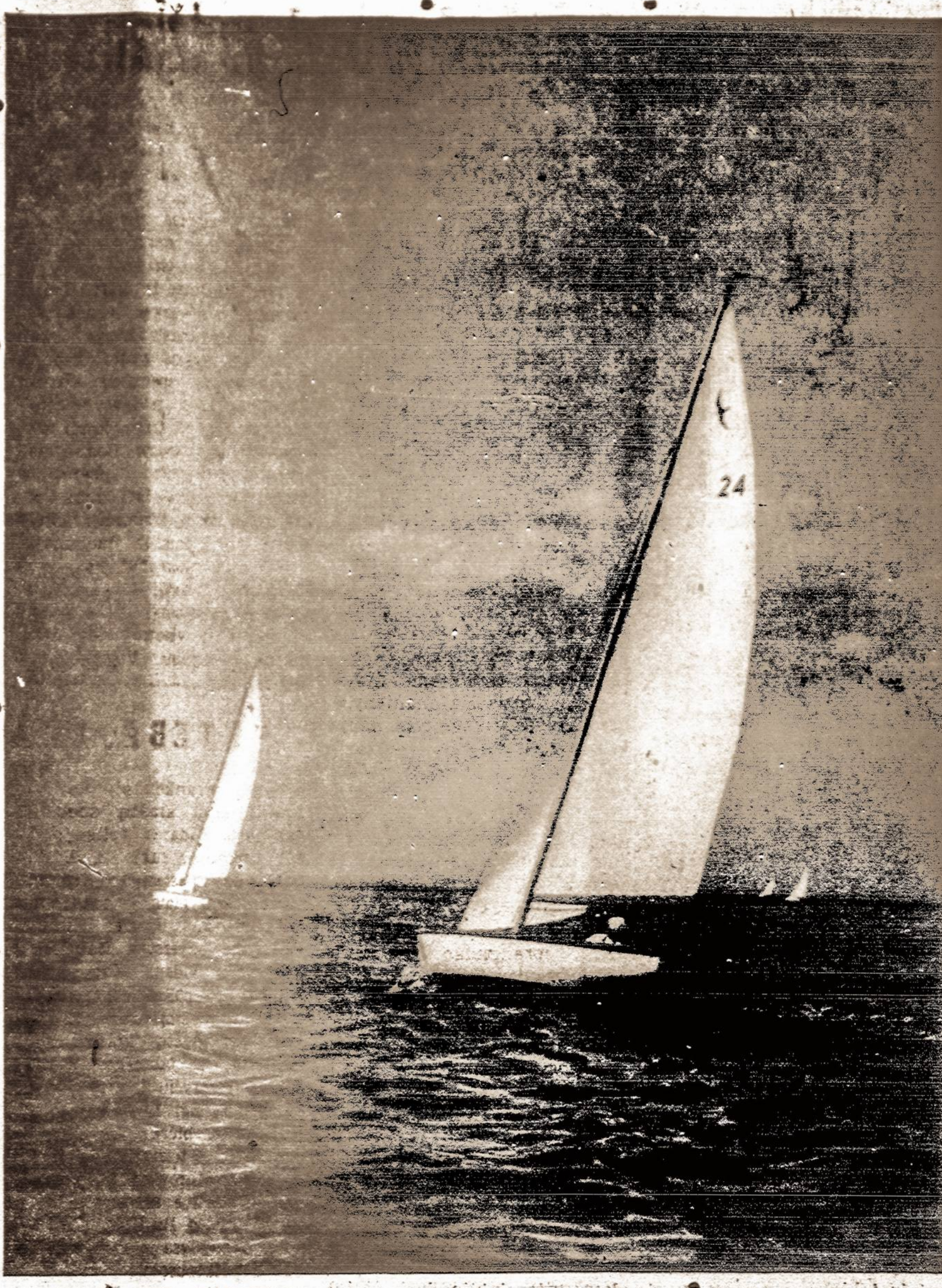
BALTIJOS Jūra LIEPOS MĖNESI

Pavirsti. Kad, nedūžtum, tau debesį minkštą Gloja geras gegužis. Geitona žvaigždė Gvazdikais ir pasakom kvepia ir miršta. Jau inkaras kyla. Neverk, sudiev.