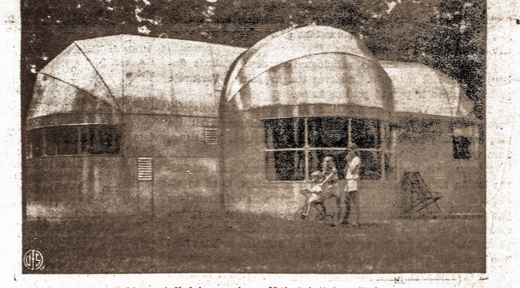
Tokie metaliniai namai pradėti statyti Amerikoje.