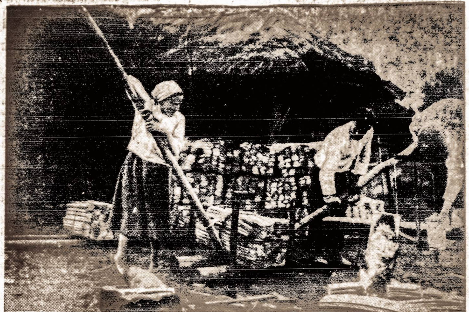
RUDENS DARBAI LIETUVOJE