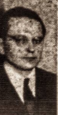
Jau kelinti metai pastoviai skaitau TIME magazina...