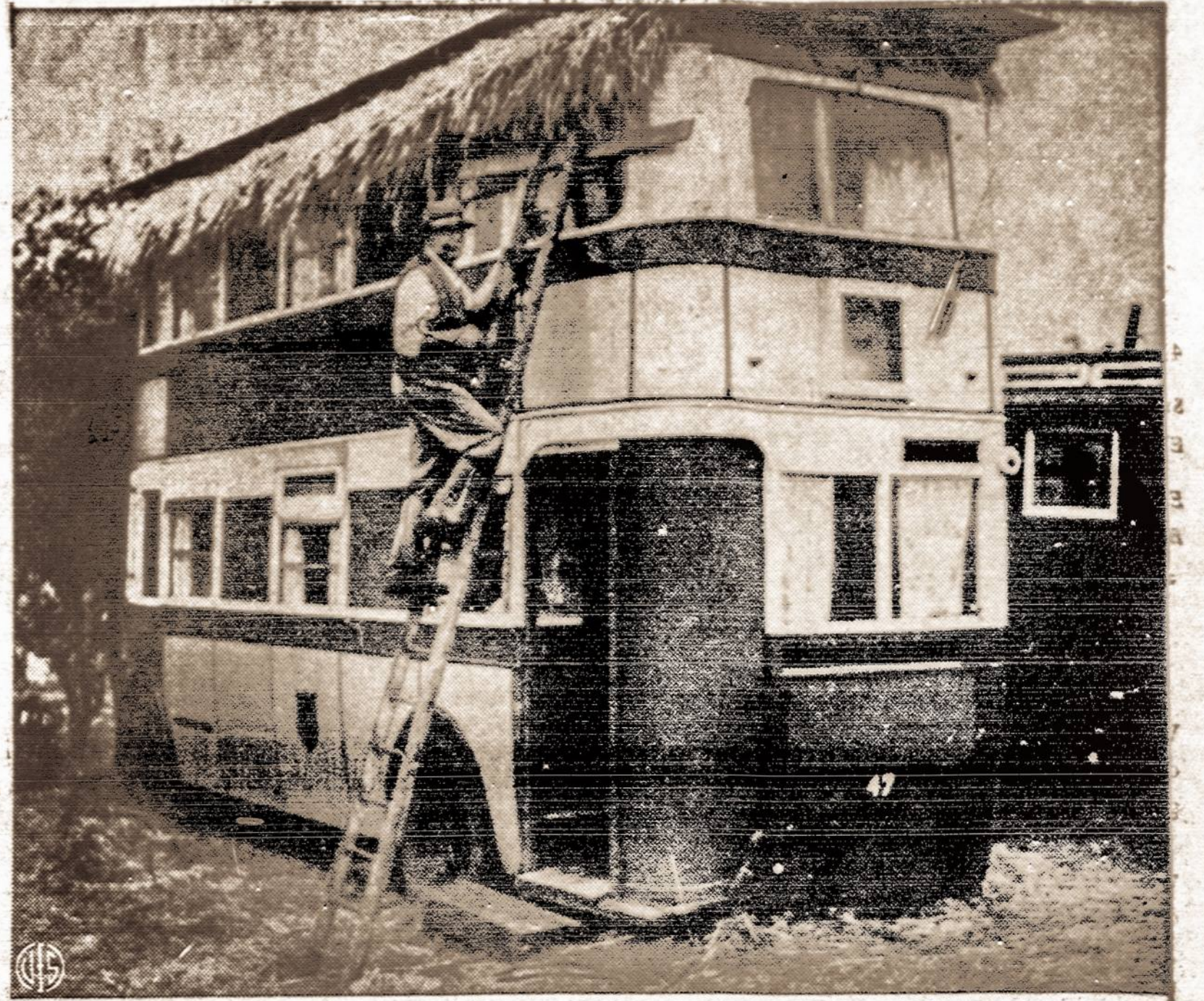
Vienas anglas, nusipirkęs seną miesto autobusą, šitokiu būdu išsprendė buto krizę.

Tarp įžanginių delegatų kalbų protarpiais buvo svarstoma darbų tvarka. Po ilgų diskusijų, per kurias sovietai ir vėl turėjo progos pasiklioti, buvo priimti 88 punktai.