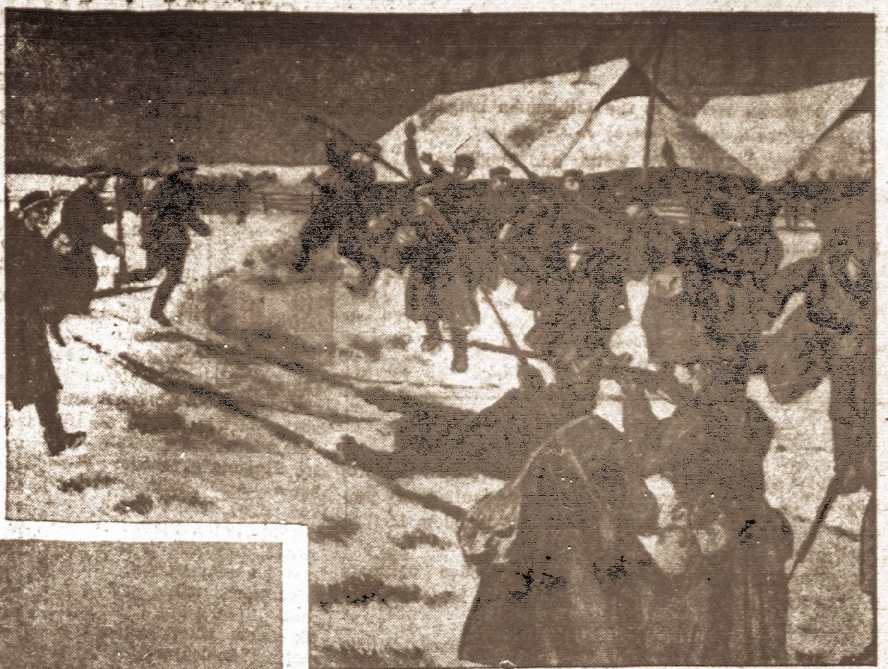
Pirmaisiais Lietuvos kūrimosi metais mūsų kariai - savanoriai kovojo prieš skaitlingus priešus: bolševikus, bermontininkus ir lenkus.

ginklu padėtį jai išsikovoti Nepriklausomybę. Jie tapo išformuoti ten, kur buvo sukurti. Komunistai, chaoso viešpatai, negalvojo apie tautų laisvę. Jie kalė joms dar stipresnius vergijos pančius už tuos, kuriuos caro valdžia joms turėjo uždėjusi. Už tai, kad lietuvių Vytauto Didžiojo Batalijonas (stovėję Sibire) mylėjo savo tėvynę,