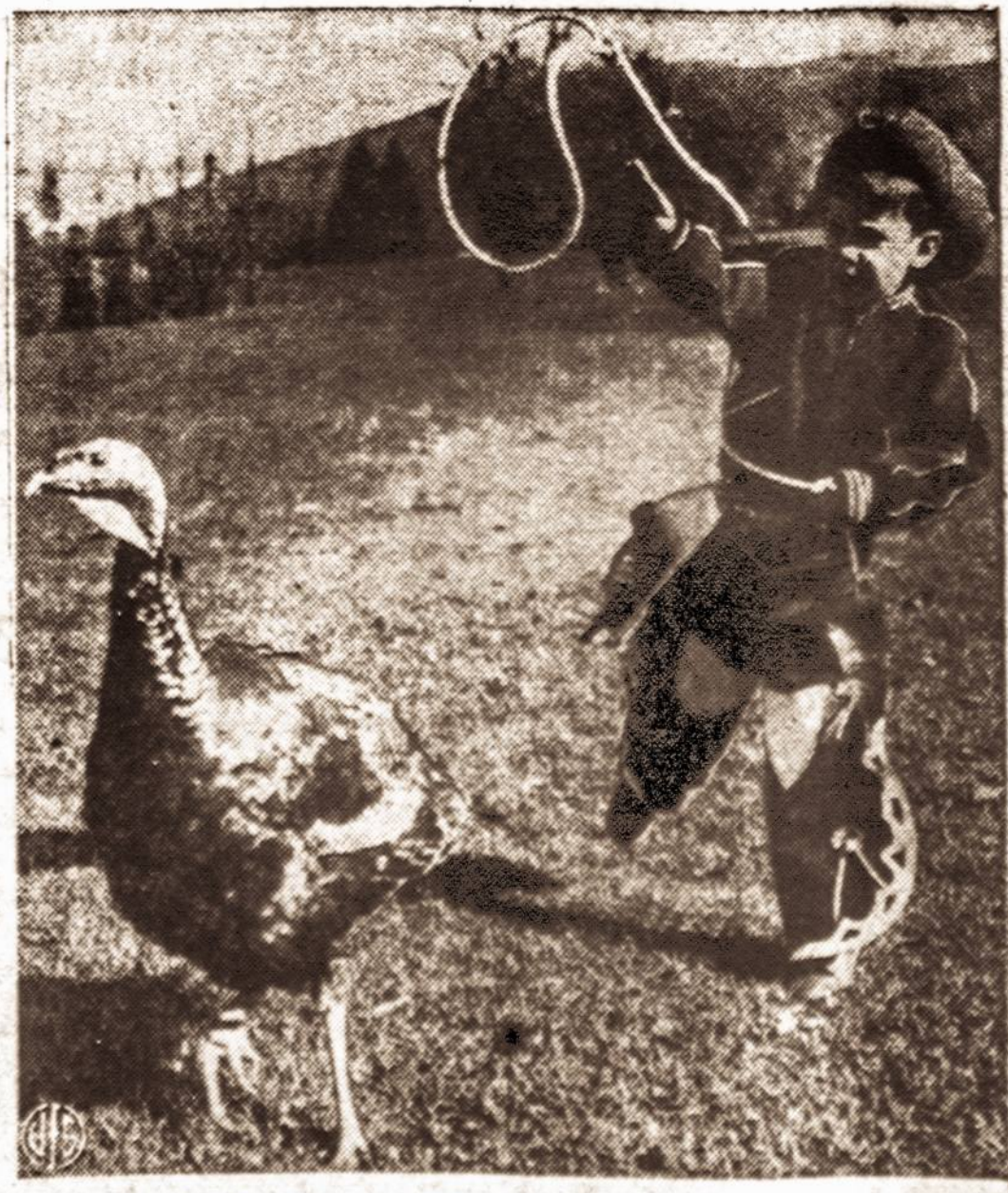
Be kalakutienos nėš Padėkos Dienos...