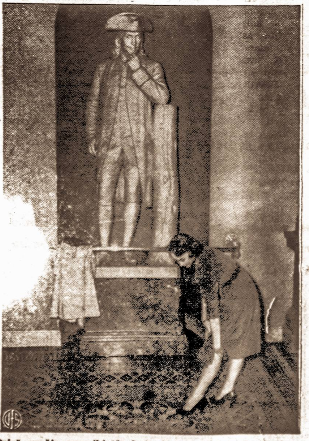
Prieš gražią amerikietiškojo ir marmurinis Benjaminas Franklino nesulaiko nežvilgtelėjęs.

Suprantama, kodėl tuoj po karo, suirutės, netvarkos ir baimės perspektyvoje, vieningos vienos Europos idėja sustiprėjo.