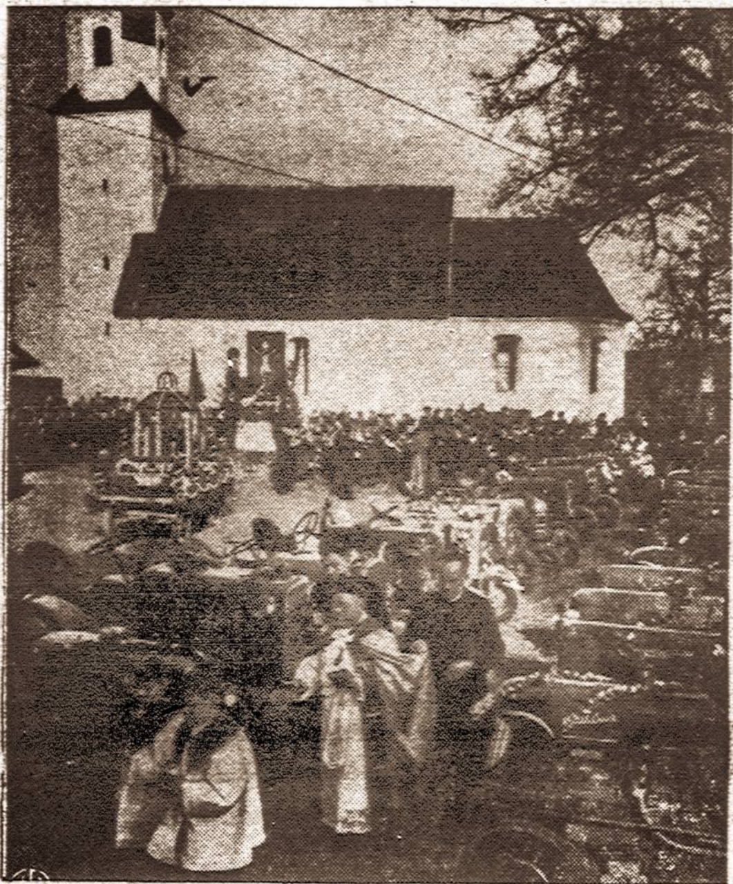
Sventinami traktoriai, kurie Bavarijoje, kaip ir čia Amerikoje baigia pakeisti arklius.

● Vietnam (viena iš Indokinijos valstybių) kuri kovoja prieš komunistus, kreipėsi į JT prašydamą priimti nariu.