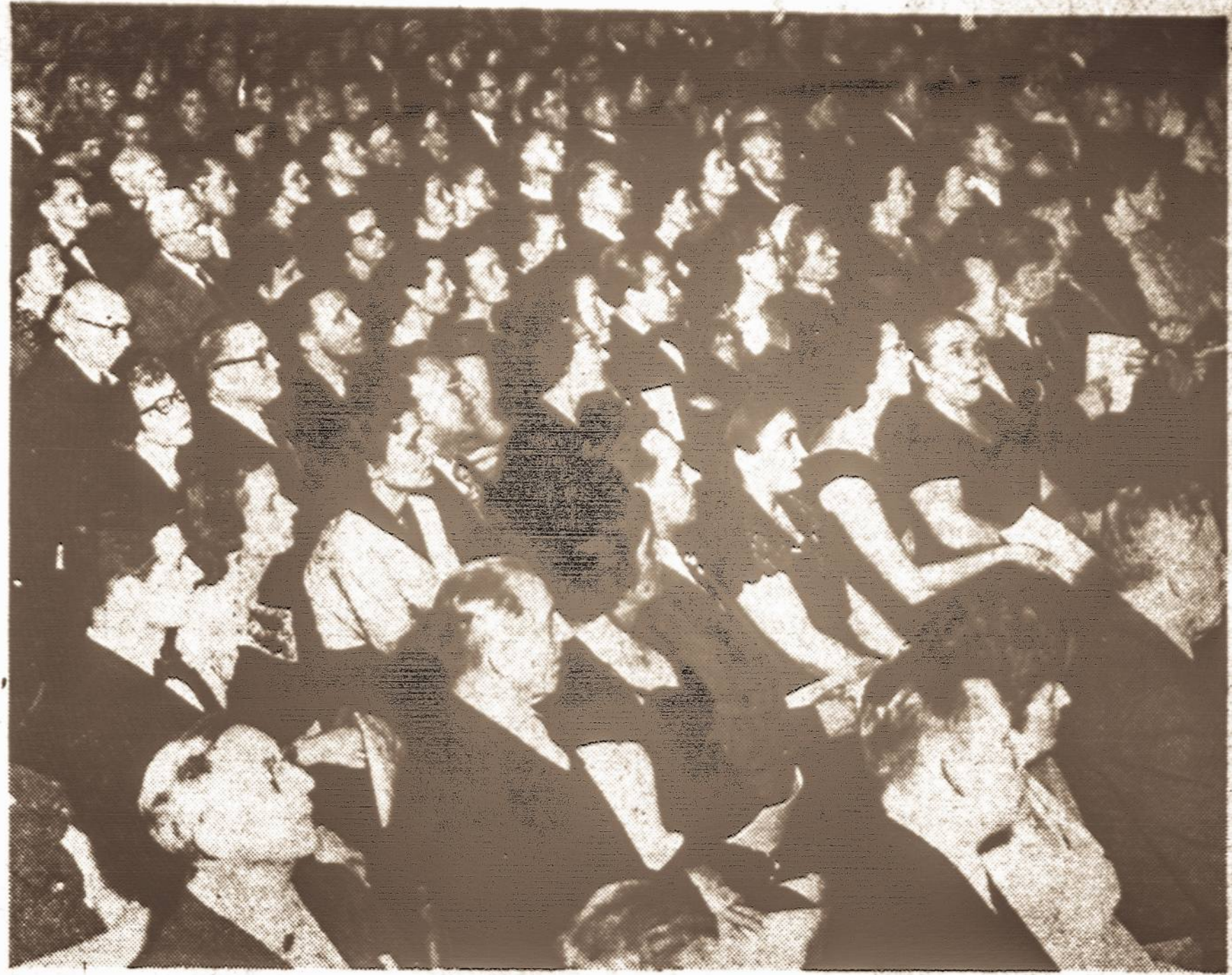
Su tokiu susikauptumu ir dėmesiu tūkstantinė publika klausėsi Vėniybės koncerto, įvykusio praeitą sekmadienį Webster salėje New Yorke.

Is tikrųjų, anot Olio, "atrodo, kad senieji lietuviai nuėjo į pogrindį".