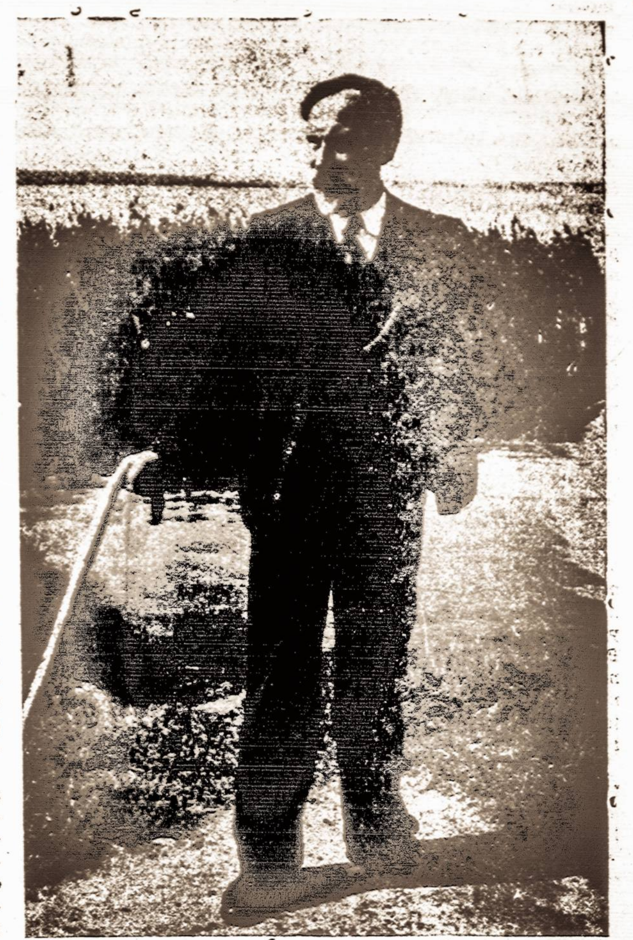
Velionis Antanas Smetona

Daugelis žmonių, deja, yra linkę nuopelnyti ir darbu pastebėti, o šiaip žmogiskus apsiireikimus išfirtėri per mikro-skopą ir padidinti.