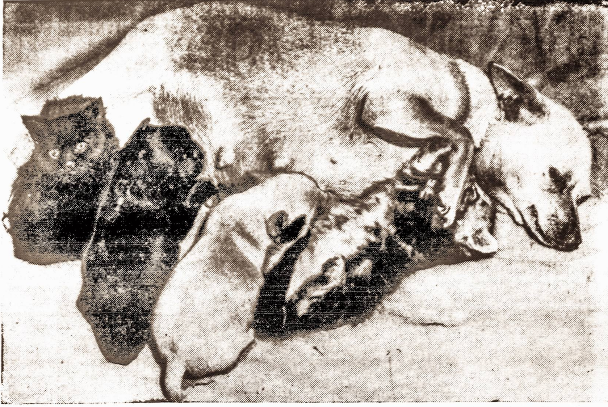
Motinos mellei yra lygūs visi: sūnūs ir posūniai..