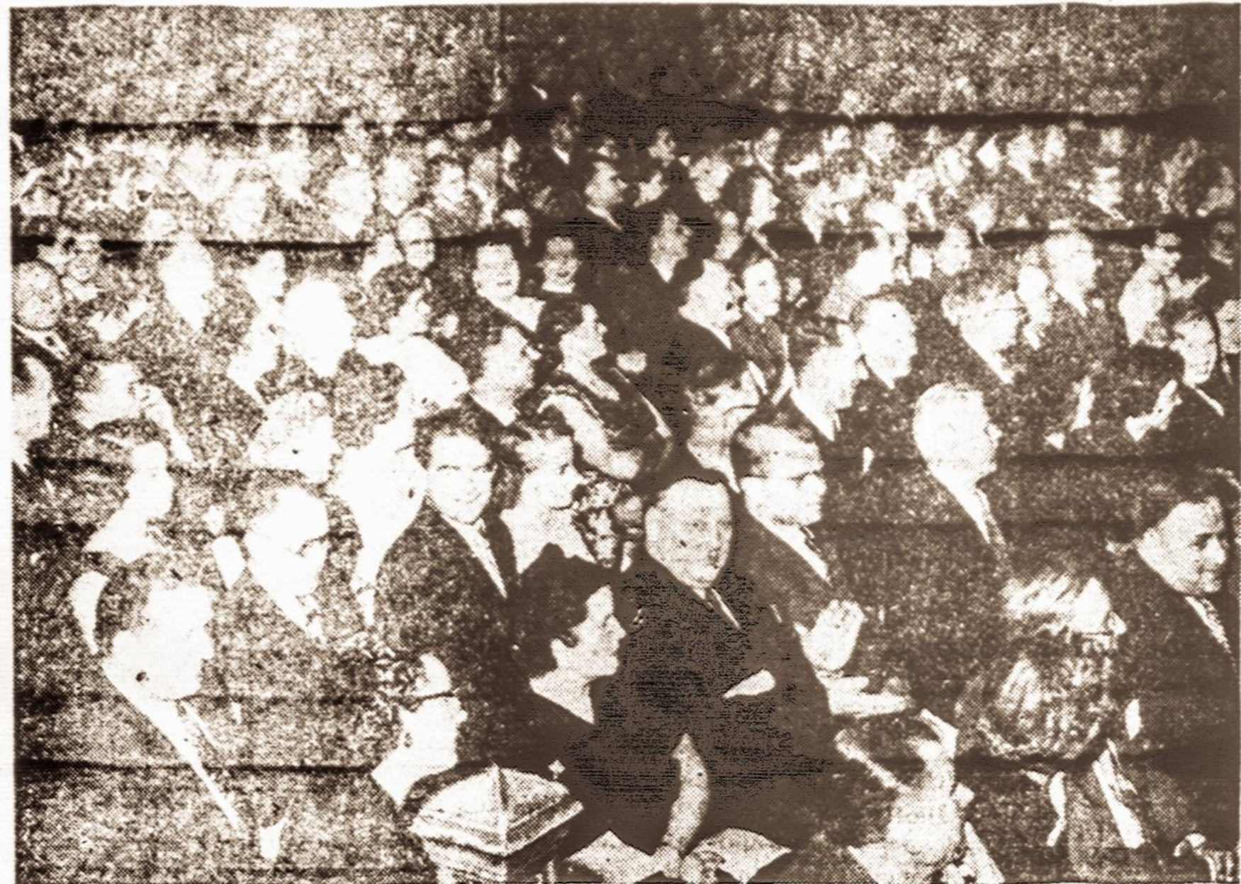
Vieno buvusio Vienybės koncerto metu...

SEKM., SAUSIO 31 d., 1954 m., 4 val. p. p. WEBSTER HALL, NEW YORKE Programoje: