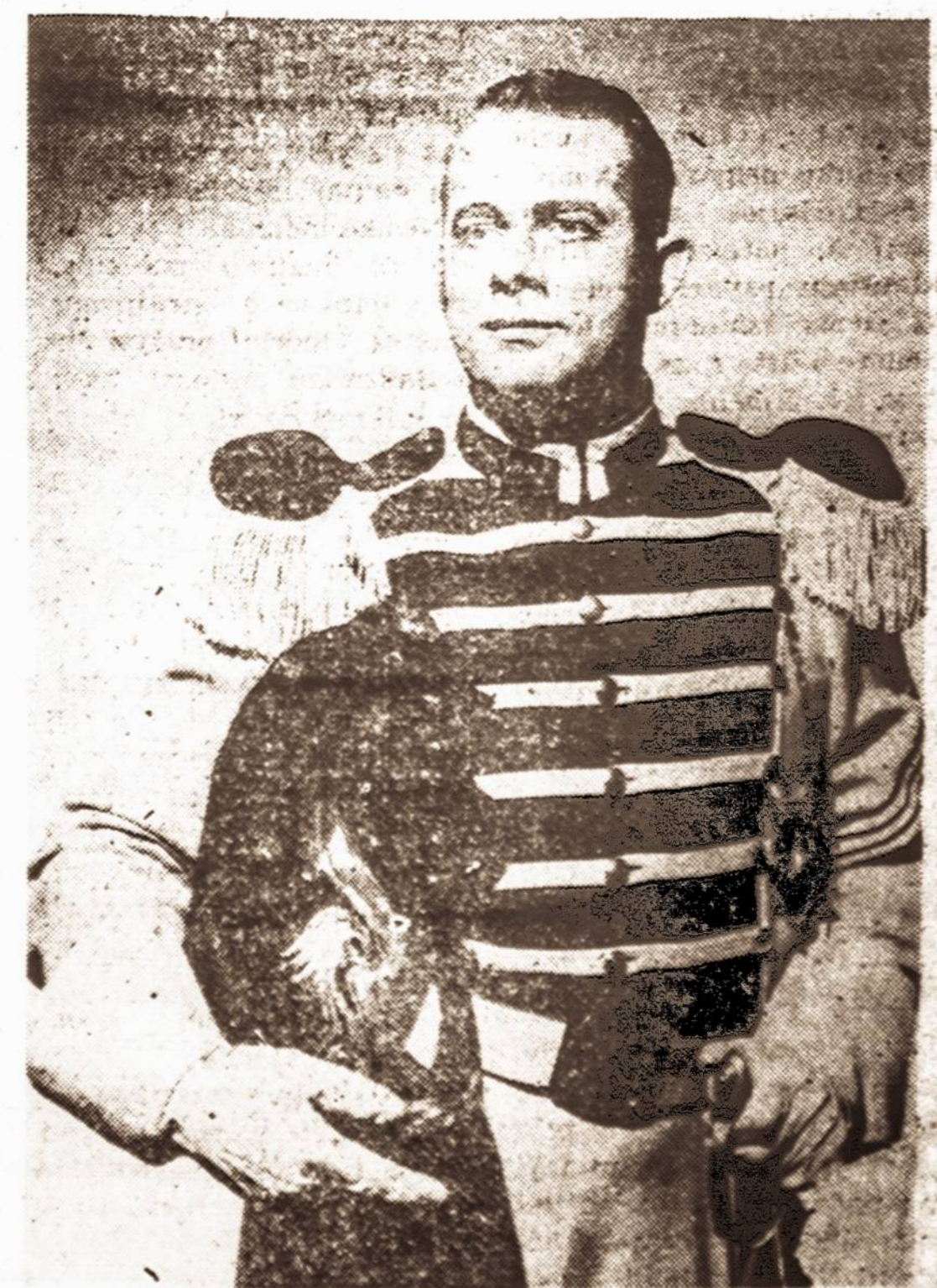
METROPOLITAN OPEROS BARITONAS ALGIRDAS BRAZIS