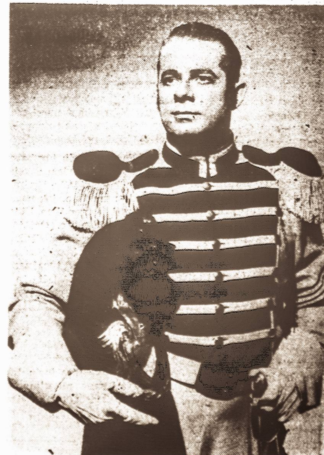
METROPOLITAN OPEROS BARITONAS ALGIRDAS BRAZIS