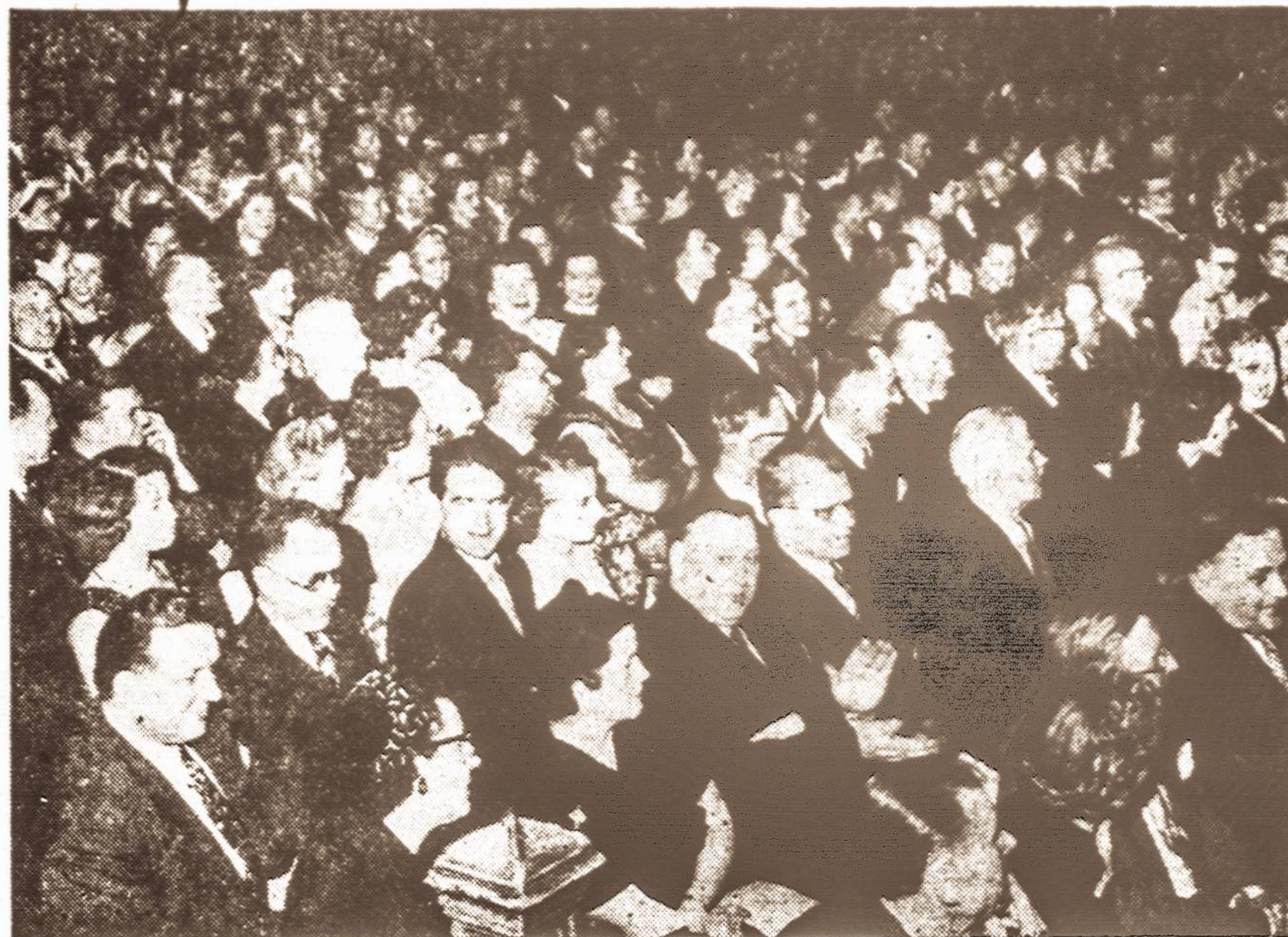
Vieno buvusio Vienybės koncerto metu...

SEKM., SAUSIO 31 d., 1954 m., 4 val. p. p. WEBSTER HALL, NEW YORKE Programoje: