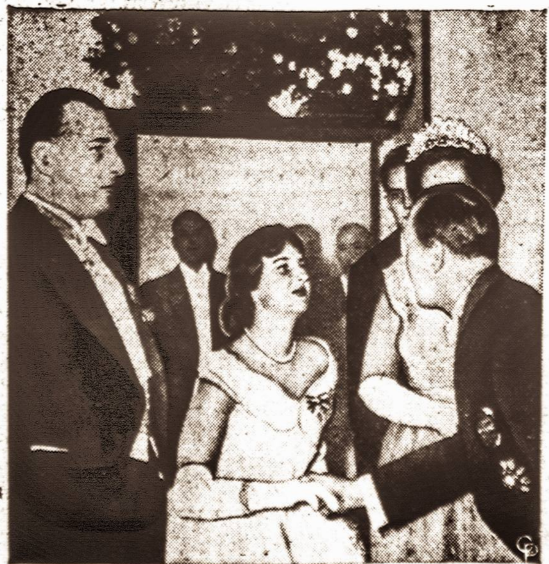
Pretenduoto į Ispanijos sostą Don Juan dukters, princesės Marijos, debuto proga tėvai surusė balių, kuriame dalyvavo daugiau kaip 2,000 svečių. Tai įvyko Estoril, Portugalijoje.

Naujojo Konsulato pripažinimas laikantis tarptautiniais įpročiais nustatytų taisyklių, prisideda prie Lietuvos Diplomatines Tarnybos padėties sustiprinimo formaliu atžvilgiu ir neabejotinai patarngus Lietuvos piliečių interesams, kurie naudojasi Kolumbijos sveitimumu.