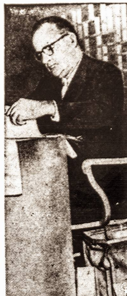
Senatorius Joseph R. McCarty, kurio daug ginčų sukėlusią bylą turės išspręsti Senatas.