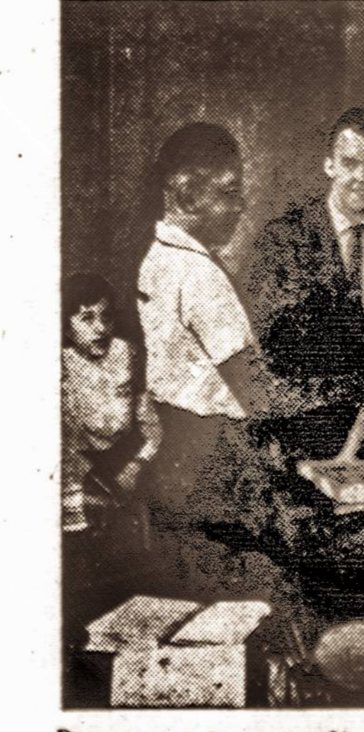
Balsuotores mokykloje protestuoja prieš rasiinę neigybę, pasireiškiančią New Rochelle (N. Y.) mokyklose.