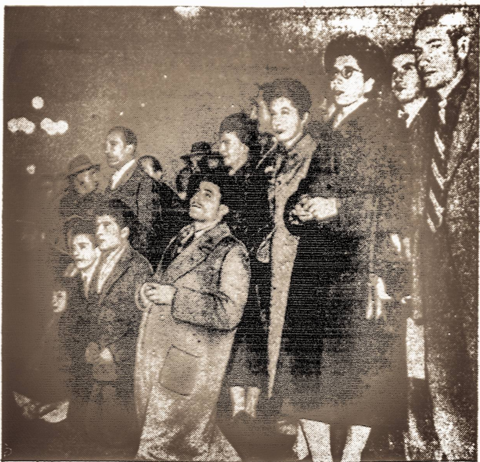
Lietuvių minia Romoje meldžiasi už popiežiaus Pijaus XII sveikatą.

Šio rašinio autoriui teko pa-vydėtina laimė bendradarbiau-ti su Būga Lietuvos Universi-tete nuo 1922 metų rudens iki jo mirties. Jis man buvo ne tiktai bendradarbis, bet ir mo-kytojas ir draugas. Is jo išmo-kauo daugiau, negu is kurio sa-vo mokytojo. Jį gerbiau ir my-lijau, ir jo mirtis nukreipė mano gyvenimą visai kitokion kryptin, negu kad aš laukiau. Jis mirė jaunas, pačiame žy-dėjime. Jo pasirengimas prie mokslinės karjeros buvo bega-lo sunkus ir traukėsi daug il-giau, negu normaliai. O vis-o dėlto jis atliko milžinišką dar-bą. Tesie jis mums paveiksl!