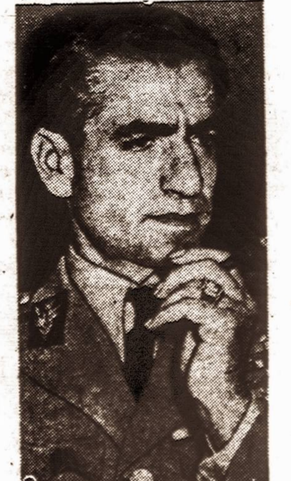
Irano šachas Mohammed Riza Pahlevi atvyko dviejų mėnesių vizitui į Jungtines Valstybes, kurio metu, sakoma, jis Washingtone tarsis ir Vidurinių Rytų reikalais.