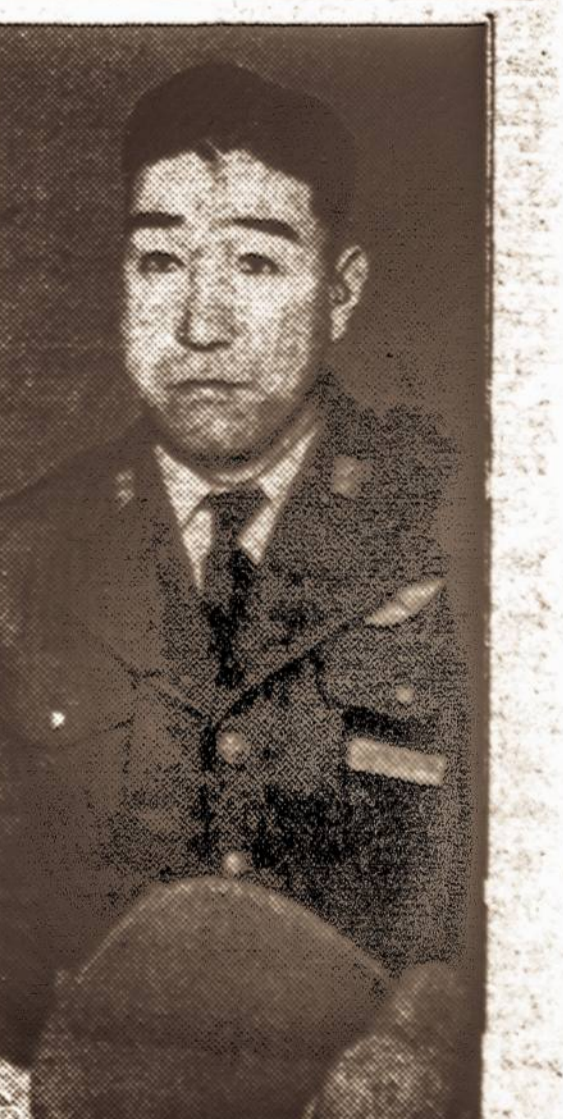
Lt. pulk. Sigenasa kamanofo, vairavęs bombonešį Pearl Harbor užpuolimo metu, dabar vairuoja amerikiečių gamybos sprausminį lėktuvą Japonijoje. Jis yra vienas iš 13 gabiausių japonų lakūnų, kurie, amerikiečių padėdami, dabar organizuoja naują Japonijos oro laivyną.