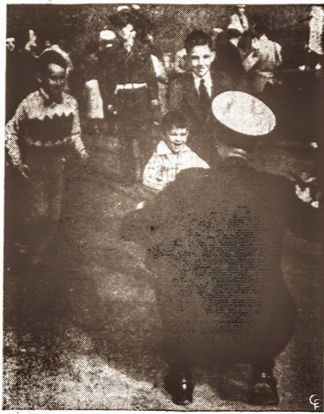
Valkai pasitinka tėvą, grįžusį iš užjūrių.