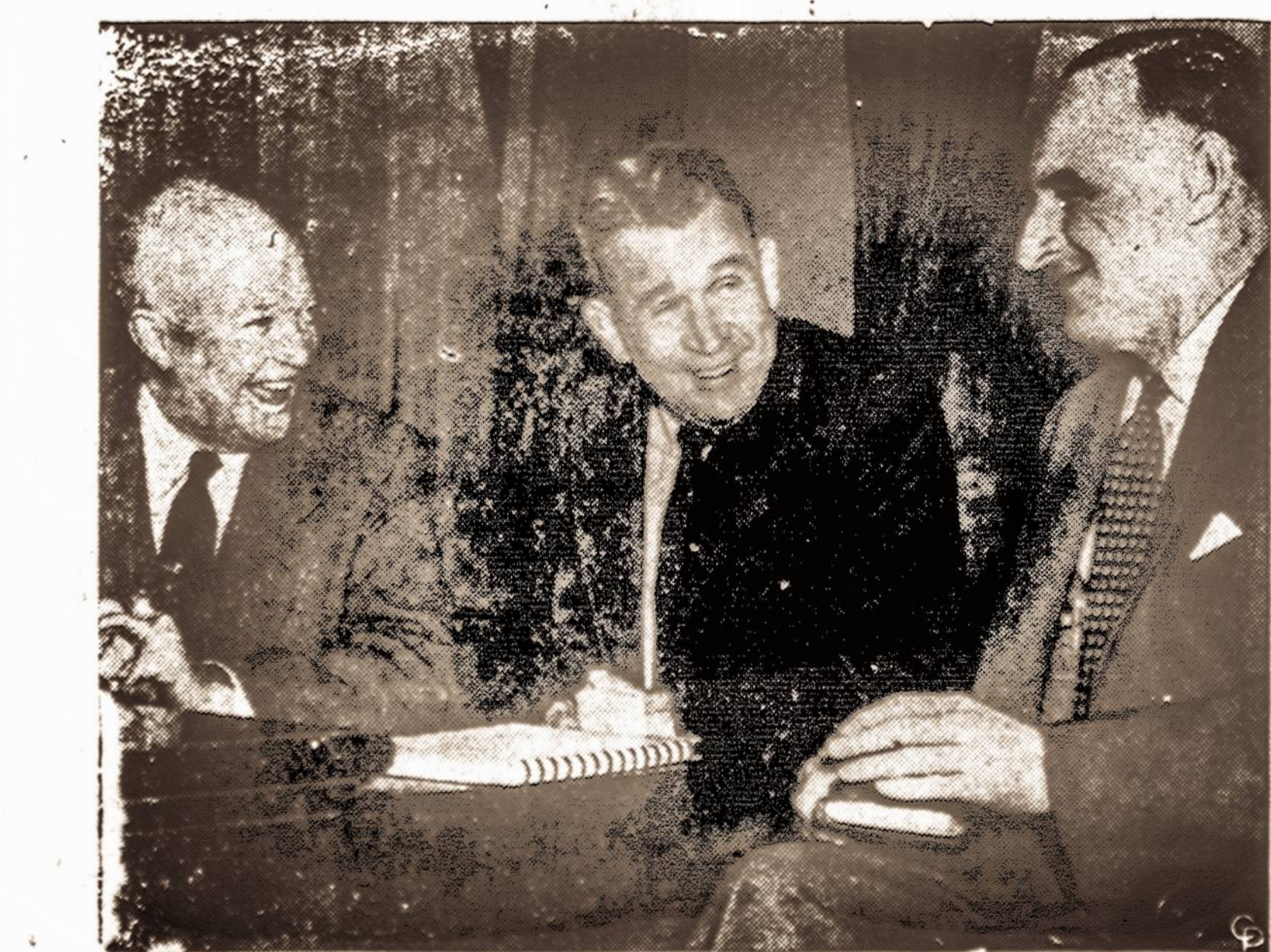
Prezidentas Eisenhoweris, Louisianos gubernatorius Robert F. Kennon ir gen. Lucius Clay Baltuosiose Rūmose Washingtono. Čia buvo galutinai aptarta gubernatorių konferencijos pasiūlymas federalinei valdžiai skirti 25 milijonus dolerių Amerikos viešųjų statybos programai vykdyti.