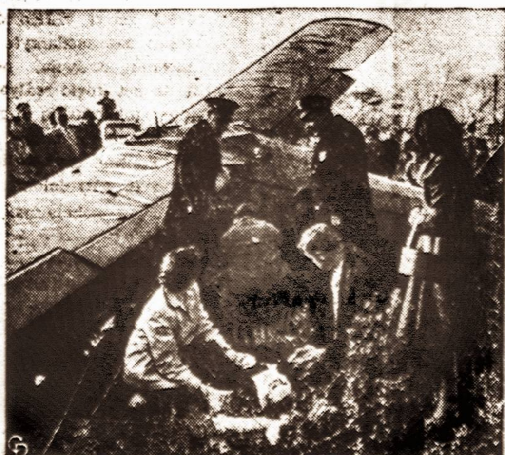
Kai lėktuvas priverstas nusileisti...