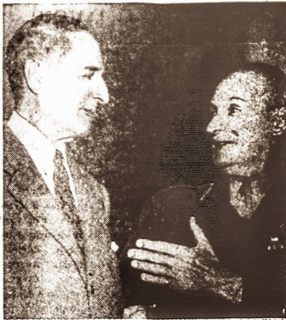
Gen. MacArthur (kairėje) ir maršalas Montgomery, du žymūs vadai antrajame pasauliniame kare, pirmą kartą susitinka New Yorke.

Jo gyvenimas buvo sunkus. Motinai mirus, jis su tėvu vargavo, kaip ir visi pionierai ir tegavo paprastą pagrindinį aukrą. (Nukelta į 6 psl.)