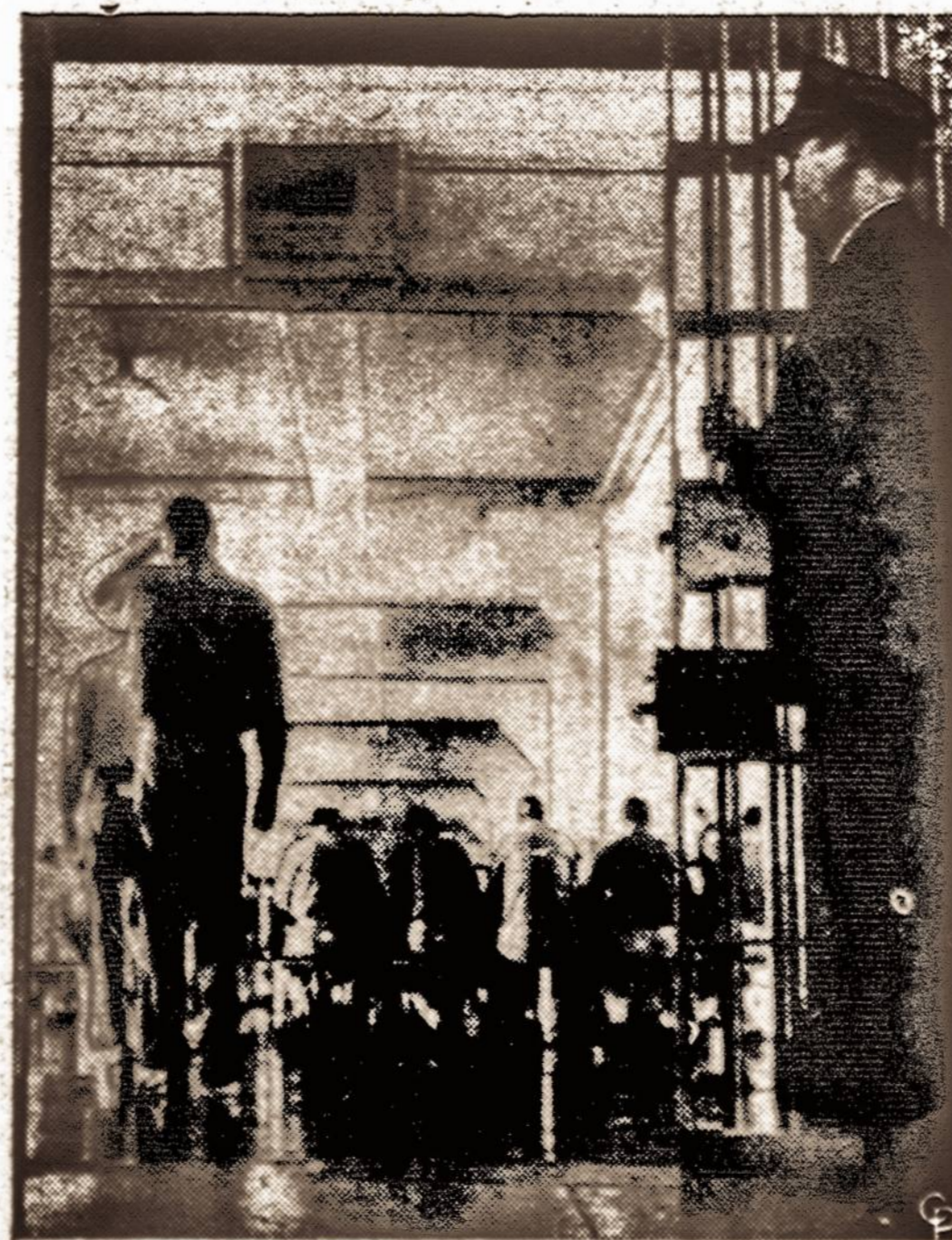
Garsojo Alcatraz salos kalėjimo įnamiai turi kavinės tipo restoraną, kur pirmoje vietoje pastebima tvarka ir švara. Kalėjimas yra 12 akrų saloje, netoli San Francisco, California.