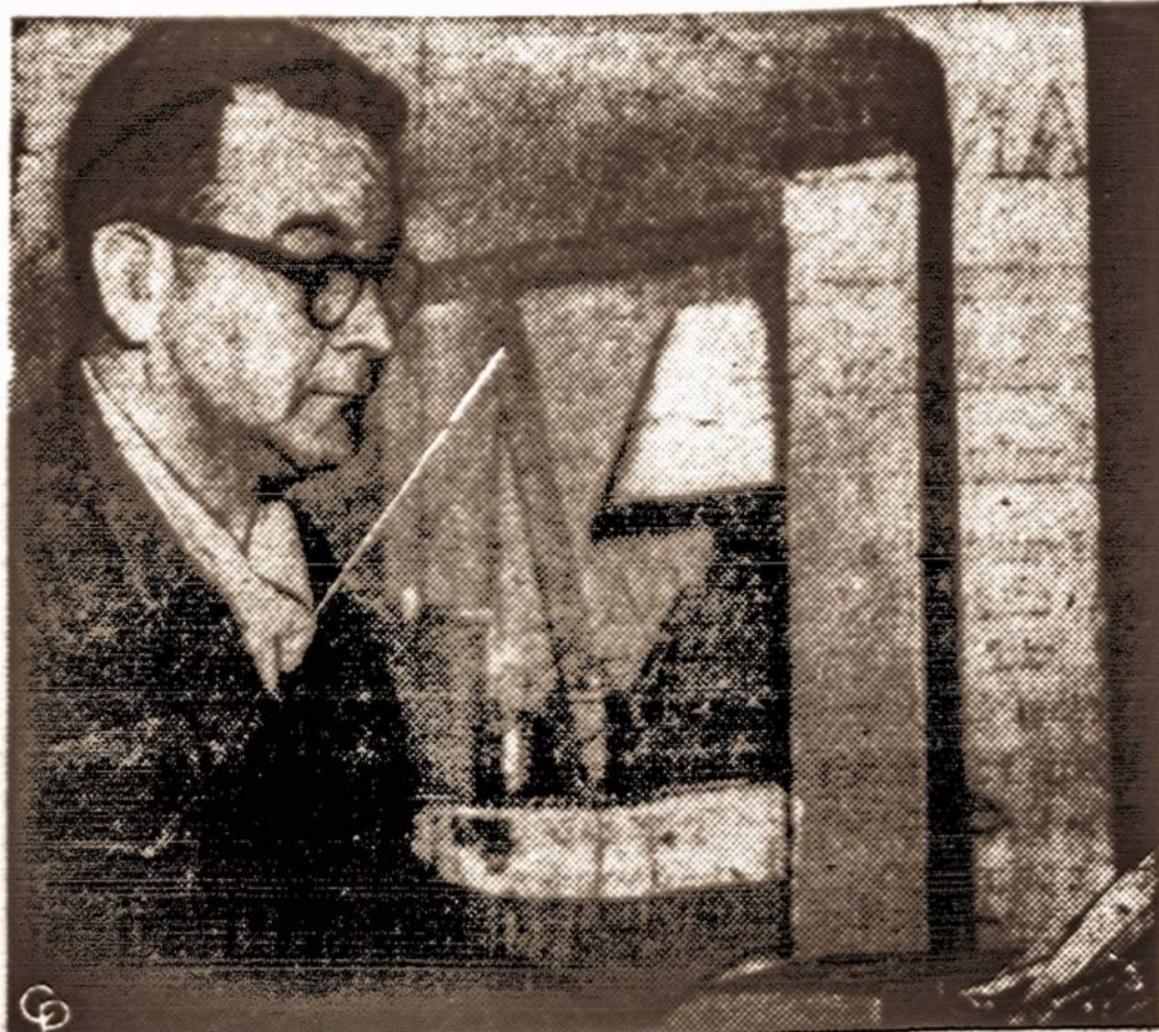
Jacques Mornard, už Leo Trockio nužudymą atkaltėjęs 14 metų (iš 20) gali būti paleistas, jei prašysis. Mornard (sakoma, esąs belgas) užsidirbo pinigų gamindamas televizijos aparatus Meksikos kalėjime.

Paprasto nugaros paralyžiaus pirmosios stadijos metu, gydytojas, greičiausiai, prirašys išsėtis ant kieto matracio