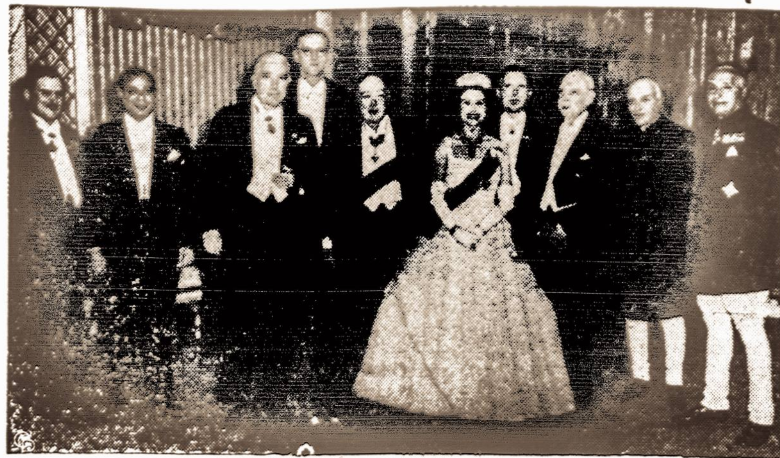
Praeitą savaitę Londone įvyko Britų Valstybių Bendruomenės (British Commonwealth of Nations) premjerų konferencija, po kurios Buckingham rūmuose karalienė Elzbieta II aukštuoju svečius pasikvietė priėmimui. Iš kairės į dešinę: Sir Godfrey Huggins — Centrinės Afrikos Federacija, Mohammed Ali — Pakistanas, Robert G. Menzies — Australija, Pietų Afrikos teisingumo ministeris Charles R. Swart, Sir Winston Churchill, Sidney G. Holland — Naujoji Zelandija, Louis St. Laurent — Kanada, Jawaharlal Nehru — Indija ir Sir John Kotelawala — Ceylonas.

Kongresmenas Ray Madden, iš Indiana valstybės pradėjęs Atstovų Rūmų skirti vieną valandą laiko Nepriklausomai Lietuvai pagerbti.