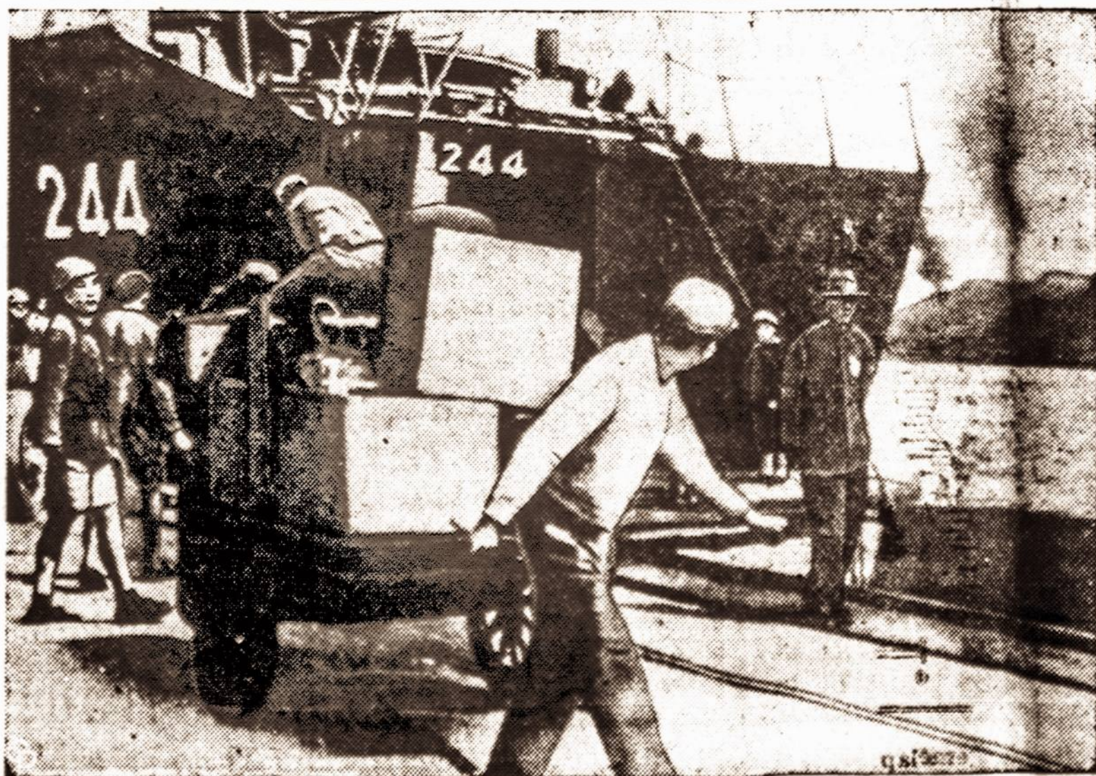
Taip atrodo Tacheno salų įgulos ir gyventojų kraustymas.

Kai kurių mėnulio kraterių, matomų per teleskopus, skers- muo didesnis kaip 100 mylių.