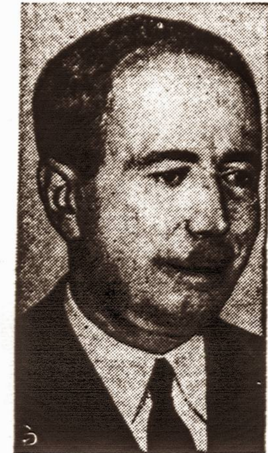
Antoine Pinay, buvęs Prancūzijos premjeras, kuriam, atrodo, teks perimti atsistatydinuso Mendes-Prance pareigas.

Panašaus turinio telegramą Generalinė Komisija pasiuntė ir Jungtinių Valstybių delegacijų pirmininkui Jungtinėse Tautose.