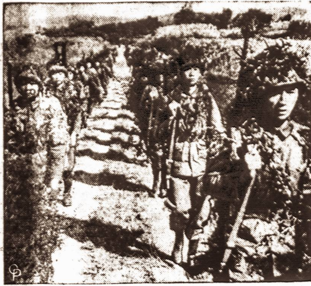
Būdingas vaizdas iš Formozos salos.