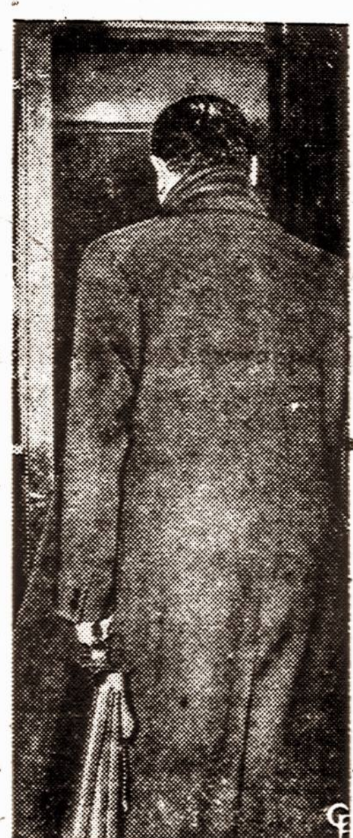
Buvęs Prancūzijos premjeras Mendes-France apleidžia kabinetą.

Minint Lietuvos valstybės atkūrimo 37-ją, perduodu Jums, sesės ir broliai Tėvynėje, Lietuvos Laisvės Komiteto sveikinimus ir išlaisvinimo viltį.