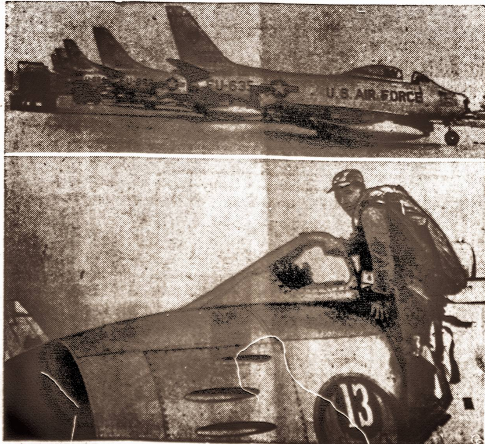
Amerikos karų lėktuvasi Formozoje pasruošę netikėtumams