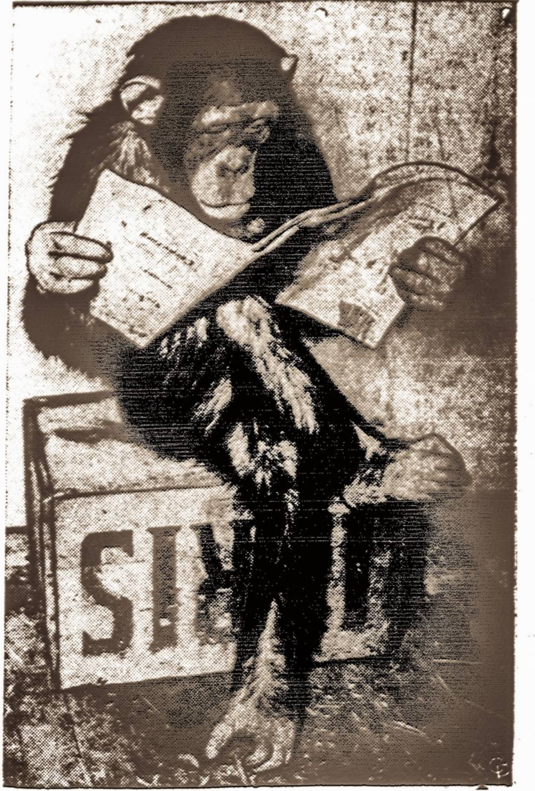
Kas sakė, kad beždžionės neskaityt laikraščių...

ISNUOMOJAMA gražus butas, du kambariai su virtuve ir vienas kambarys be virtuvės. Kreiptis vakarais tarp 8 ir 9 val. šiuo telefonu: ST 2-1454.