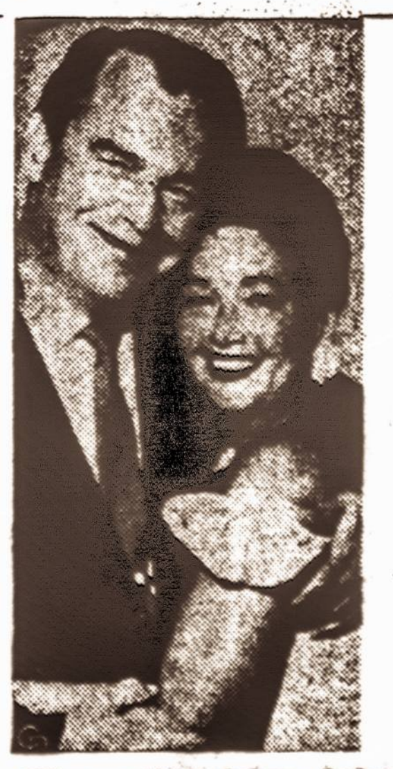
Filmų artistė Ariene Judge su savo septintuoju vyru, už kurio ji ištekėjo šiomis dienomis.