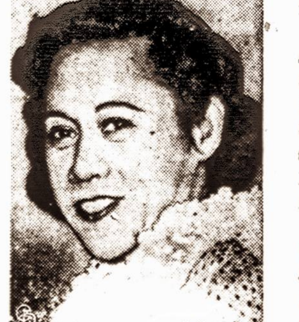
Dvi pagraisėjusios artistės, Marion Marlowe ir "Haleloke", kurias Arthur Godfrey šiomis dienomis atleido. Abi jau gavo naujus darbus.