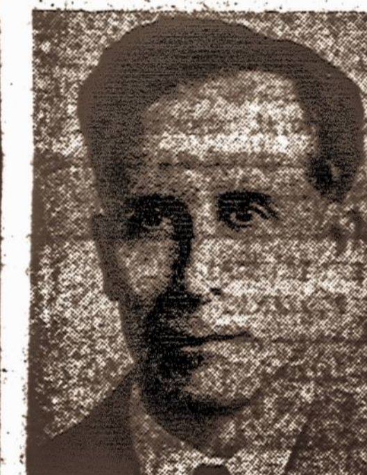
Brangus Dr. Miller:

Per šešis mėnesius kankinausi vidurių negalavimais. Aplamai, mano sveikata buvo menkeska ir delto buvau nustojęs 10 svarų svorio. Atvirai kalbant, mano sveikata buvo gerokai pašlijusi, tačiau nenustojau vilties, bet nežiūrint to, turėjau pasitraukti iš savo darbo. Nors mane tuomet gydė net trys gydytojai, pasveikti negalėjau.