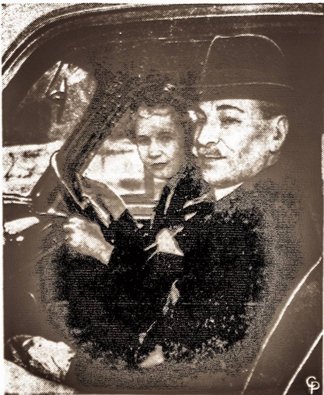
Clement Atlee, Anglijos darbiečių vadas, rinkimų metu su žmona važinėjo po kraštą, jįsėdomas balsų.

Visi JAV kariai Austrijoje gavo išpėjimą, kad tie, kurie rengiasi vesti austruas, tai atliktų iki birželio 15 d., nes tuo metu Amerikos kariuomenė bus ištraukta iš Austrijos teritorijos.