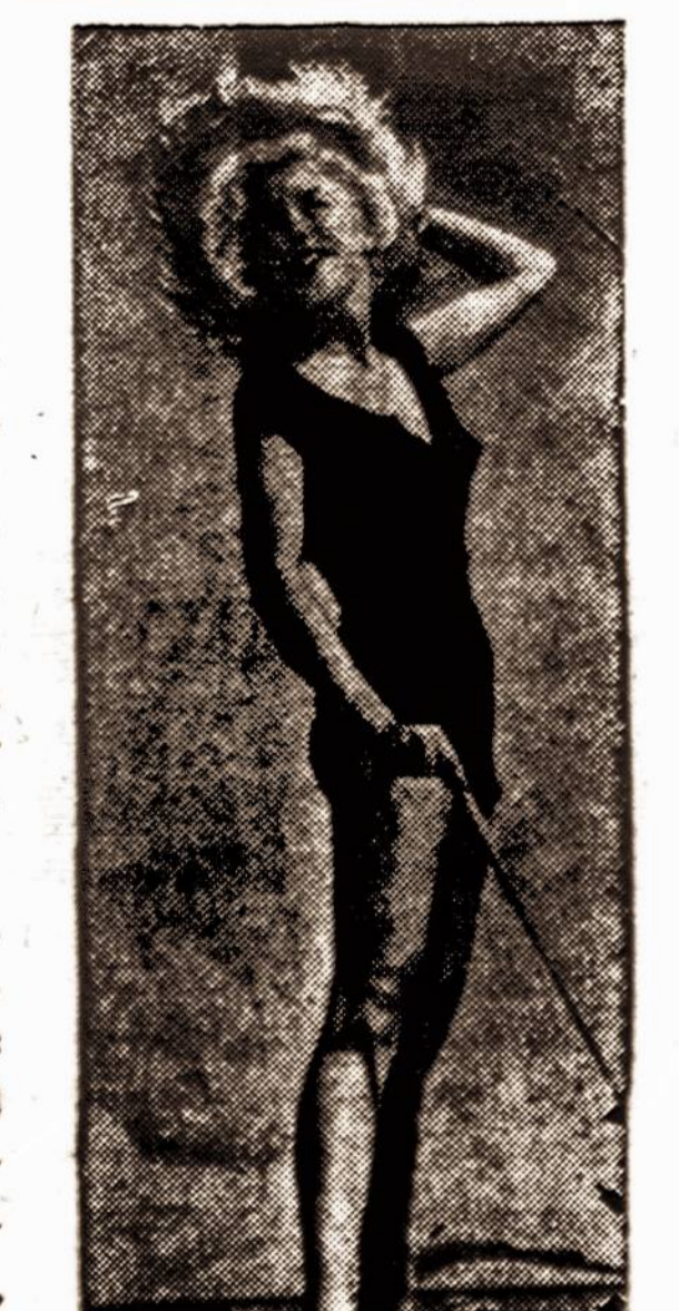
Pirmoji šiemet šlaudinė skrybelė Miami Beach, Floridoje.

Dabar gauta žinių iš Beigrado, kad naujuoju sovietų užsienių reikalų ministriu numatomas tūlas Šepilov, kuris kartu su Chruščevu lankosi Jugoslavijoje.