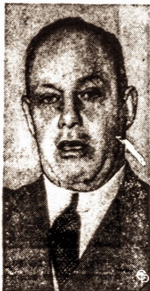
George Meany, Amerikos Darbo Federacijos pirmininkas, šiomis dienomis grizo is Vienos, kur dalyvavo pasauliniėje darbo konferencijoje.

Rennhoj (Vokietija) Ausros tuntas užmezgė satykius su Heildbergo vokieciu skautu tuntu. Yra pakvestos kelios skiltys vasaros stovyklai. Mūsų skautės ir skautai šia vasarą numato stovyklauti įvairiose Europos krastuose: Anglijoje, Austrijoje, Prancūzijoje ir švedijoje. Vokieciu Skautu Suga žadėjo paremti mūsų skautų iškylas. SKS