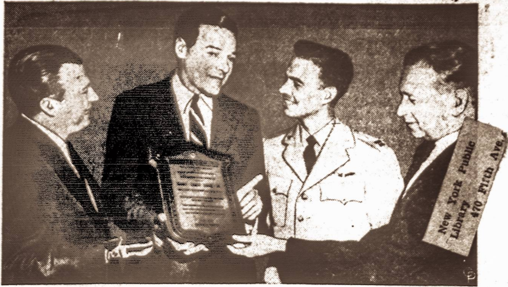
Henry Cabot Lodge, (antrasis iš kairės), JAV delegacijos Jungtinėse Tautose pirmininkas, priima sidabro skydą — JAV karo veteranų dovaną už Amerikos karių globalumą ir buvusių belaisvių uztarimą Jungtinėse Tautose.

Salia to reikėtų pasižadėti gerbti kitų tautų teises, teritorijų neliečiamybę ir nepriklausomybę. Visos valstybės turėtų sudaryti nepuolimo sutartis ir nesikišti į kitų valstybių vidaus politiką, ūkinius, politinius ir ideologinius reikalus.