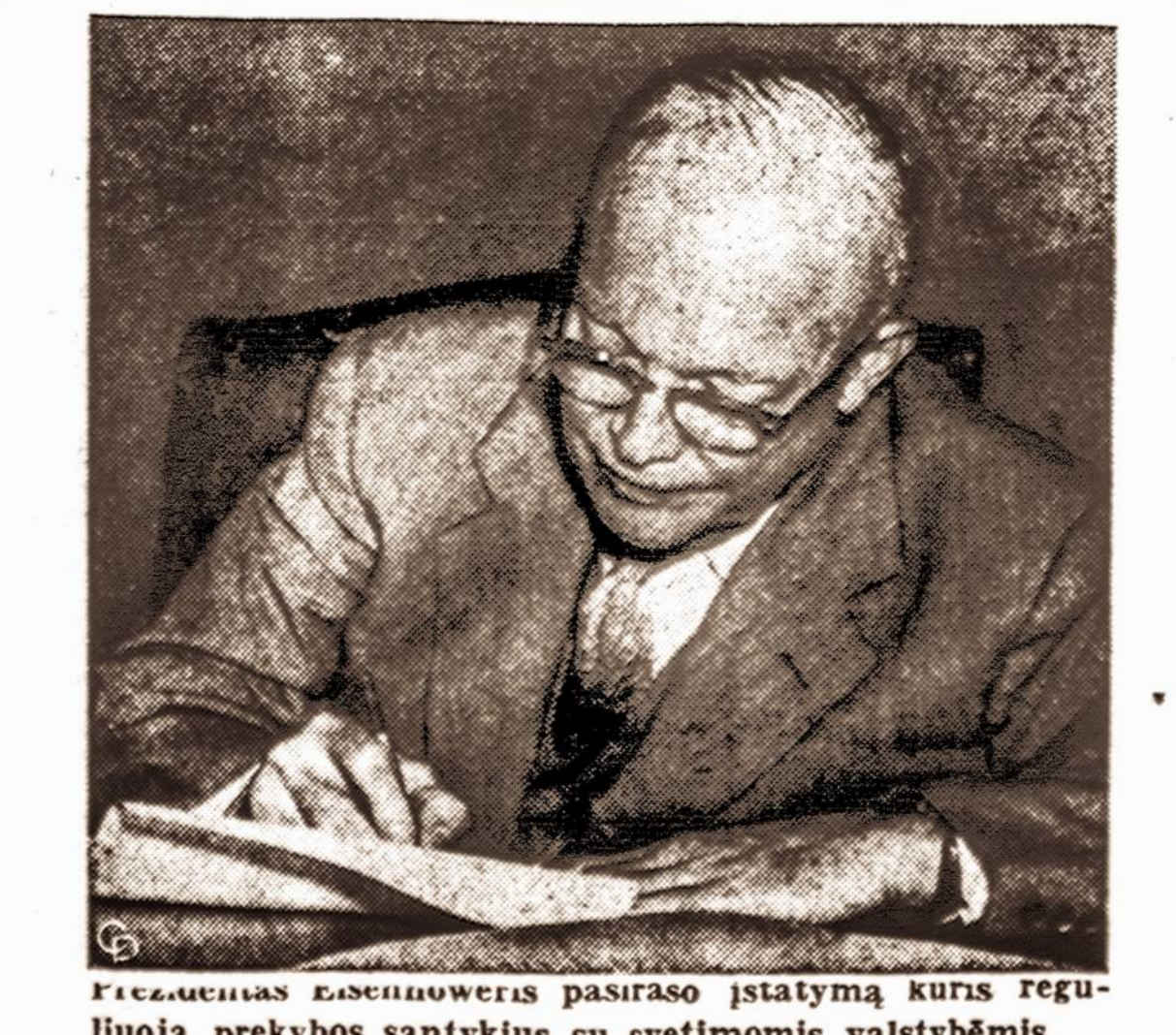
Preziumas Eisenhaueris pasirašo įstatymą kuris reguluoja prekybos santykius su svetimomis valstybėmis.

Kažin kas paskelbė, kad Pantelandolfo gyventojams (Italijoje) leidžiama emigruoti į Waterbury, Conn., kur gyvena beveik visi jų giminės žmonės tuojau pradėjo rinkti savo daiktus ir ruoštis kelionį Ameriką. Bet vienas susiprotė paklausti JAV pasiuntinbės ir gavo atsakymą, kad pie tokią "visuotinę emigraciją" niekas nieko nežino.