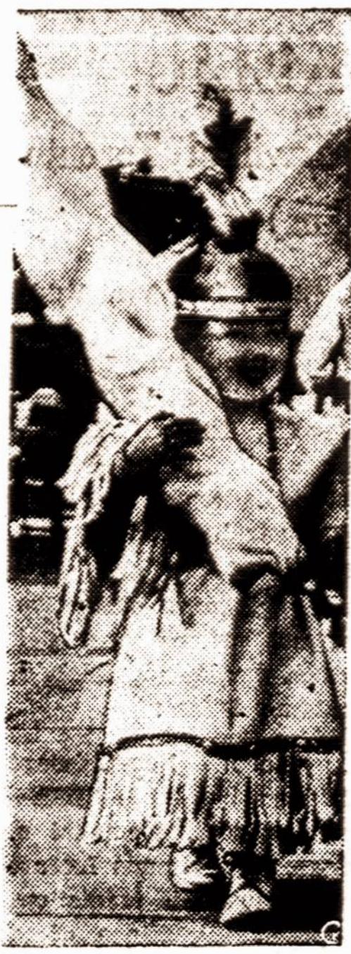
Indėnų mergytė pasirošusi metiniam indėnų festivalui Lannon, Wisc.

As gi gyvenu Naujo Jakubo gatvėje. Šios gatvės viena nuo kitos netoli. Todėl nutarėme abu rėplioti gatvių griuvėsius iki savo gyvenamų vietovių. Parėplioję kokią pusmylę, radome gatvę tarpus neužgriautus, kuriais galėjome eiti stati. Bet visvien pavojinga buvo eiti. Degantėji namai vis dar griuvo. Šlaip netaip apie vidurnaktį priėjom Seno Jakubo gatvę. Suradom ir tą vietą kur ukrainietis gyveno, bet tas namas, kuriame jis gyveno, baigė degti. Mano bendrakeleivis giliai atsiduso, nusisplovė ir nieko man netaręs, dingo is mano akių. Aš gi atsiesėdau prie sudegusio namo pamatų palisėti. Man pasidarė šalta ir ėmė mane drebuly krėsti. Gal va svaišo. Sveikesnė akis netorėjo tarauti. Kiek palisėjęs vėl ėjau pirmyn. Juo toliau, juo gaisrai darėsi didesni. Galop priėjau tą gatvę, kur aš gyvepau. Namas, kuriame su seima gyvenome, baigė degti. Prie degančio to namo stovėję juo launa vokiečiai ir graudžiai randojo dē žmuvsty tėvų slėptuvėje. Ji sakė, kad ir mano šeima šioj slėptuvėje buvo. Čia pat aš apajpau. Sanitarai vėl mane nuvežė pas stunkal