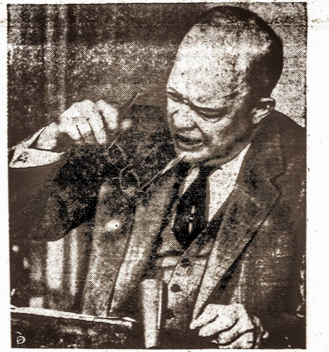
Prezidentas Eisenhoweris, kalbėdamas per televizijos ir radijo tinkle, pareiškė, kad užsienio reikalų ministrai turėsia baigti tai, ką pradėjo Keturi Didieji Genevoje.

Kai lėktuvas apėjo Londoną, jame tebuvo 14 keleivių. Kiti keleiviai ilpo Paryžiuje ir Vienoje. Tarp keleivių buvo trys kūdikiai. Be kitų tautybių, lėktuve buvo aštuoni britai.