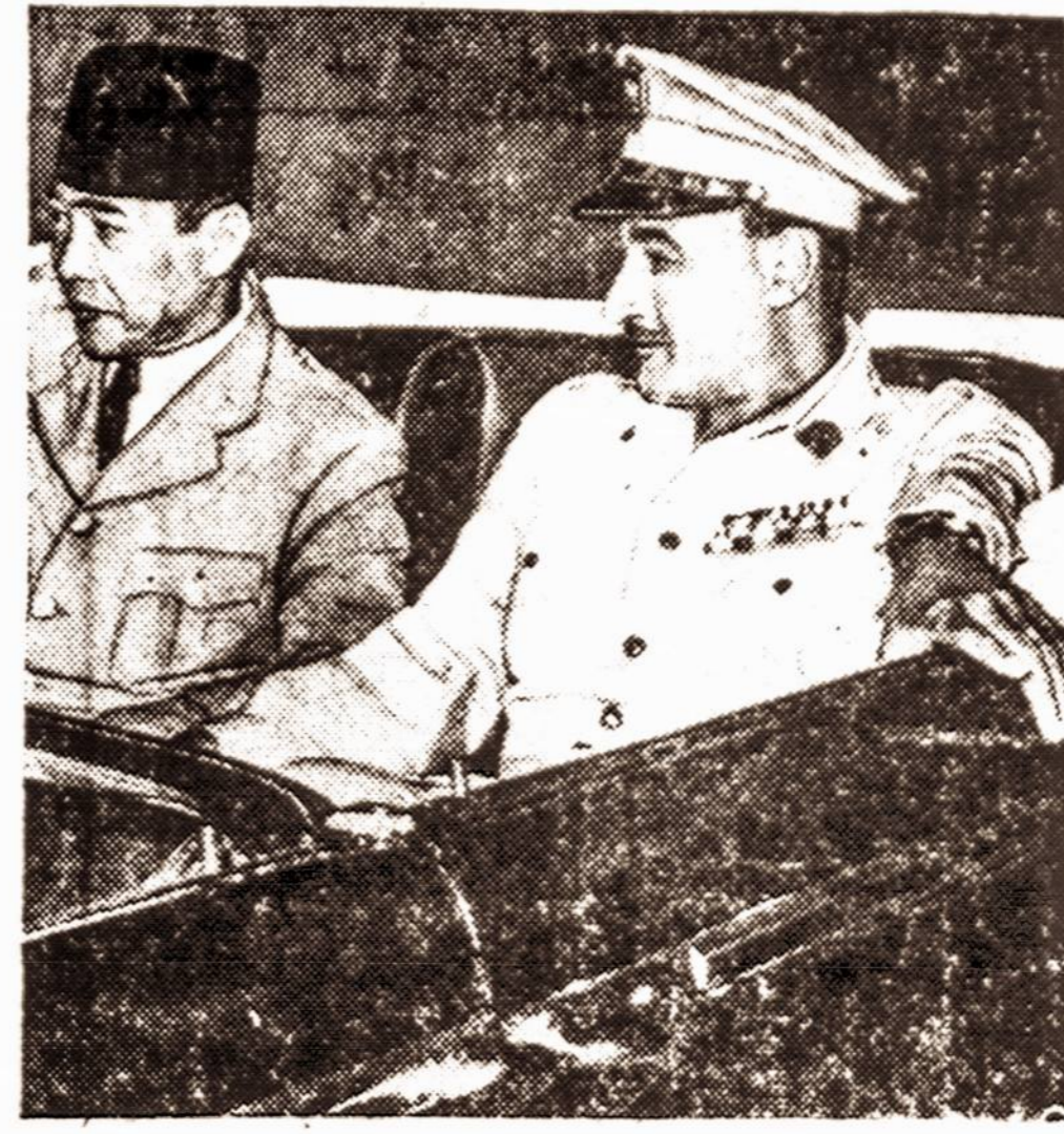
Sovietų Sąjungos prezidentas maršalas Vorosilovas (kairėje) lydi komunistinės Šiaurės Vietnamo valstybės premjerą Ho Chi Minh, atvykusį į Maskvą.