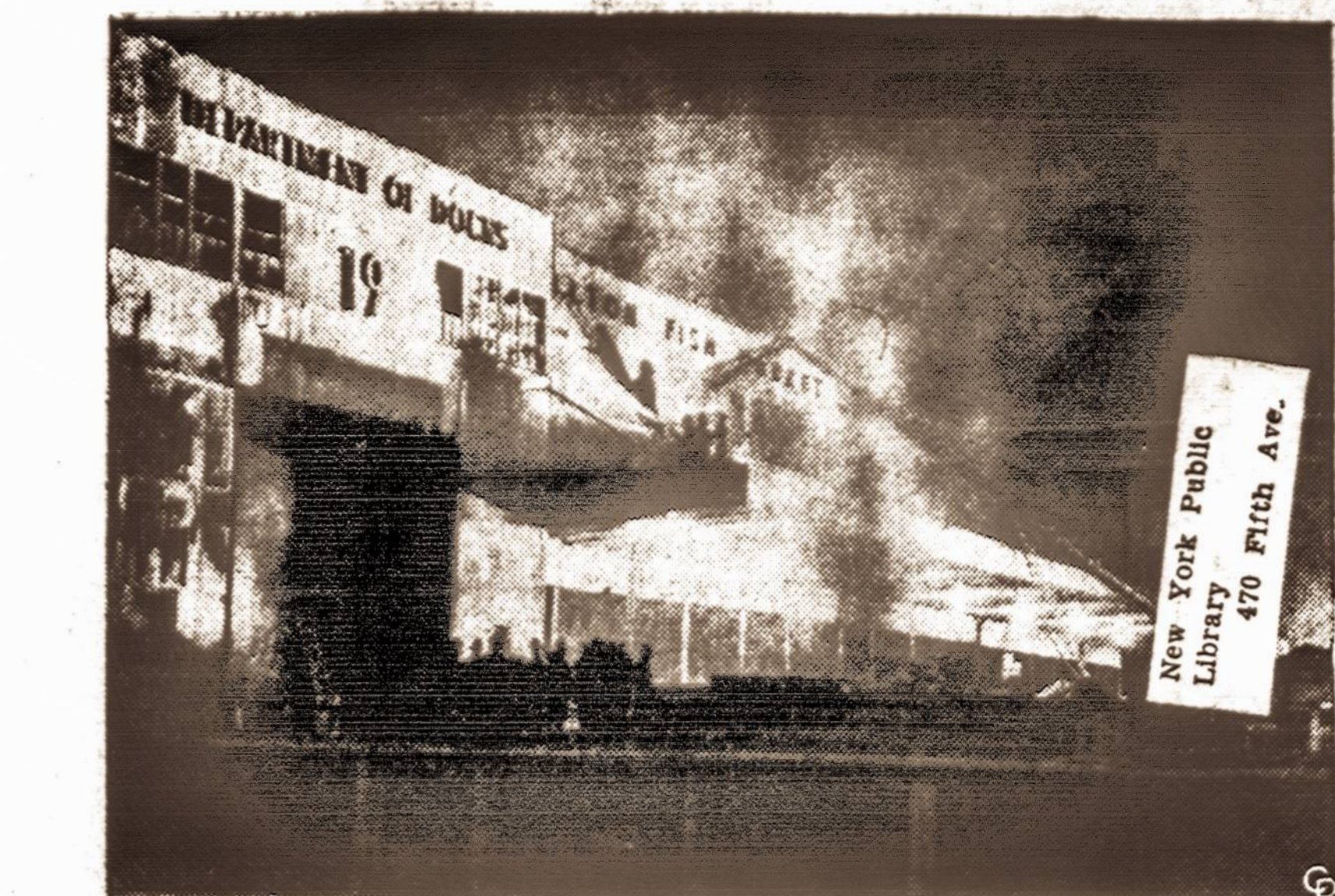
New Yorke tenka matyti ir tokių vaizdų. Štai, šiomis dienomis garsiajame Fulton žuvų „markete“ kilo gaisras, kuriam užgesinti, gaisrininkams į pagalbą turėjo atvykti net pakraščių sargybos su savo laivais. Gaisras padarė nemažai nuostolių.