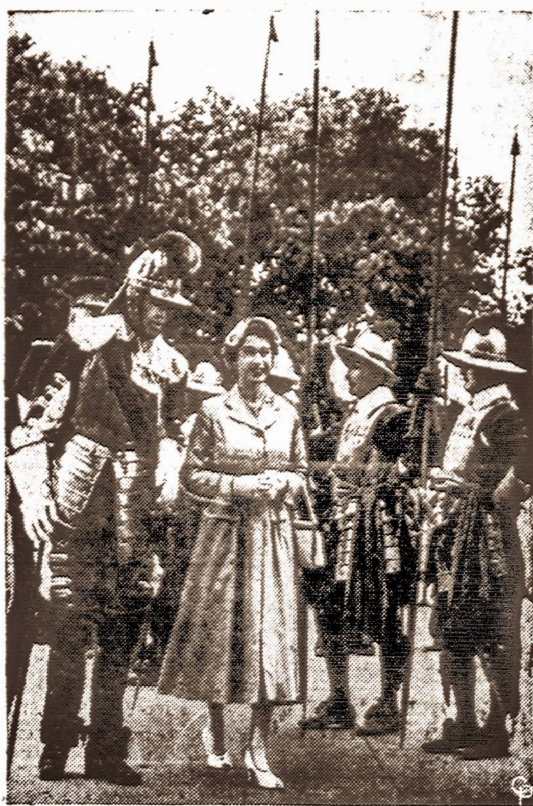
Anglijos karalienė Elzbieta II tradiciniame angliu artillerijos parade, neseniai įvykusiame Londone.