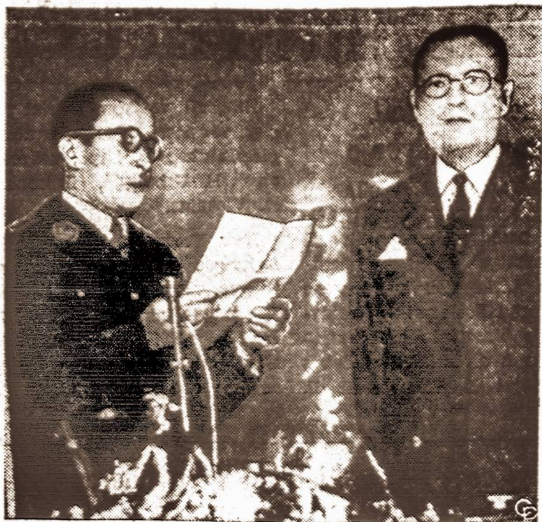
Naujasis Argentinos prezidentas mj. gen. Aramburo (kairėje), kuris jau spėjo pakeisti Peroną pakeitusį Lonardi.