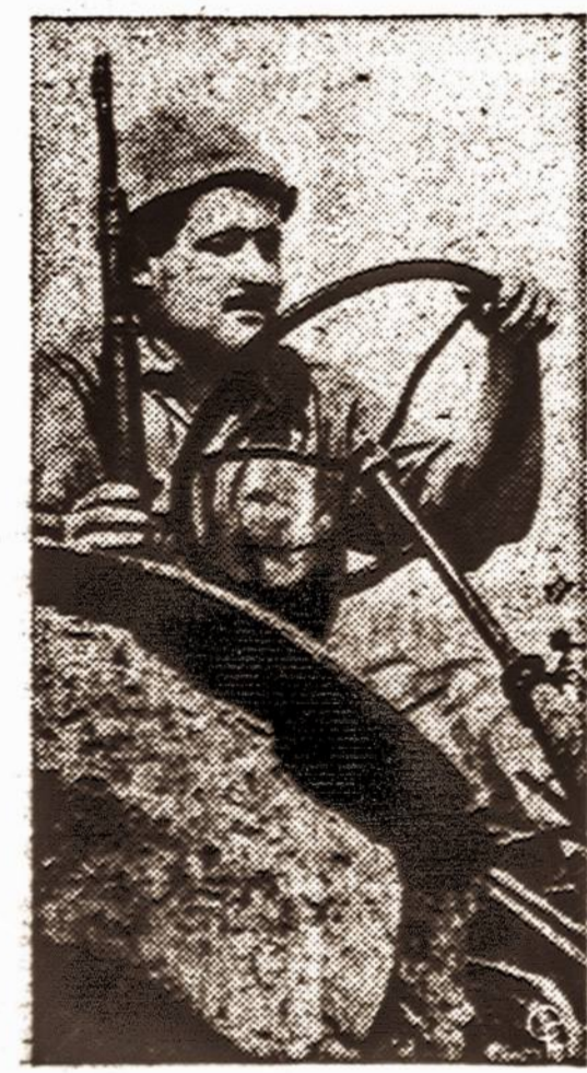
Israelio ūkininkas, bijodamas arabų užpuolimo, su šautuvu vienoje rankoje ir su trakto-riais vairu kitoje, aria žemę.

Vakariečiai leidžiasi iš lėto įveliami į šį žaidimą. Kodėl? Todėl, kad jei jie užimtų prie-singą poziciją, rizikuotų matyti vokiečius visai nusigrižtant nuo jų.