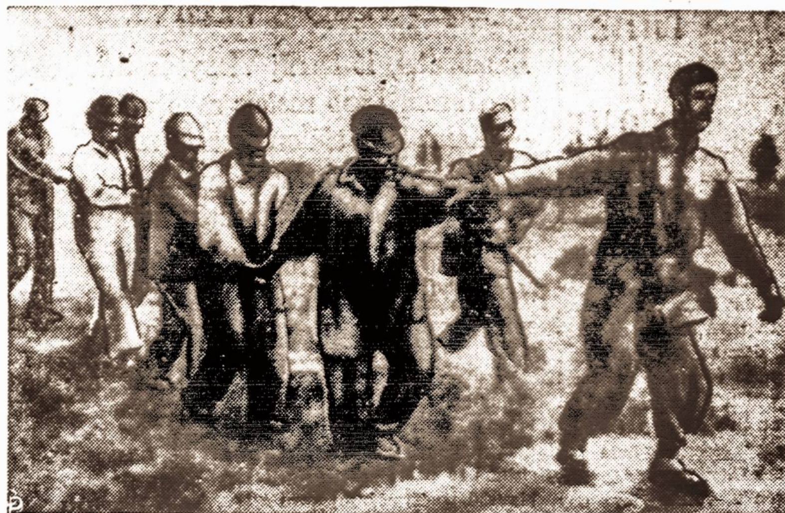
Izraelio kareiviai varosi Egipto belaisvius.

Niekas neabejoja Lietuvių Kalbos Vadovo autorių patriotiškumu. Tačiau šį neapsižūrėjimą negalima pavadinti palaiminta nesąmone. Tai jau iš dalies išėinė iš lietuvių kalbos mokslo ribų, o patenka istorijos šaltinių. Lenkams duotas naujas argumentas: Ziūrėkite, jūsų pačių veikale tvirtinama, kad Adomas Mickevičius lenkų rašytojas.