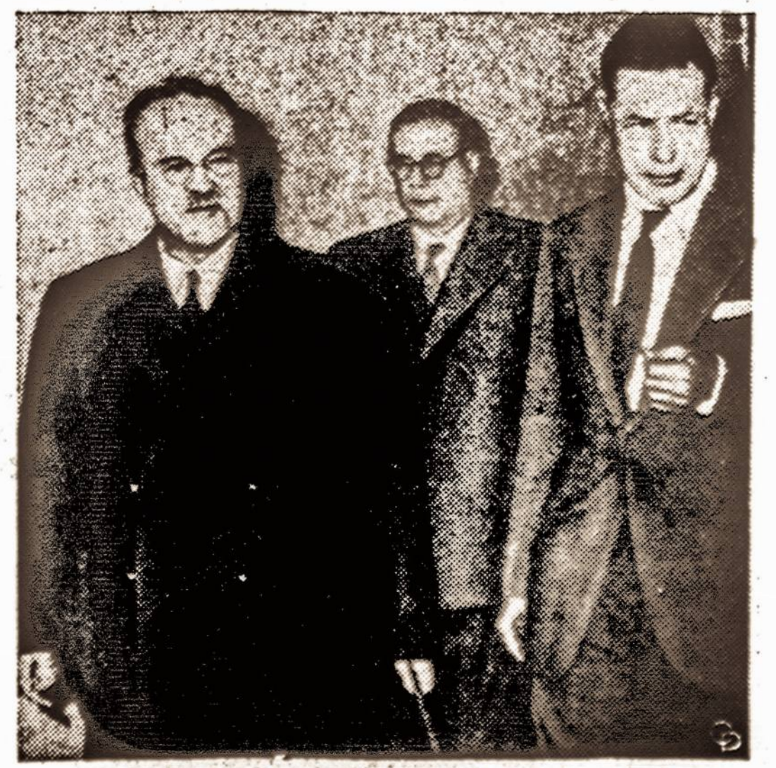
Genevos konferencijai nesekmingai baigiantis, Moloto-vas (kairėje) turėjo pasikalbėti su sekretorium Dulles.