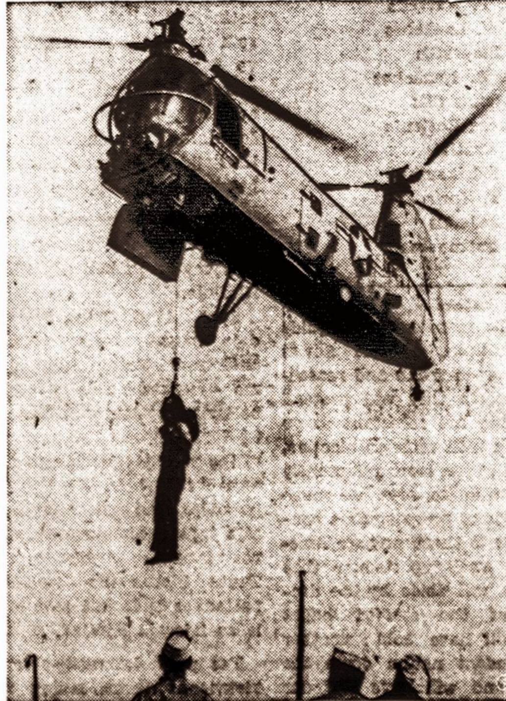
Kai laivą jūroje ištinka nelaimė...

Tad ateinančią šėštadienį, lapkričio 19 d., visi keliai tegu veda visus į gražųjį Stamfordą, V. J.