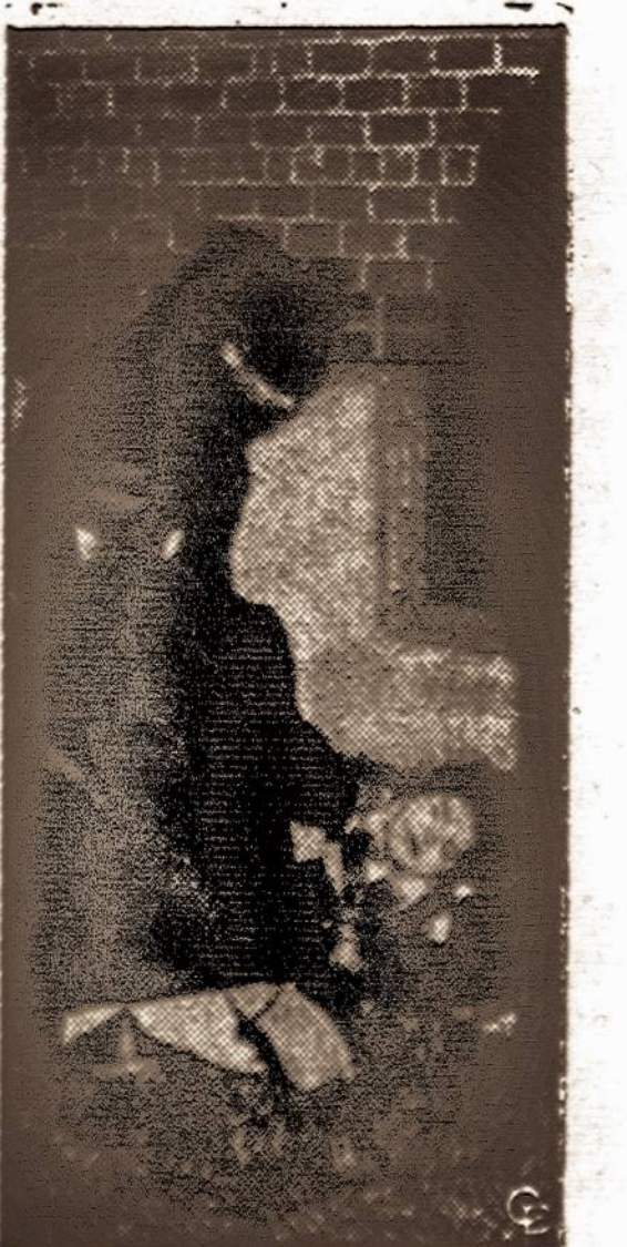
Policija suteikia pirmąją pagalbą 16 metų Bronxo merginai, kuri nukrito iš trečio aukšto ir sunkiai susižeidė.

Žmogaus tikrasis turias yra tas gėris, kurį jis atlieka šiame pasaulyje. Mohammed Tas žmogus turtingiausias, kurio malonumai pigiausi.