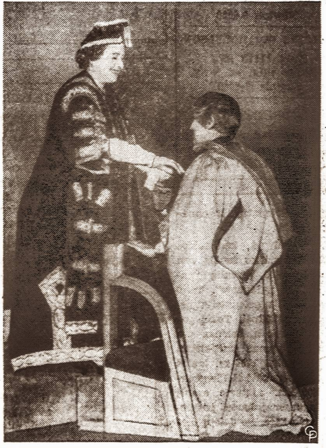
Karalienė motina Elzbieta, Londono universiteto garbės pirmininkė, įteikia teisių daktaro laipsnį Madam Pandit, Indijos politikei.