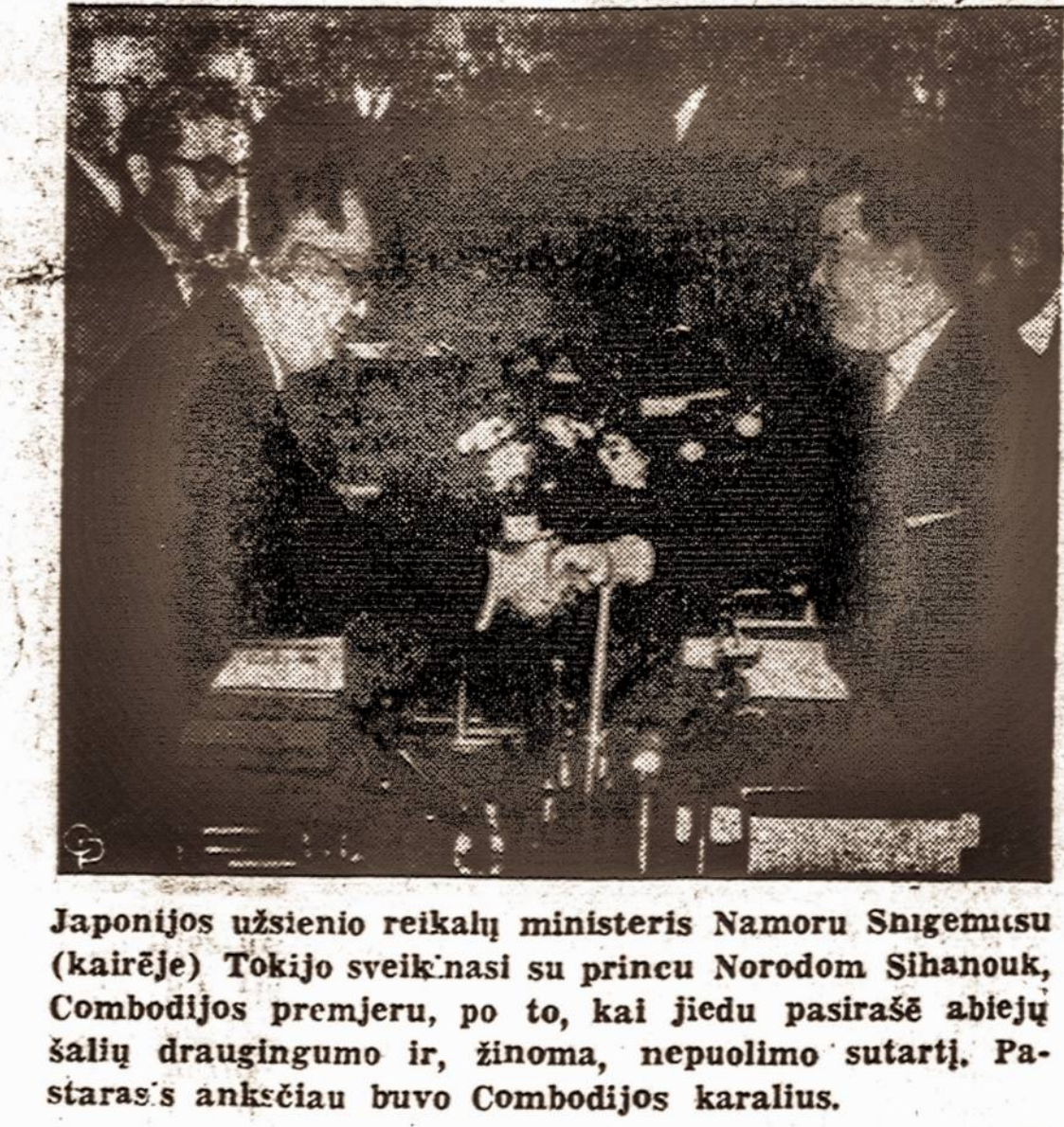
Japonijos užsienio reikalų ministeris Namoru Šigemisuu (kairėje) Tokijo sveikina su princu Norodom Sihanouk, Comboldijos premjeru, po to, kai jie du pasirašė abiejų šalių draugingumo ir, žinoma, nepuolimo sutartį. Pastarasis anksčiau buvo Comboldijos karalius.