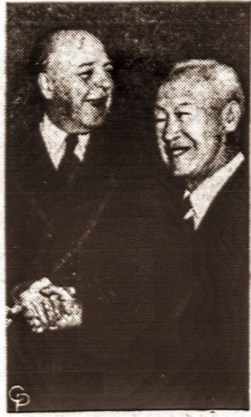
JAV Armijos sekretorius Brucker sveikintis su Pietų Korėjos prezidentu Rhee. Brucker buvo nuvykęs apžiūrėti JAV ginkluotą pajėgų Korėjoje.