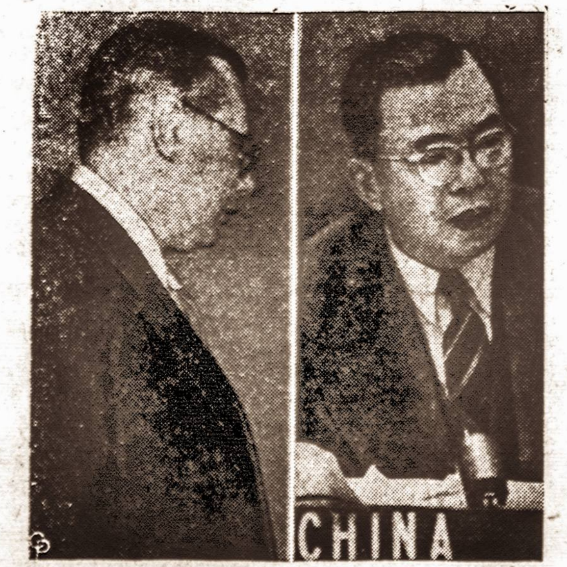
Arkady Sobolev (kairėje), Sovietių delegatas Jungt. Tautosose, ir dr. Tingfu Tsiang, nacionalistinės Kinijos delegatas. Dėl priėmimo ar nepriėmimo i Jungtines Tautas 18 naujų narių, jų tarpe 5 komunistinės, įvyk didelė kovą, kurios svarbiausi dalyviai buvo šie delegatai. Dr. Tsiang, panaudojęs veto teisę prieš komunistines Mongolijos priėmimą, tą kovą, betgi, laimėjo, sunaikindamas vadinamą "package deal".

Europoje ir visame pasaulyje sukėlė sensaciją žinia, kad dr. Otto John, buvęs Vakarų Vokietijos slaptuos tarnybos viršininkas, kuris 1954 m. liepos 20 d. pabėgė i Rytų Vokietiją, šiomis dienomis grįžo atgal ir dabar tardomas. Sovietų ambasadorius Rytų Vokietijoje, Georgi M. Puškin, vienodo turinio notose, pasišysose Britanijos, Prancūzijos ir JAV ambasadoriams Bonnoje, pareiškė, kad keturių valstybių valdžia Berlyne laikoma nebegaliojanti. Demokratų partijos sluogsnuose kalbama, kad atelnančiuose prezidentiniuose rinkimuose gali iškilti dabartinio Ohio gubernatoriaus Frank J. Lausche kandidatūra.