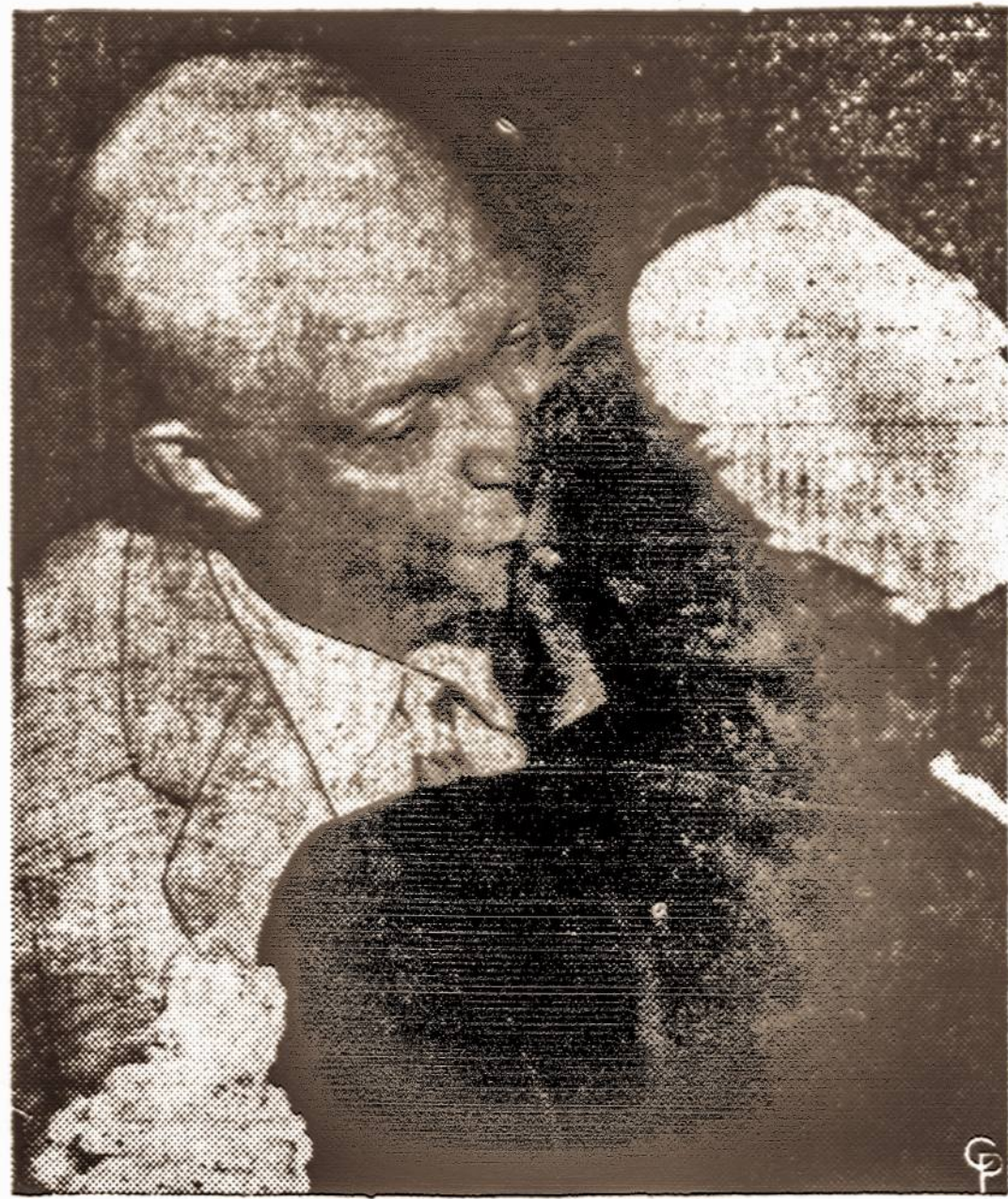
Eisenhoweris Floridoje pasitinka atvykusią žmoną.