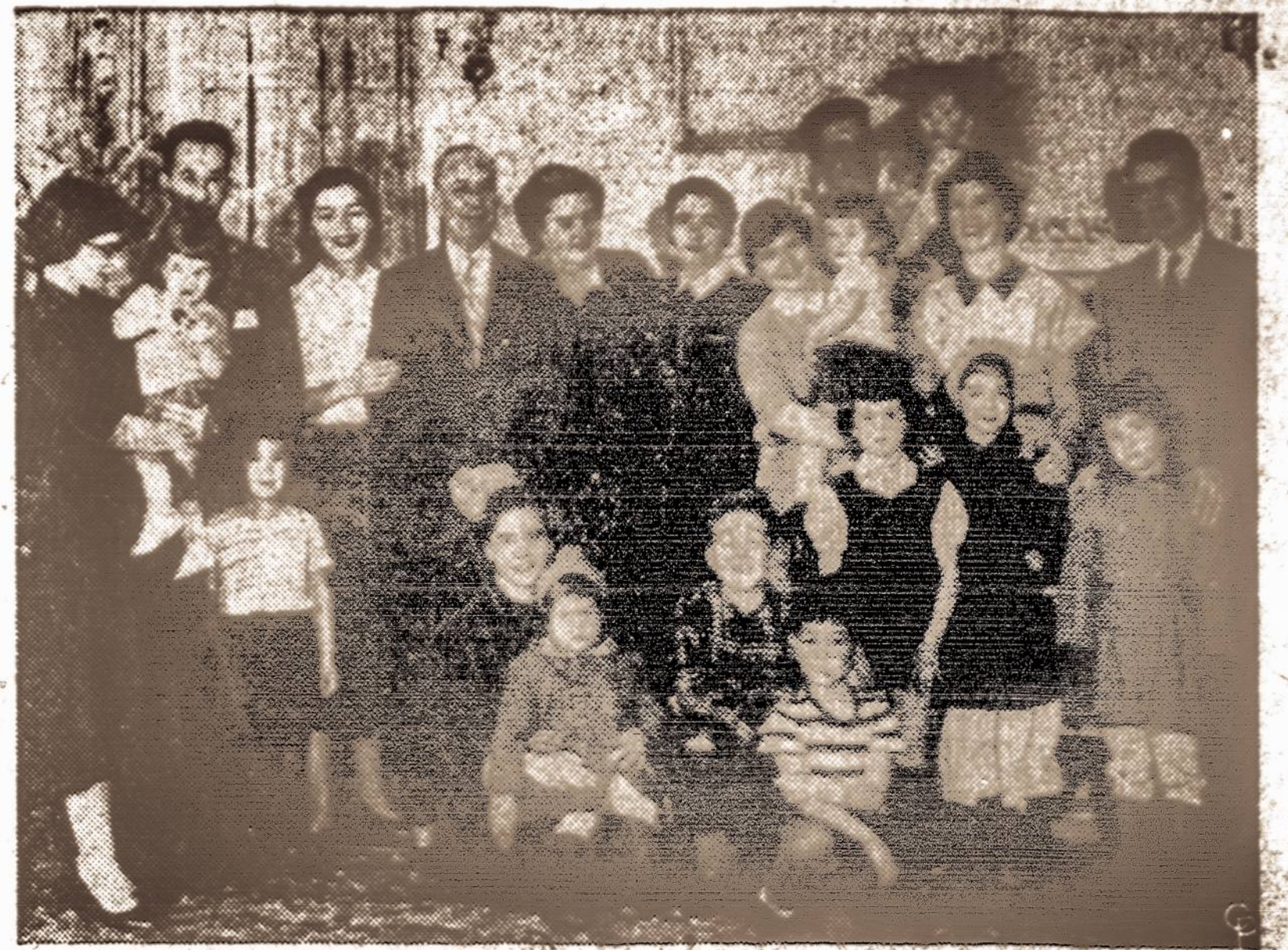
Taip atrodo ta garsioji Kanados prancūzų Dionne šeima, kurios moterai buvo daryta pračių švenčių proga. Spaudoje buvo skelbiama, kad Dionne ketveriukė, kuri dabar gyvena Montreale, nenori matyti savo tėvų. Tie gandai buvo paneigti, kai trys Dionne dukters atvyko į Callander, Ont., kur gyvena jų tėvai, broliai, seserys ir anūakai. Šiame paveiksle dar trūksta penkių Dionne vaikų.