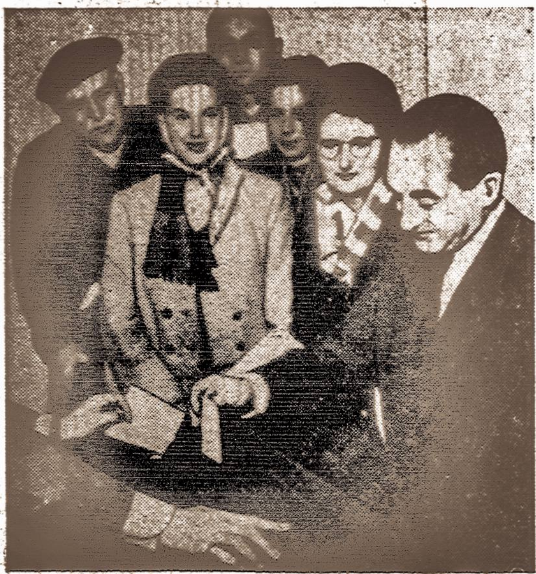
Buvęs premjeras Mendens-France balsuoja Paryžiuje.

Baigdamas pranešimą, Prezidentas Eisenhoweris vėl priminė, kad Aliaskai ir Hawajų saloms reikia duoti valstybinės teisės.