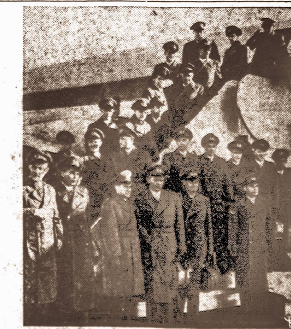
Vakarų Vokietijos kariai New Yorke, šie 38 vokiečių kariai ir kareiviai atvyko į Ameriką studijuoti.

● Prancūzijos respublika "gelbėti", premjeras Faure ragina nuosalkesnes grupę, sudaryti bent "laikina valdymą".