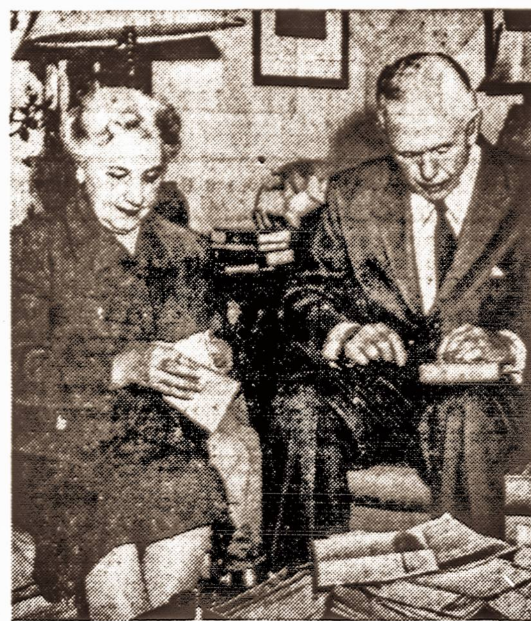
Gen. George C. Marshall, buvęs JAV vyr. štabo viršininkas, žmonai padedant, skaito sveikinimus, prisijungusio 75 gimtadienio proga.

— Skaudvilės rajono Stalno kolūkyje "prieš 3 metus buvo pradėta kauliudės statyba, kuri šiais metais nebus baigta".