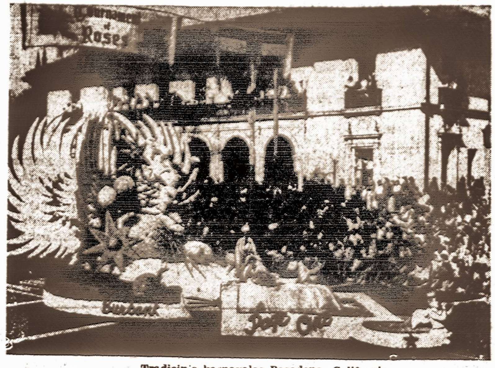
Tradicinis karnavalas Pasadena, California.