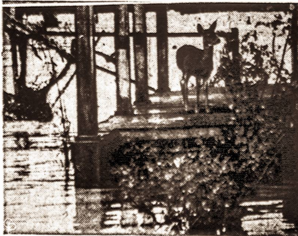
Iš buvusio potvynio Kalifornijoje.

Tad kaip gali būti visumos pasitikėjimas, kai tie patys ar panašiai galvoją žmonės vėl stengiasi vadovauti tautai bei