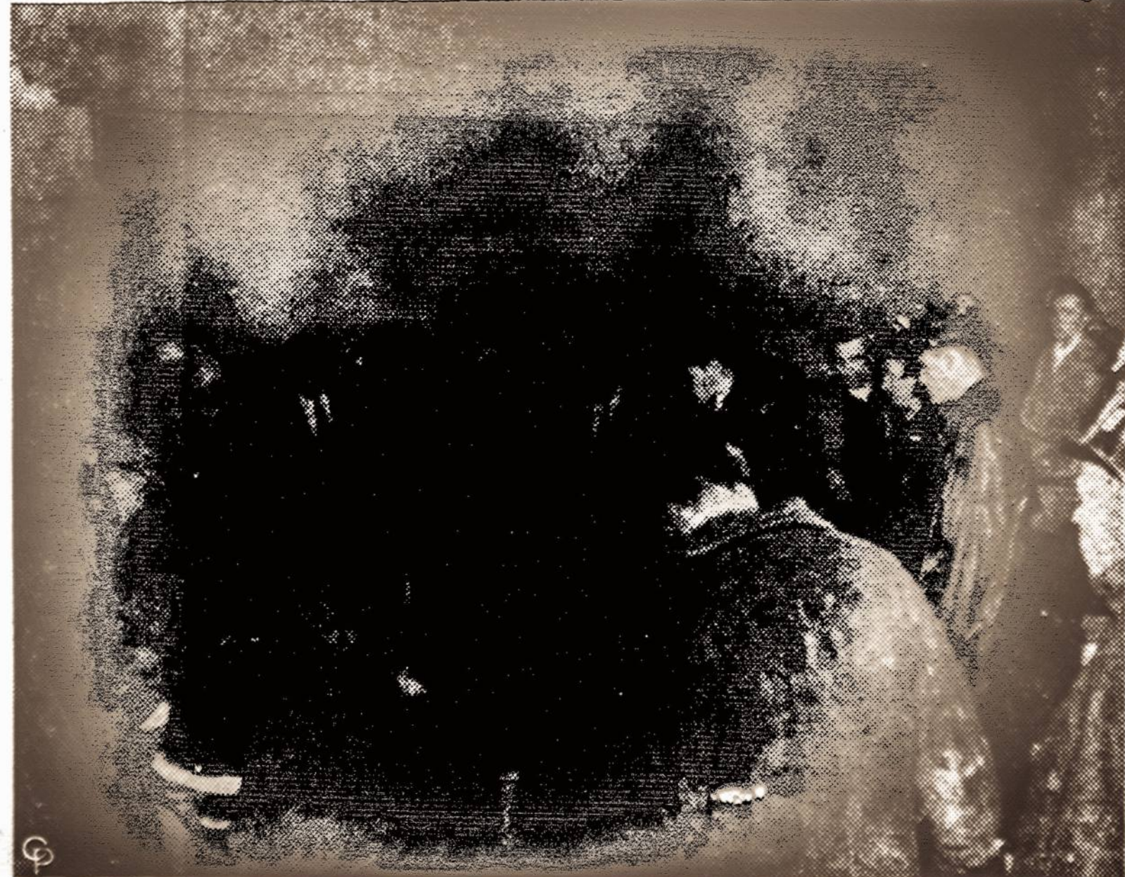
Šiominis dienosis Baltimorėje vienos parašios salėje įvyko tradicinė austrių puota, kurioje dalyvavo apie 1,000 asmenų. Tos puotos metu namuose kilo gaisras, ku-riame 11 žuvo ir apie 200 sužestų.