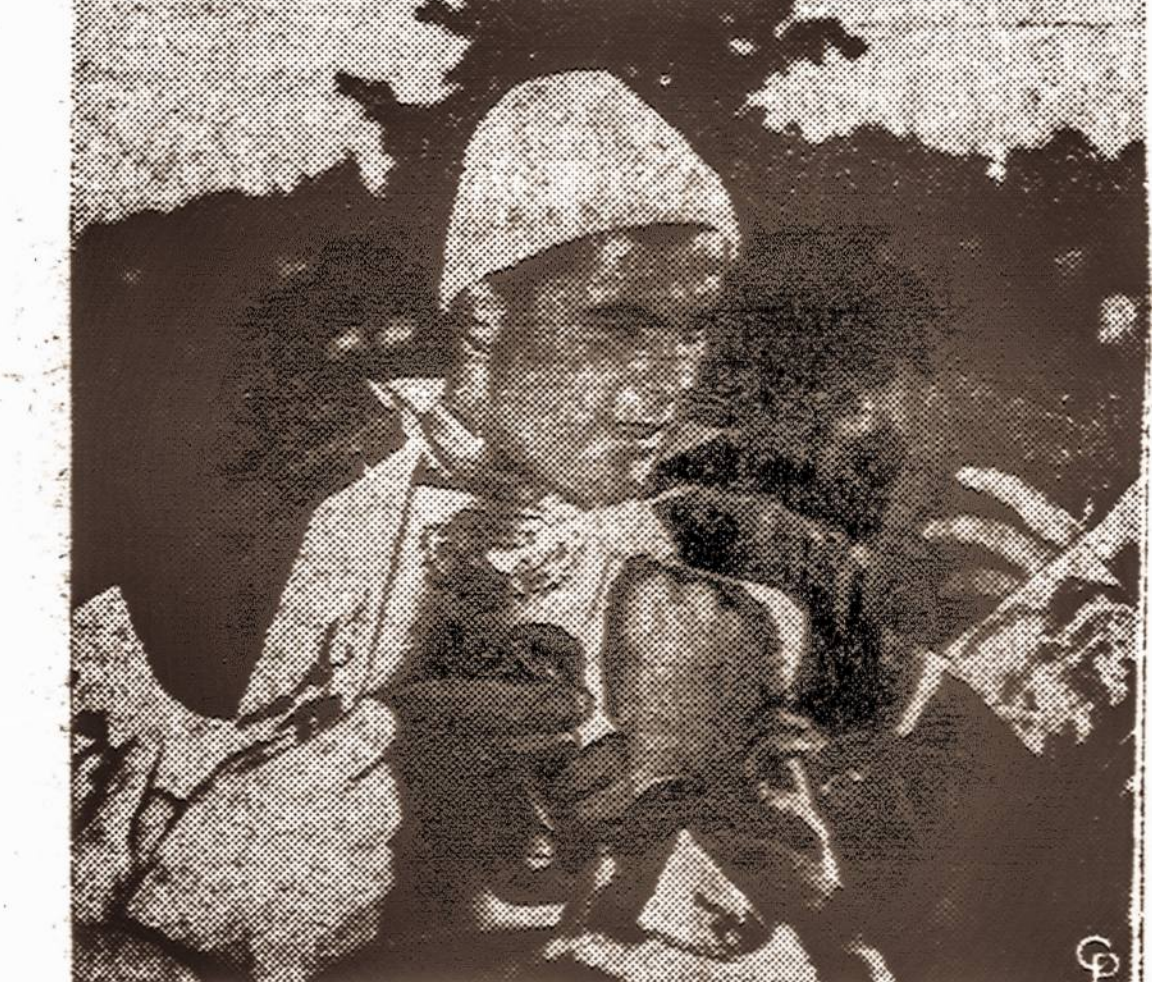
Vienas Olimpijados laimėtojų Italijoje dalina autografus entuziastams pagautiems dalyviams.

● Norvegų karo laivynas su laikė 14 sovietų žvejybos laivų, sąmoningai ar nesąmoningai patekusių į Norvegijos teritorijos vandenį.