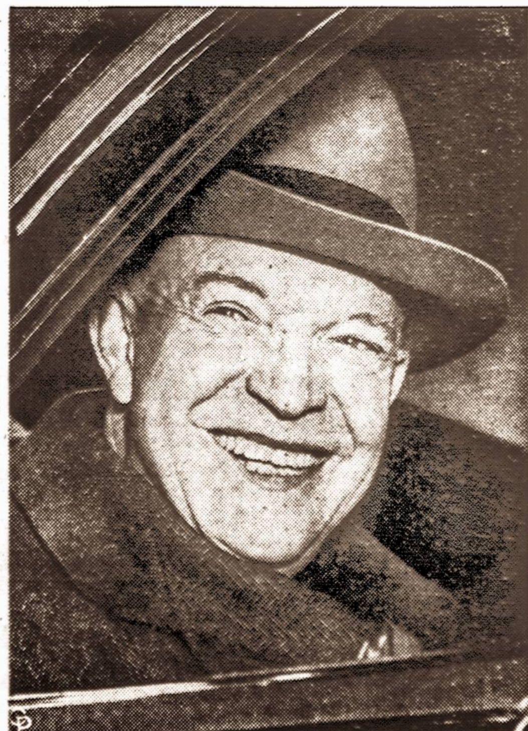
Prezidentas Eisenhoweris, šią savaitę su žmona išskridęs atostogų į Georgiją valstybę, gydytojų nuomone, esąs pasveikęs ir tinkamas darbu. Si maloni aplinkybė republi- konų partijos sluogsnuose sustiprino viltis, kad Eisen- howeris tikrai kandidatuos antrajam terminui.