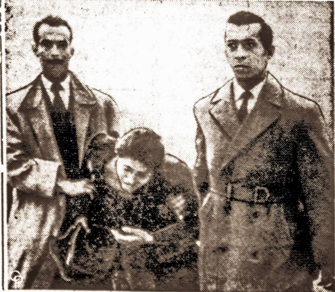
Vaiždai iš studentų demonstracijų Atėnuose. Viršuje studentai neša sužeistą draugą. Apačioje — taip pat su- zeista studentė.