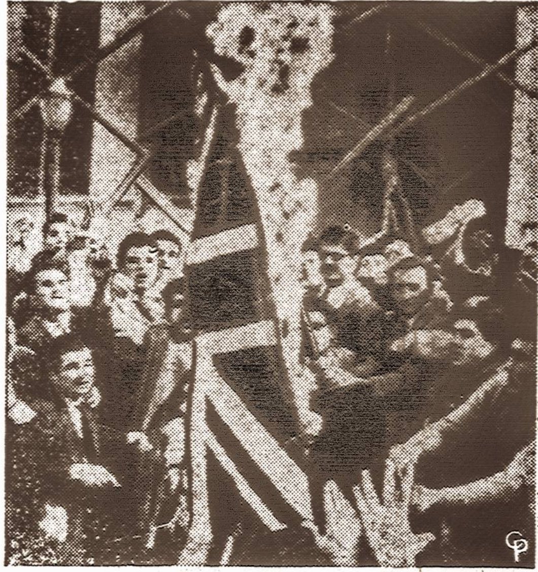
Atėnų studentai, protestuodami dėl Kipro archyvskupo Makarios ištrėmimo, sudegino Britanijos vėliava. Tuo patiu kartu Kipro saloje paskelbtas generalinis streikas. Kovos vyksta visoje britų valdomoje Kipro saloje.

Nežiūrint to, angliai pasiryžę tvirtai laikytis ir iš Kipro salos nepasitraukti.