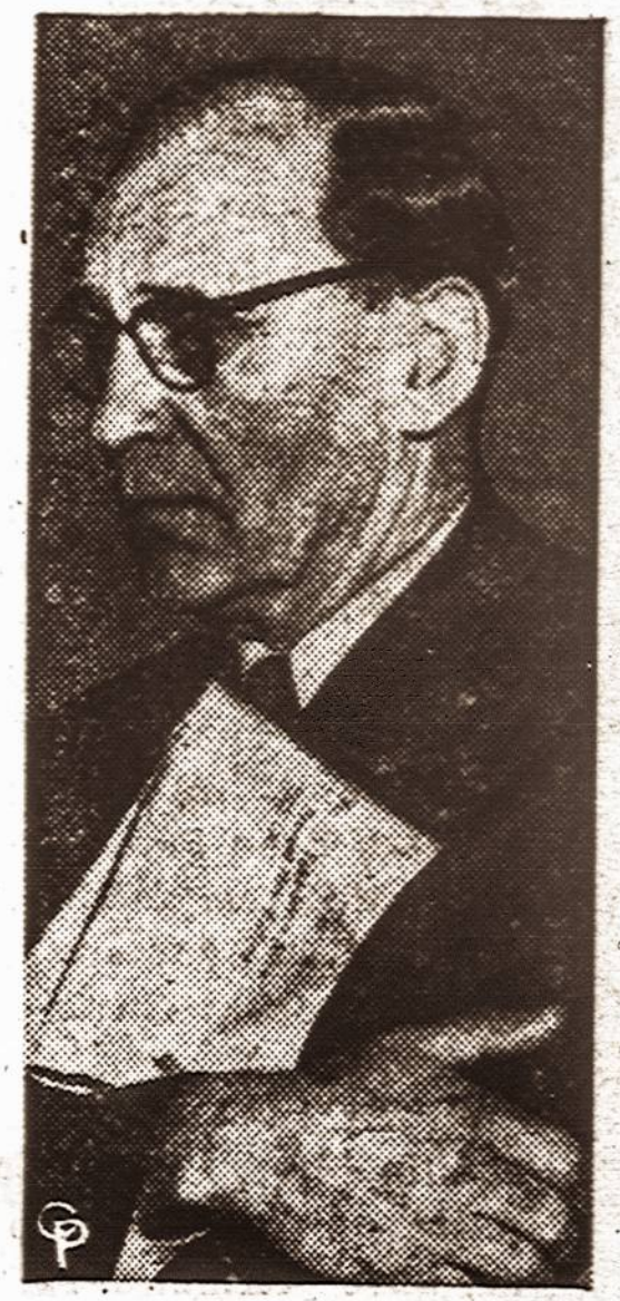
Senatorius John McClelland, demokratas iš Arkansas, sutiko vadovauti Senato komisijai lobistų veiklai tyrinėti.

lių. Iš jų tarpo tik 11 sovietų piliečių, 4 latviai ir 1 lenkas sutiko grįžti atgal.