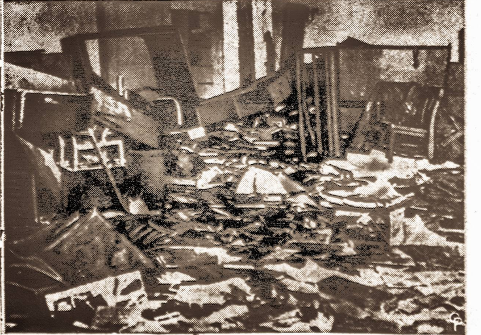
Stai kas liko iš Jungtinių Valstybių konsulato raštinės Tunise, kai įsiveržusi minia sudaugė šėpas ir išdraskė dokumentus. Prancūzijos vyriausybė tuojau atsiprašė dėl šio "nedovanotino elgesio", nukreipto prieš "amerikiečių kišimąsi" į Tuniso reikalus.