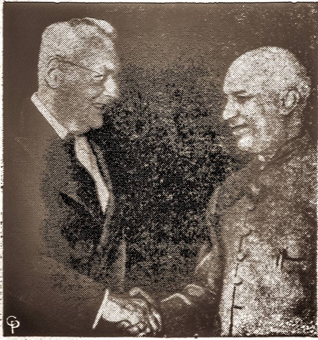
Valstybės sekretorius Dulles buvo nuvykęs į New Delhi, Indijos sostinę, kur jį pasitiko premjeras Nehru (dešinėje). Sekretorius Dulles užtikrino, kad Amerikos pagalba, teikiama Pakistanui, nėra nukreipta prieš Indiją.