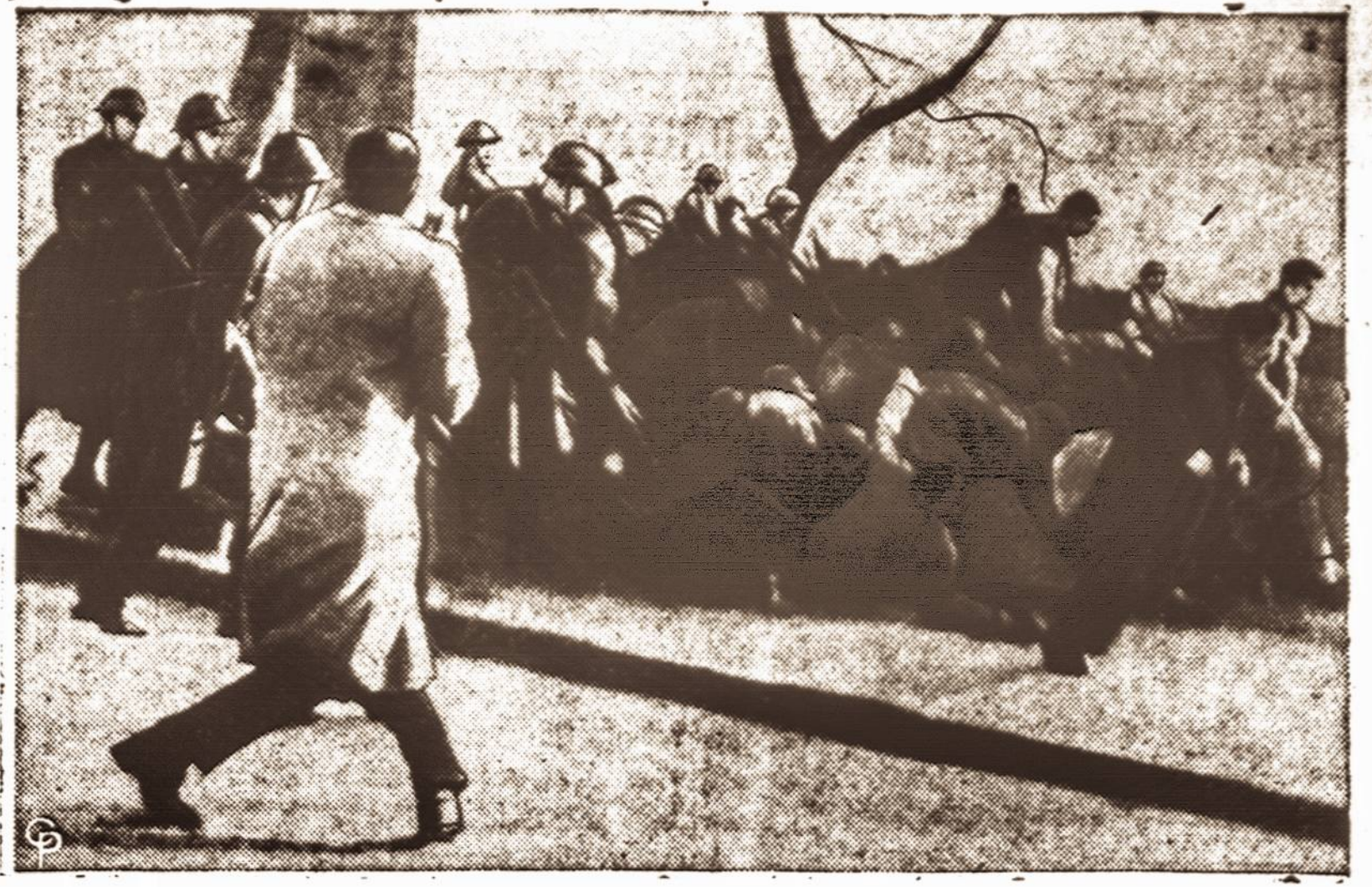
Alžyro darbininkai Paryžiuje susikirto su policija. Demonstrantai mėgino žygiuoti prie parlamento rūmų, kur tuo metu buvo debatuoama valdžios reikalavimas duoti speciales teises Alžyro sukilimui malšinti. Policija suėmė apie 2,300 demonstrantų.