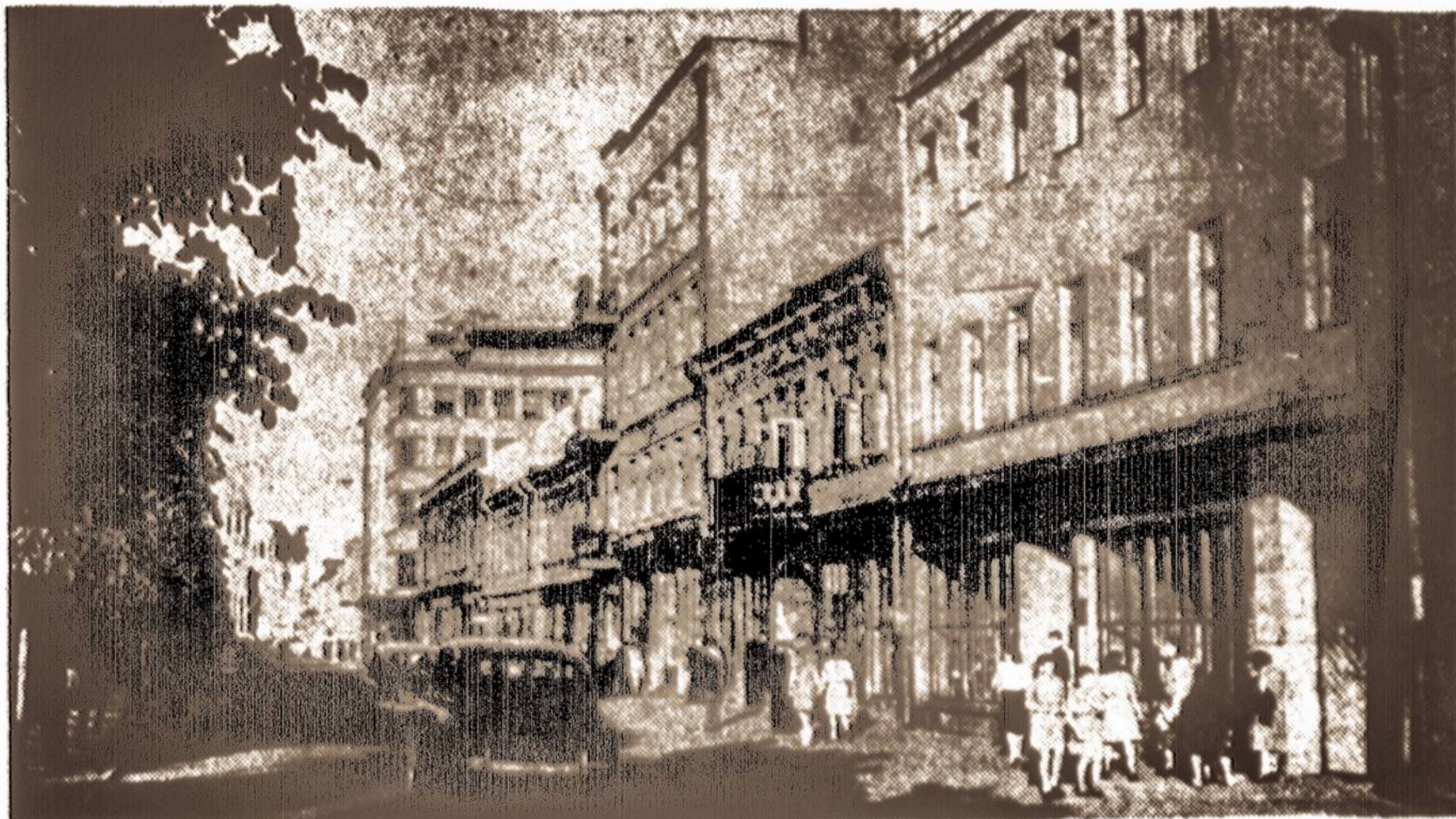
VIRŠUJE: Kauno Laisvės alejoje, kurią okupantai pavadino Stalino prospektu, buvo prisistieigę degtinės kioskai, kuriuose žmonės gaudavo nusipirkti degtinę kaip kokį laikraštį... Krautuvių iškabos, kaip matyti, yra dviem kalbom - lietuviškai ir rusiškai.

Vienybės spaudos technikos pakeitimas pareikalavo didelių išlaidų. Todėl skaitytojais, kuriems nuoširdžiai rūpi laikraščio ateitis, kviečiami į talką.