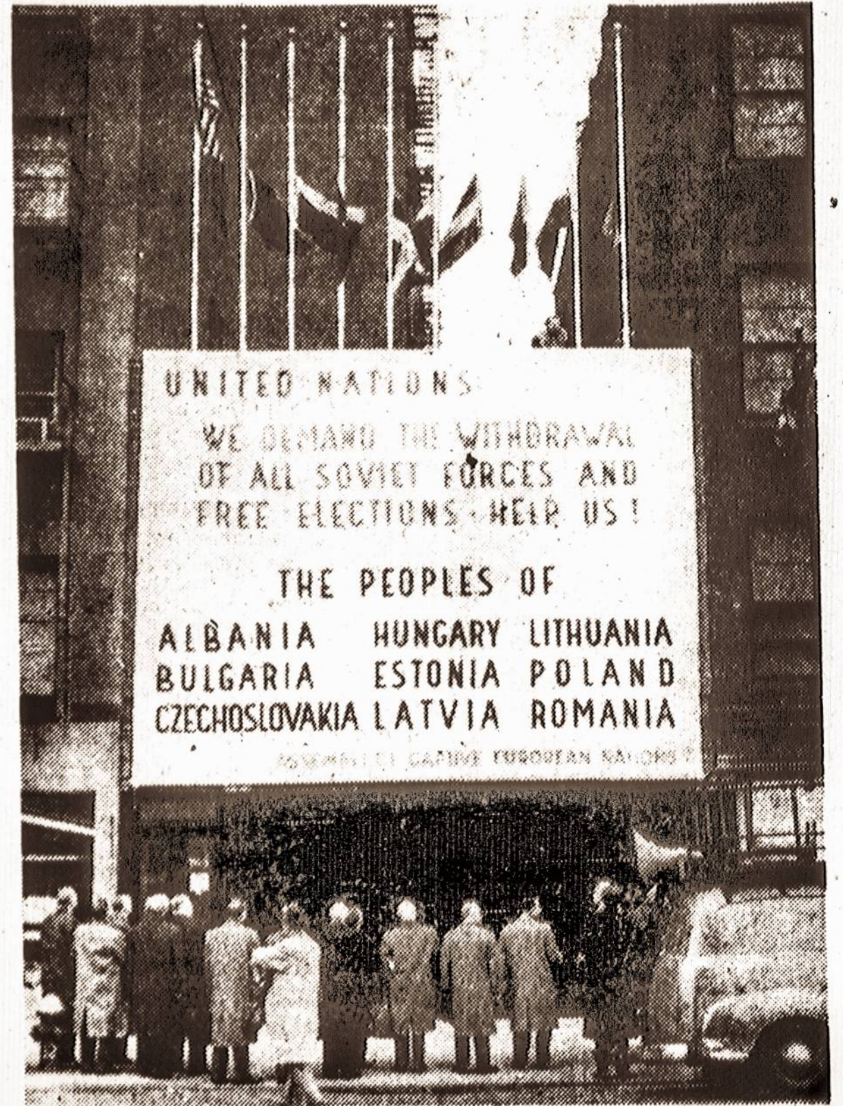
PJT rūmai New Yorke.

Daug padrašinančių žodžių pasakė ir sen. Humphrey, pažymėdamas, kad istorija yra Jungtinėms Valstybėms uždėjusi di-