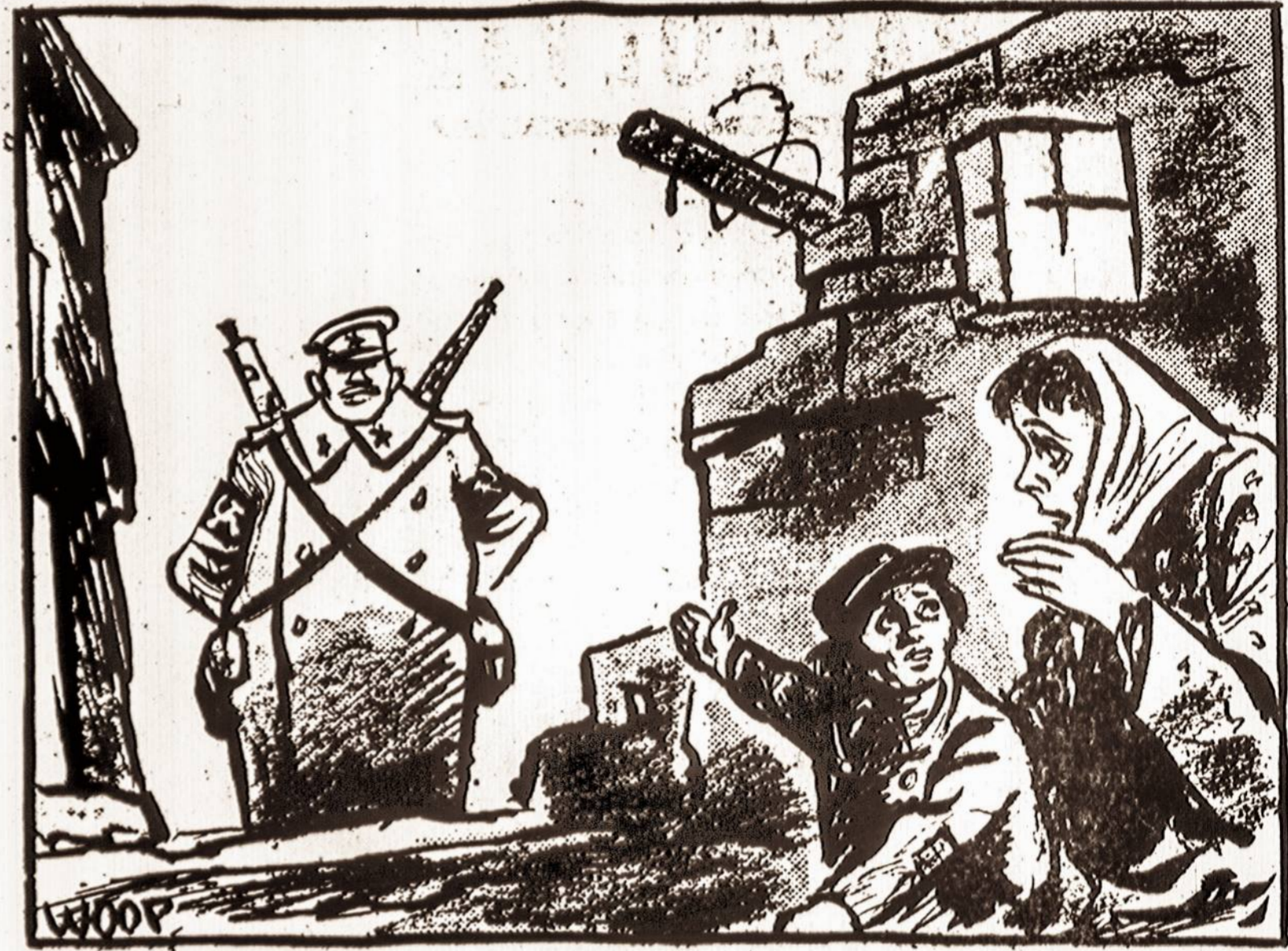
Naujieji Metai Vengrijoje.