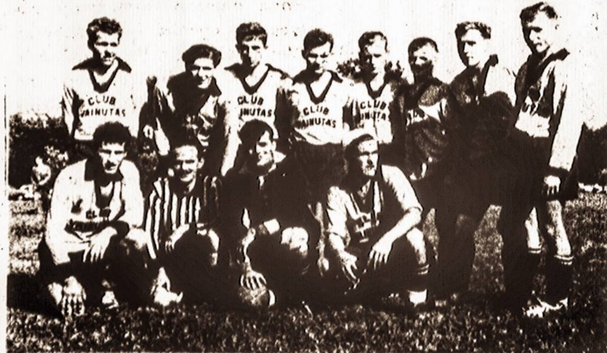
Chicagos Lietuvių Futbolo Klubu komanda