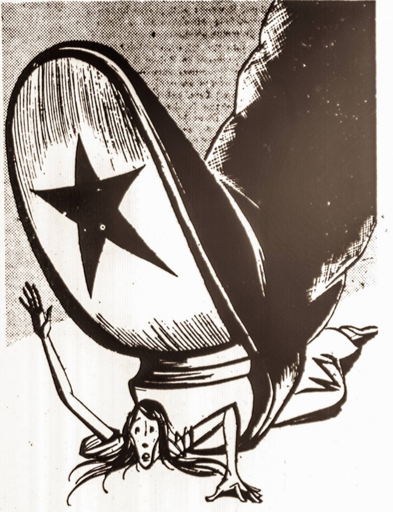
Lietuva po komunizmo batų.

"Lietuviai! Mūsų krašto, mūsų žemės ir laisvės likimas mūsų pačių rankose. Tegu atbunda mūsų Lietuvos narsiąjų karžygių dvasia. Senovėje, kada nekartą nuo žmūs priešininkai užpuldavo Lietuvą iš visų pusių, kada rodėsi nebėra išganymo, mūsų protėviai stodavo petys į petį į kovą dėl savo laisvės išvydavo priešus ir išvadudavo ją; tai būkime ir mes verti jų ainiai, -- stokime vyras į vyrą ginti tėvynės. Laikinoji Vyriausybė daro tvarką šalyje, organizuoja Lietuvos pulkus. Lietuvos karžygiai jau tūda gyvybę ir guldo galvas dėl gimtojo krašto, dėl mūsų laisvės. Stokime į jų eiles visi, kas pakeliamė ginklą. Būsim stiprūs ir drąsus -- atremsime visus priešo antpuolius, išvysime jį iš Lietuvos žemės ir išgelbėsime ją iš vergovės." A. D.