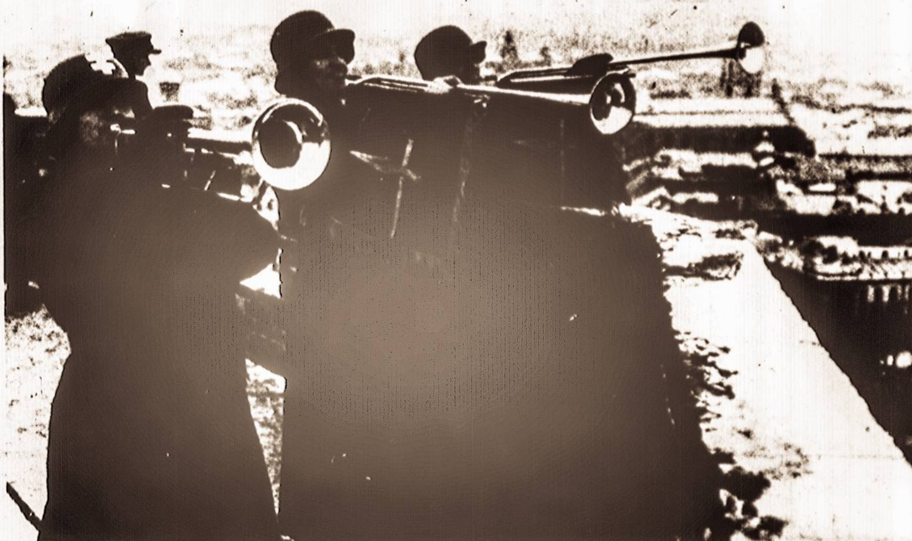
TRIMITAI ŠAUKIA - TĖVYNĖ LAUKIA. — 1940 m. vasario 16 d. Lietuvos kariuomenės trimitininkai vėliavos pakėlimo metu Gedimino pilies bokšte, Vilniuje.

„Šiuo metu prezidentas rašo mokslo veikalus ir ruošia savo atsiminimus spaudai. Lietuviai užsienyje su dideliu dėkingumu ir meile atšventė to didelio patrioto ir žymaus valstybės vyro 90 metų gimimo dieną.“