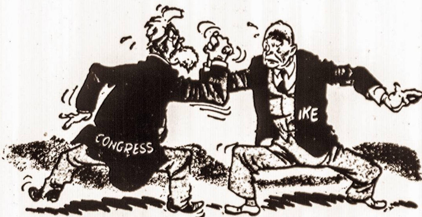
Kongresas su Ike, atrodo, nori imtis...

Tiesa, vienas kitas senesnio amžiaus asmuo jau yra atvykęs. Bet tai reti įvykiai. Neseniai atvyko viena moteris, bet jos dukteris tebėra Lietuvoje, ir niekas negali pasakyti, kada jai bus leista atvykti pas motiną.