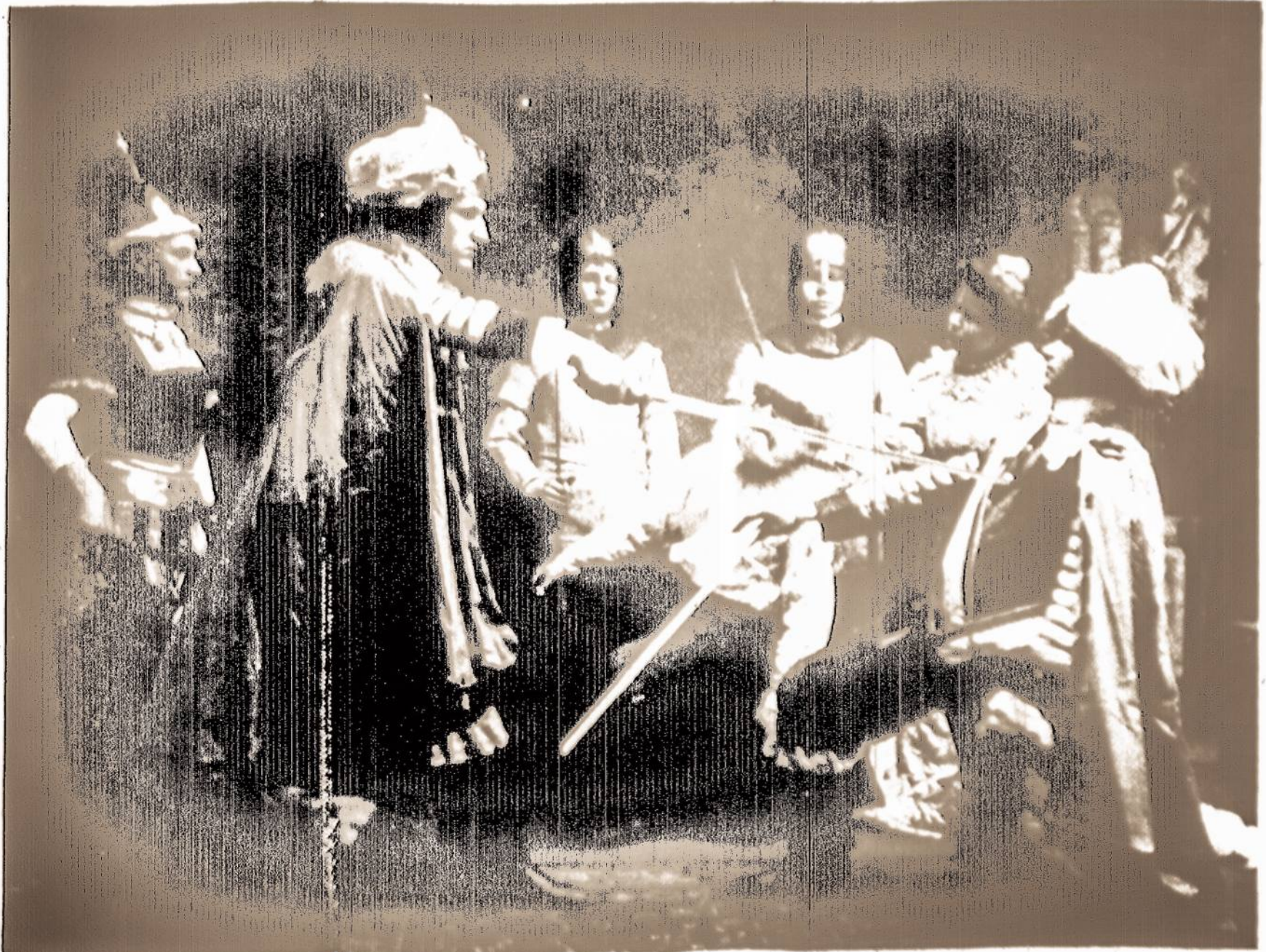
Taip prieš 55 metus Brooklyno lietuviai vaidino "Kęstučio Tragediją". Scenoje vaizduojamas Kęstučio pasmaugimas.