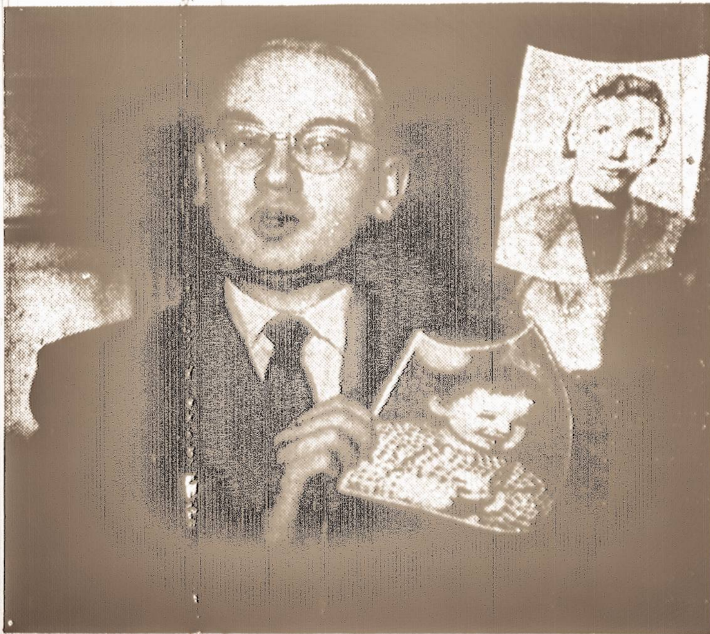
Chochlovas rodo savo žmonos ir sūnaus, likusių Rusijoje, fotografijas

KING MERRITT and CO., INC. 391 Grand Avenue Englewood, New Jersey Tel. Whitehall 4-2220 (N. Y.) Lowell 7-0100 (N. J.)