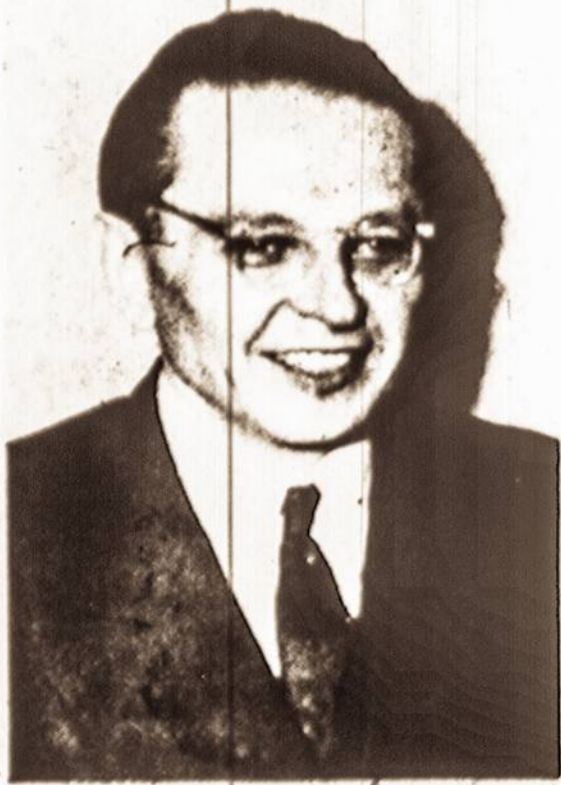
BRONYS RAILA Los Angeles, Calif.

Gal ne vien už sijos, gal daugiau gerovės užuovoje, ramioje koegzistencijoje su savo tautos nelaimėmis, sočiame ir šiltame asmeniniame mišgyje, ilgame poilsyje, kaip kurie medžiaginiame varge, nesvei-