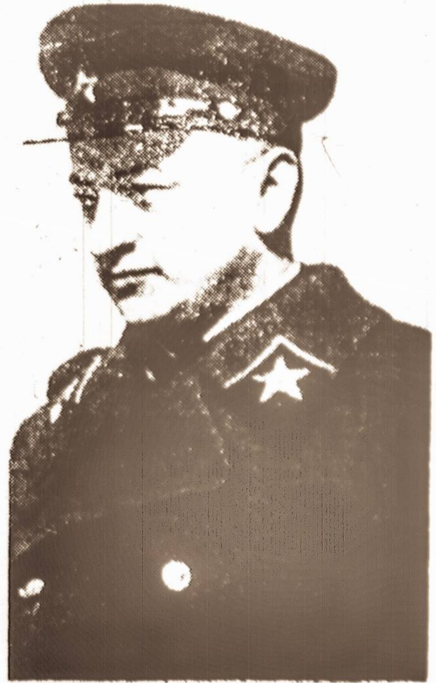
Vokiečiai, įskųsdami maršalą Tuchačevskį, Raudonajai Armijai sudavė didelį smūgį...

Atidengdamas maršalo Tuchačevskio ruošą sąmokslą prieš stalinistinį režimą. - Išžudant virš 30.000 karininkų, Raudonajai Armijai buvo sudotas stiprus smūgis, nuo kurio ji negreit atsigavo.