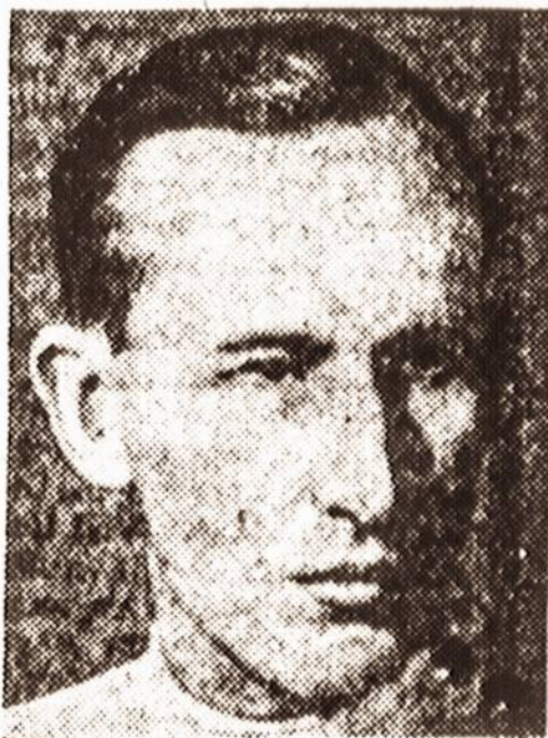
Heydrich, SS žvalgybos viršininkas, buvo nacių režimo ašis.

Vokiečių žvalgyba kartais naudodavo keistus tardymo būdus. Vieną kartą Schellenbergui teko būti liudininku vieno tokio