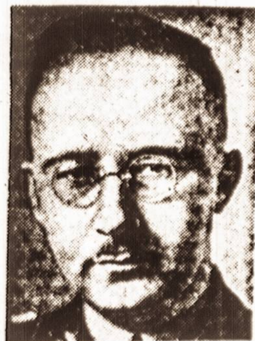
SS vadas Himmler

Heydrich pažiūrėjo į mane įtemptai. Jis nemėgo, kad kas kreiptųsi į jo garbę, bet šį kartą linktelėjo galva ir padavė man Martini stiklą, kuris turėjo kažkokį keistą skonį.