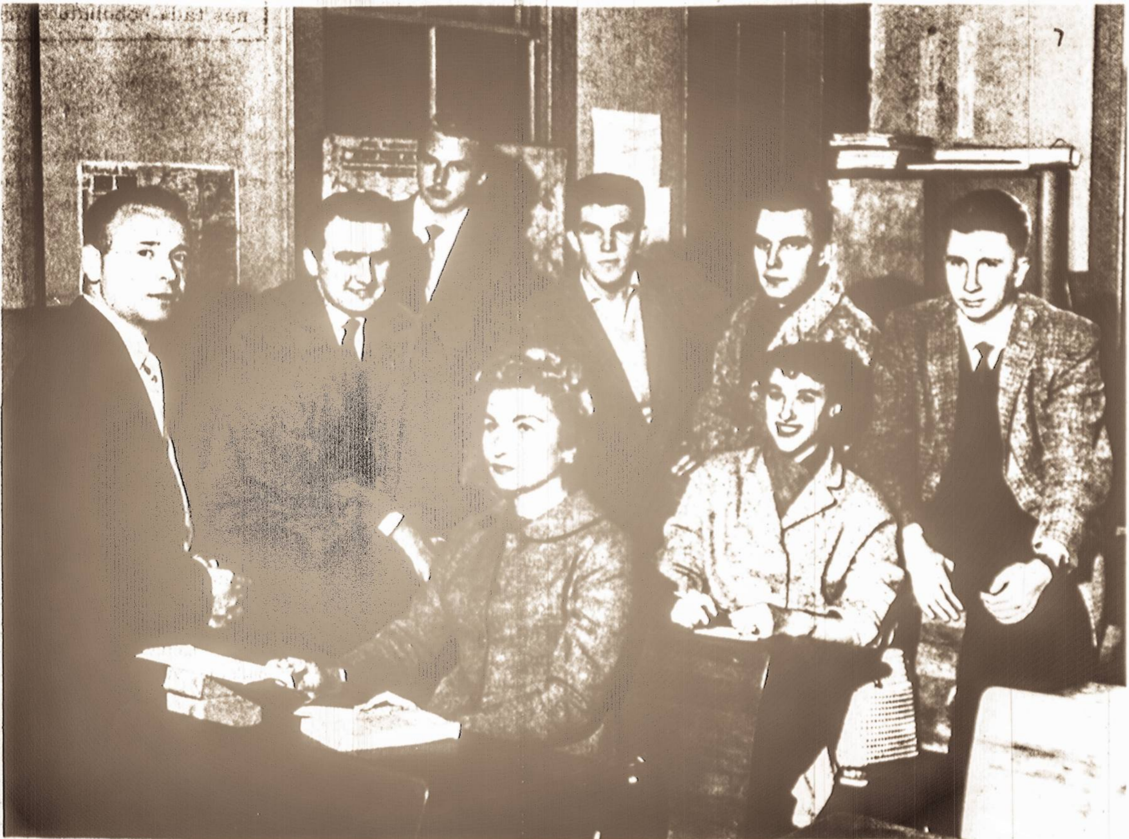
- Vienybės nuotrauka -

Ir mes patys andai teigėme, "kad piliečio auklėjimas yra vienas iš svarbiausių šalies administracijos uždavinių."