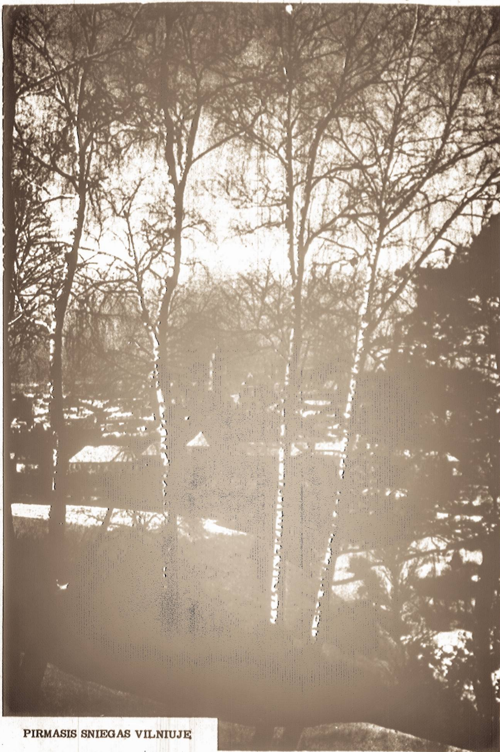
PIRMASIS SNIEGAS VILNIUJE

Veiksniai kviečia ir skatina visuomenę keturiasdešimtąją Lietuvos Nepriklausomybės sukaktį kuo iškilmingiau ir prasmingiau visame pasaulyje minėti ir ta proga sukaupti dvasines ir medžiagines jėgas Lietuvos laisvinimo kovai tęsti iki visiško Lietuvos laisvės ir nepriklausomybės atstatymo.