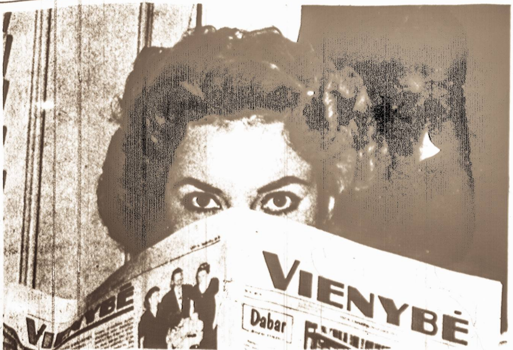
Kam priklauso tos žavincios akys, žvelgiančios pro Vienybės lakštus? Tai Hollywoodo aktorė Rūta Lee Kilmonytė, kuri, kaip jau visiems yra žinoma, dalyvaus Vienybės koncerto programoje, vasario 2 d., Webster Hall, New Yorke.