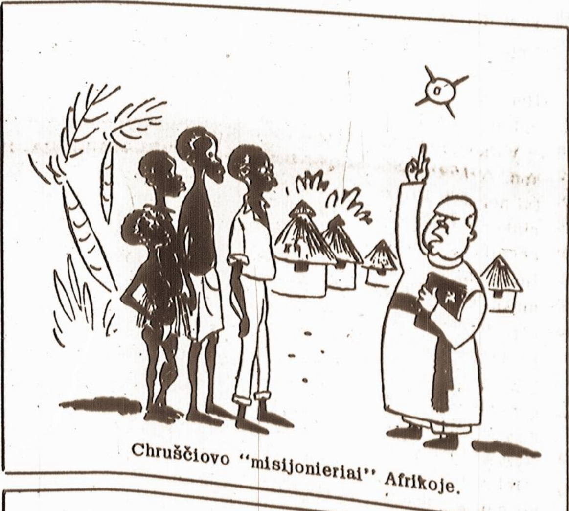
Chruščiovo "misjonieriai" Afrikoje.

metais pasireikš ekonominis pakilimas, kuris padės išlaikyti jo pasiūlyto biudžeto balansą. Tačiau jis pripažino, kad Kongresas gali numatyti daugiau išlaidų, kurios prašoktų beveik 74 bilijonų dolerių sumą. Prezidentas pasisako labiau už nežymų deficitą, negu šiuo metu kelti mokesčius.