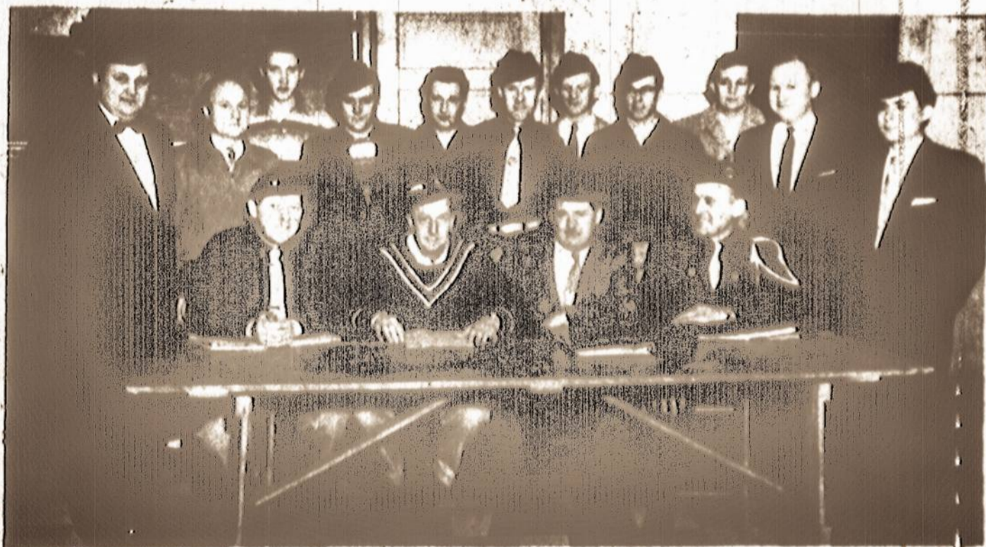
Chicagos Don Varnas Amerikos Legijono lietuviškasis postas, kuris savo veiklumą pasižymi vietinių veteranų tarpe. Šiam postui priklauso virš 100 naujųjų ateivių, Korėjos karo veteranų. Nuotraukoje matyti dalis veiklesniųjų posto narių.