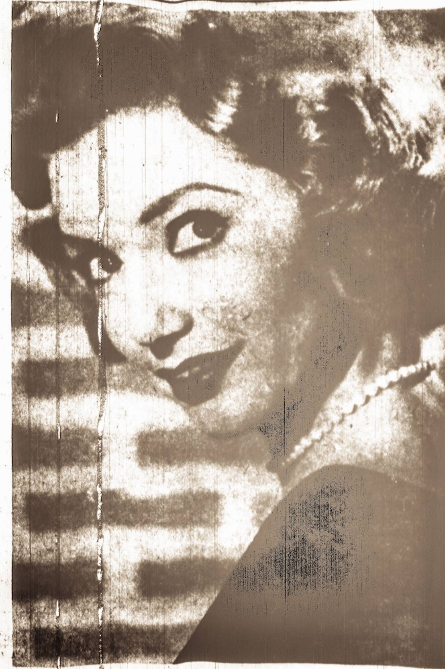
RŪTA LEE KILMONYTE