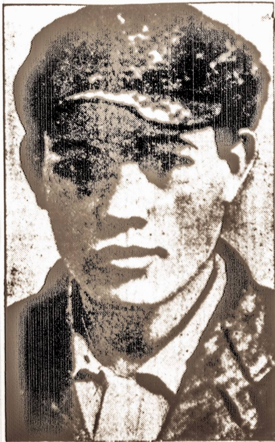
Van der Lubbe