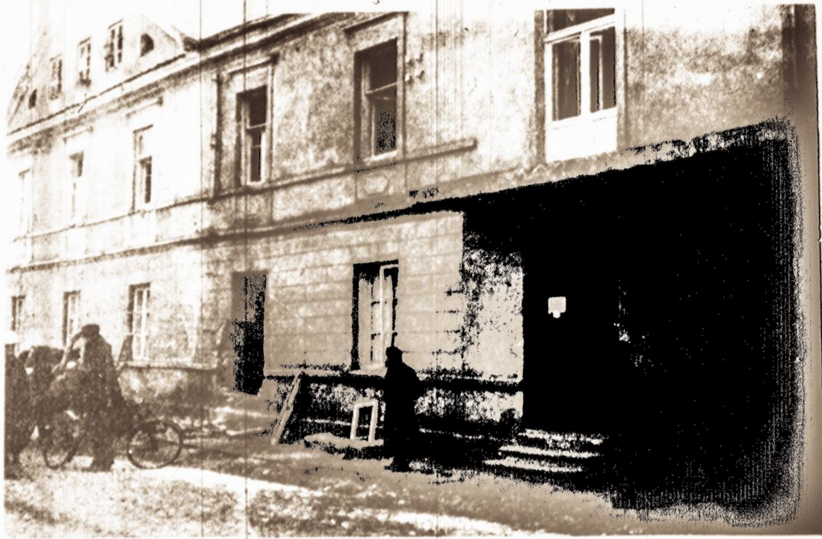
Taip atrodė min. E. Galvanausko buto siena iš Smėlių gatvės šono, sprogdus bombai...