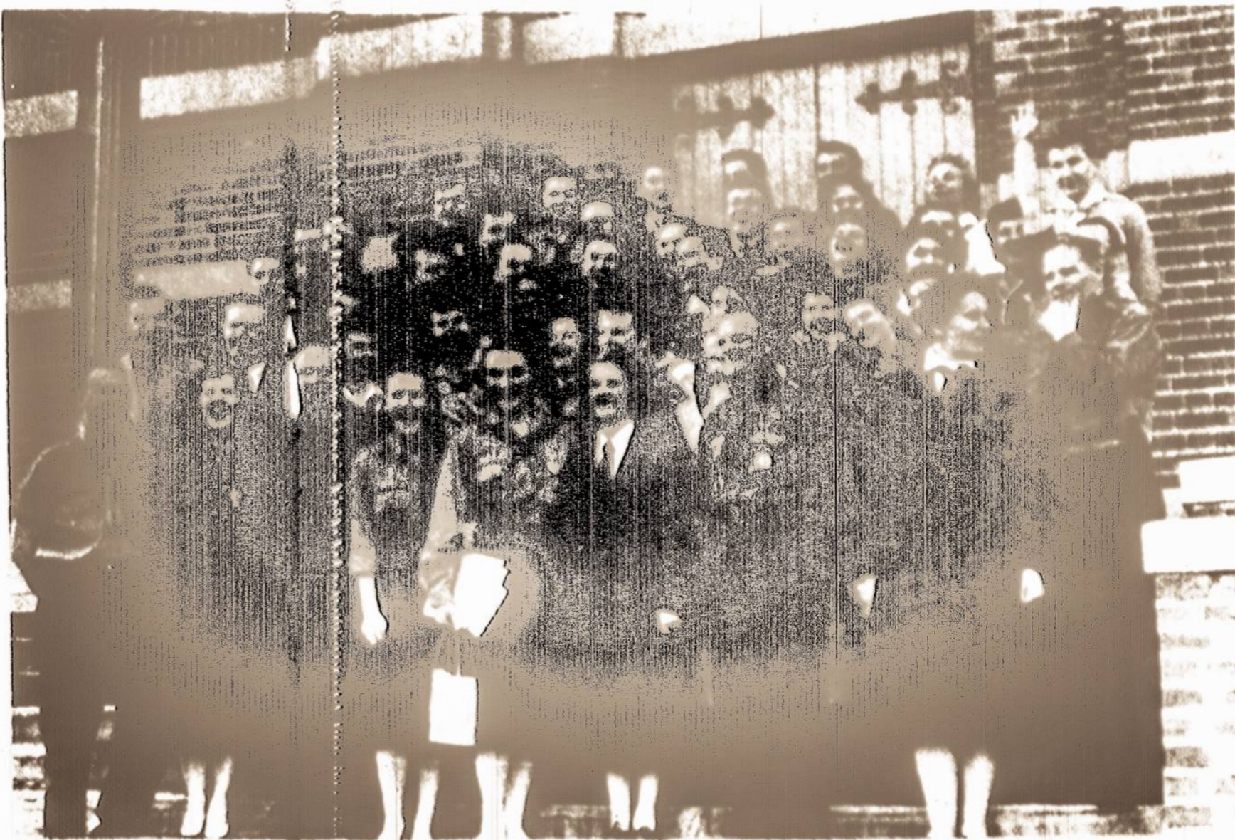
Skautų suvažiavimo New Britaine dalyviai.