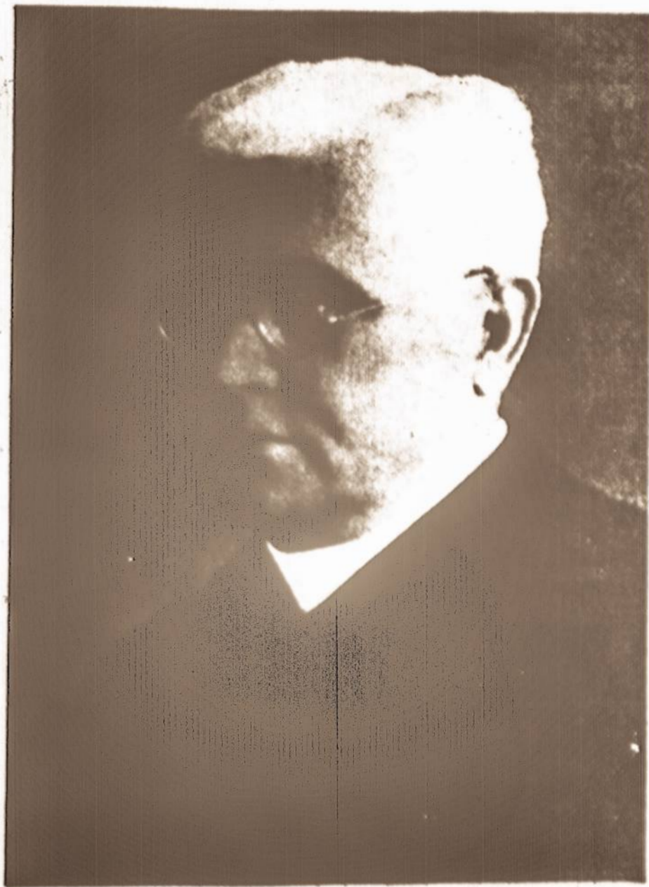
K. Dr. Juozas Tumas - Vaižgantas

"Aš niekam nesu skaitas, o man daug kas. Duodamas kvitų neimdavau net didesnei sumai. Jei skolininkai garbingi, patys tegu atneša Vaižganto namams".