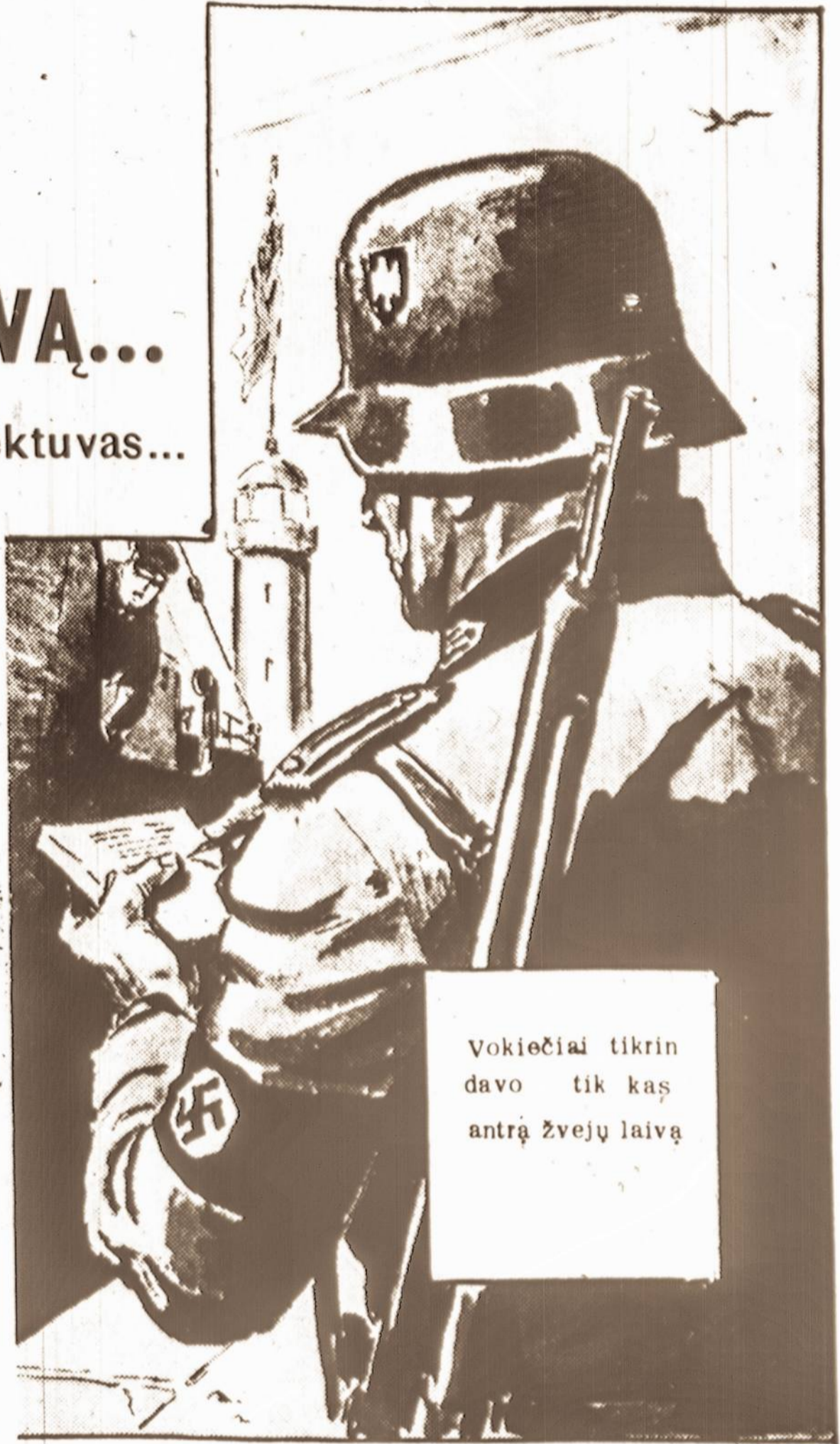
Vokiečiai tikrindavo tik kas antrą žvejų laivą

Tačiau dar viskas nebuvo baigta. Anglų žvejų laivas N 51 kurį anglai naudojo susitikimui su prancūzų žvejais, buvo paskyręs pasimatymą jūroje tik 4 valandą vakare. Reikėjo išbūti jūroje dar aštuonias valandas. Prieš ketvirtą valandą Alex atidarė dangtį paskelbdamas, kad netoli mato dvistebį žvejų laivą, kuris neturėjo jokio pagrindo būti šioj vietoj. Be abejo tai buvo "N 51", bet reikėjo laukti kad būtų tikriems. Takymas iš