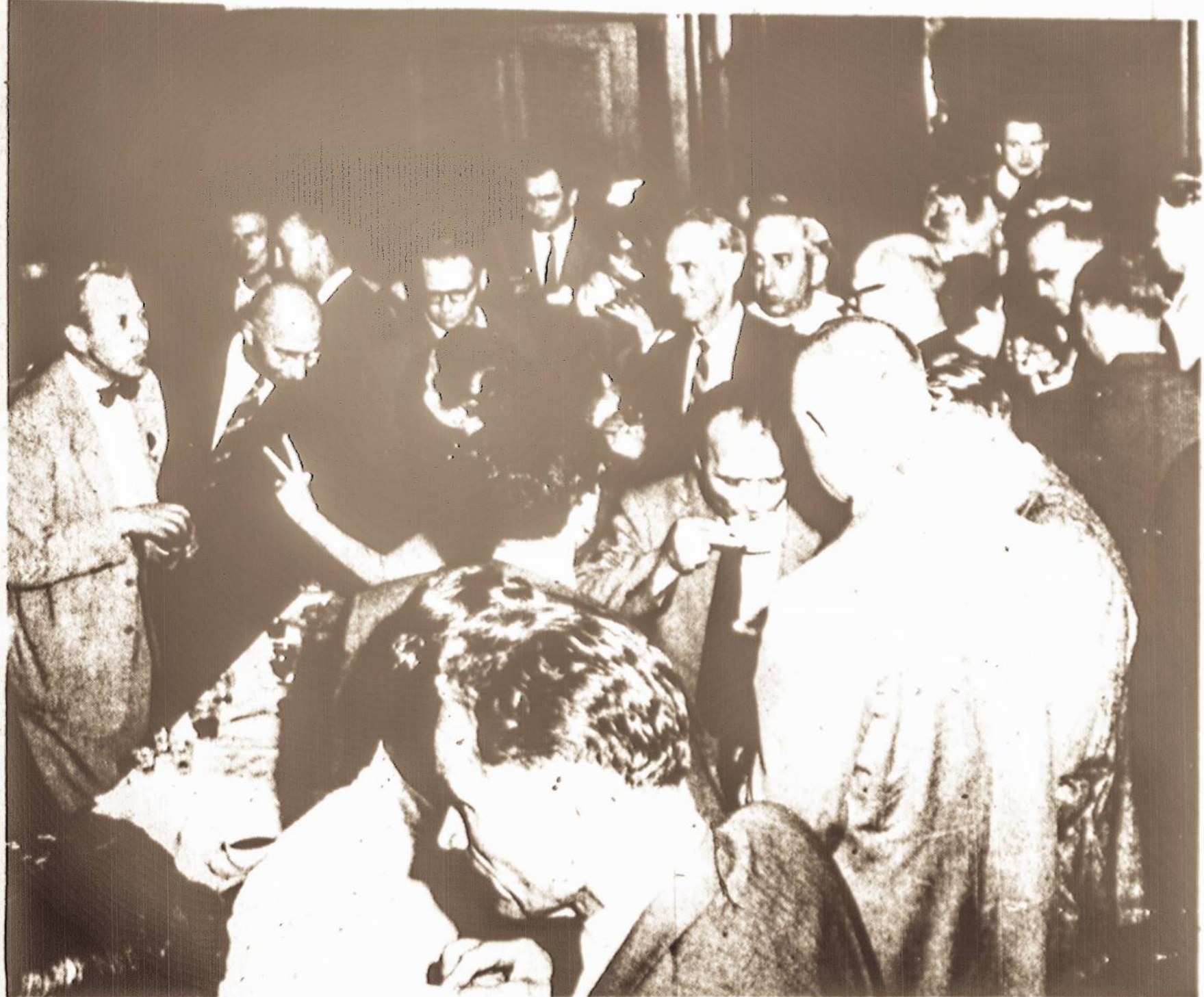
Vaidas iš "poezijos ir diskusijų vakaro", įvykusio PLB Seimo metu Baltijos Laisvės Namuose New Yorke. Nuotrauka daryta vaišių metu, po diskusijų.

* Maskvoje platinami atsišaukimai prieš Chruščiovą, kad jis esąs svarbiausias kaltininkas gyvenimo brangumo.