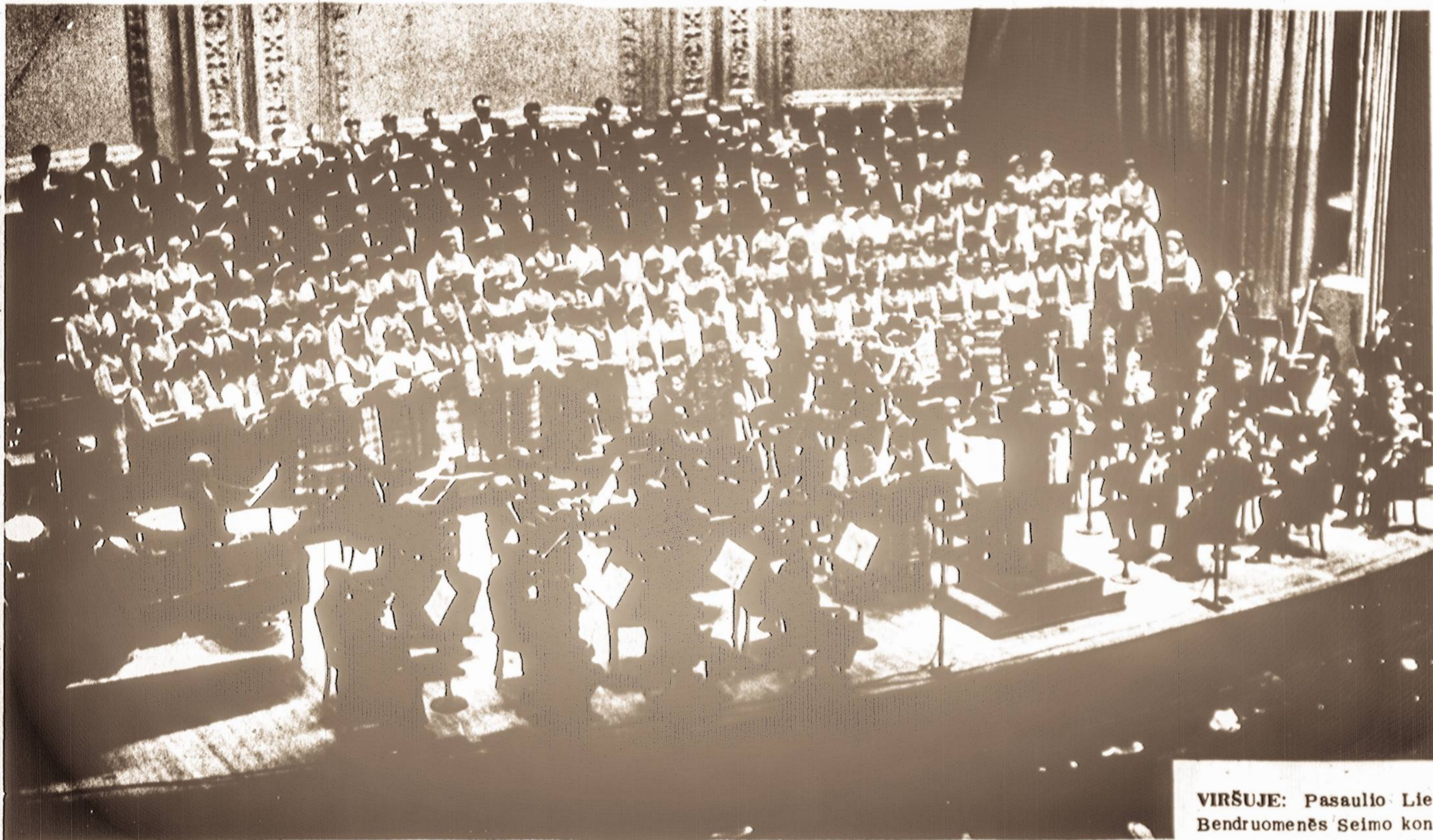
VIRŠUJE: Pasaulio Lietuvių Bendruomenės Seimo koncerto programos metu Carnegie Hall. Scenoje dirigentas, choristai, solistai ir simfoninio orkestro nariai.