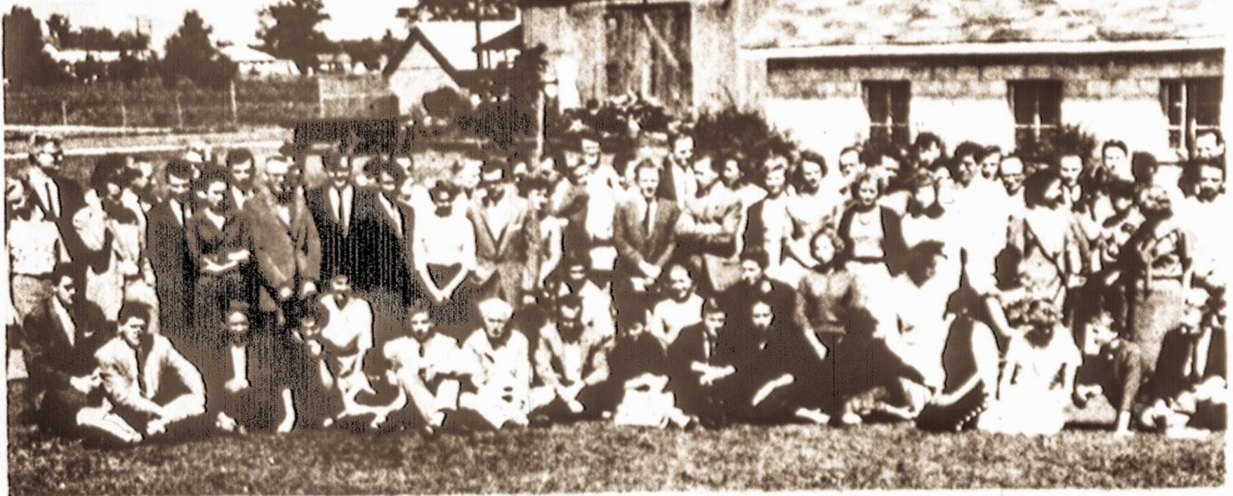
Santaros suvažiavimo dalyviai

* Paskutiniai amerikiečių marinių daliniai išplaukė iš Beiruto. Libane dar liko apie 7,500 amerikiečių sausumos kariuomenės karių, kurie bus atitraukti iki šio mėnesio pabaigos.